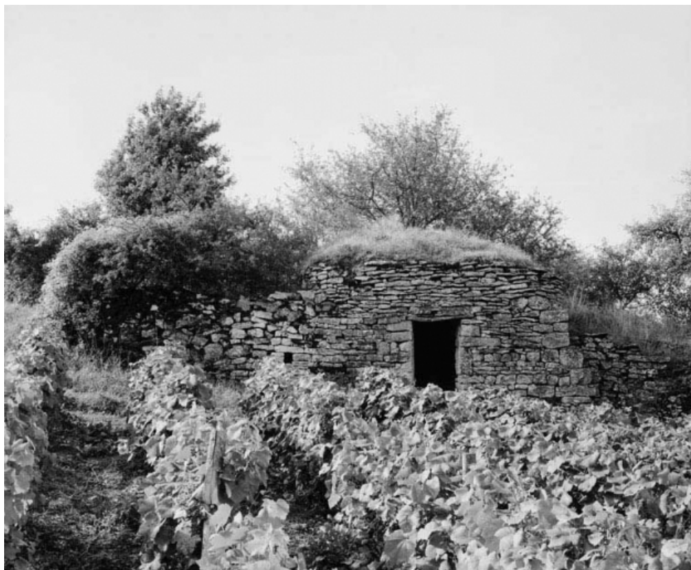
Vue d'ensemble de la cabane et du mur de soutènement.

21, Cormot-le-Grand C.R. 7 dit Rue des Vaches 2e cabane