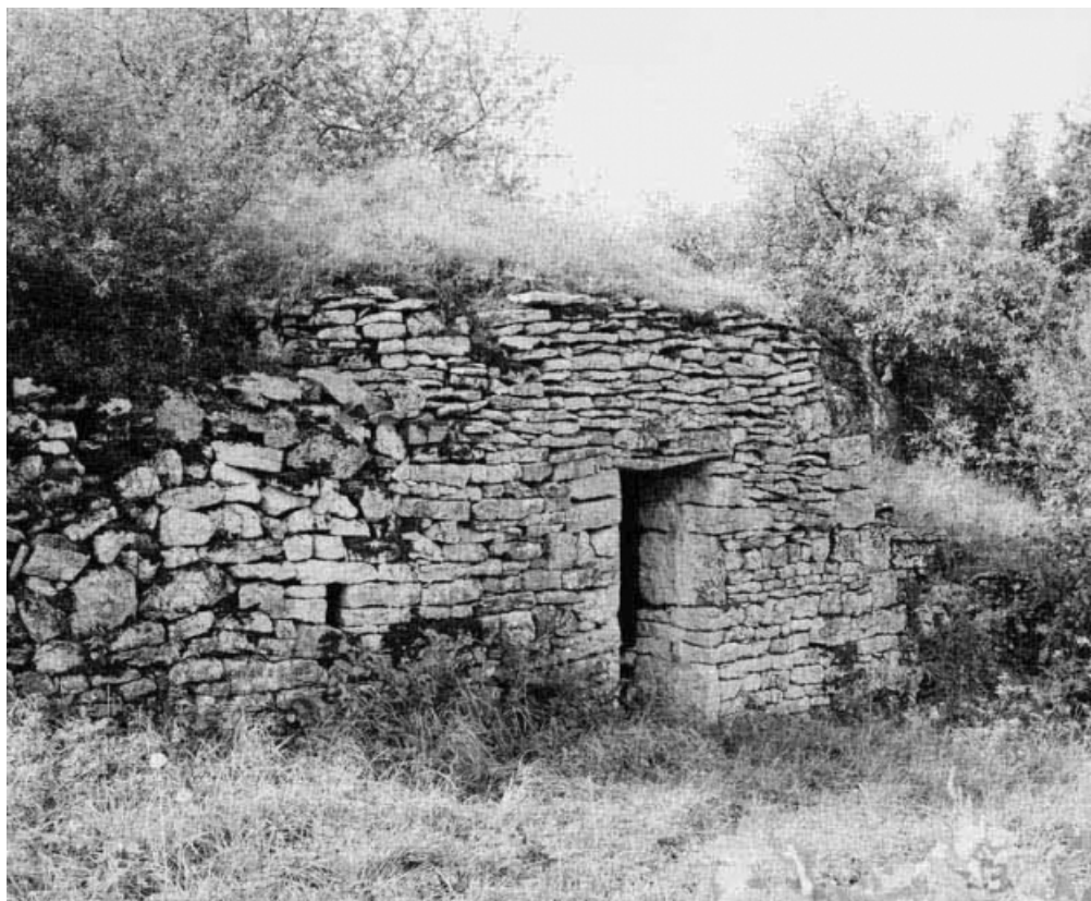
Vue de trois quarts gauche, élévation antérieure de la cabane.

21, Cormot-le-Grand C.R. 7 dit Rue des Vaches 2e cabane