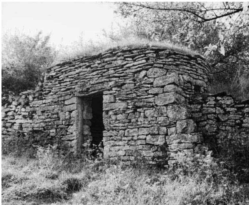
Vue de trois quarts droit, élévation antérieure de la cabane.

21, Cormot-le-Grand C.R. 7 dit Rue des Vaches 2e cabane