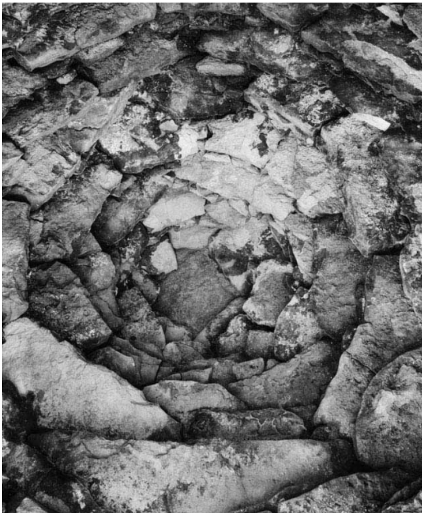
Vue de l'intérieur: détail de la voûte.

21, Cormot-le-Grand C.R. 7 dit Rue des Vaches 2e cabane