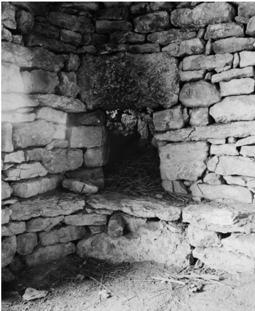
Vue de l'intérieur: détail du conduit de cheminée.

21, Cormot-le-Grand C.R. 7 dit Rue des Vaches 2e cabane