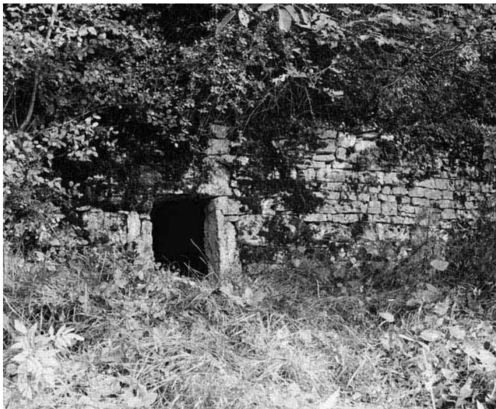
Vue de l'élévation antérieure de la cabane.

21, Cormot-le-Grand C.R. 7 dit Rue des Vaches 1ère cabane