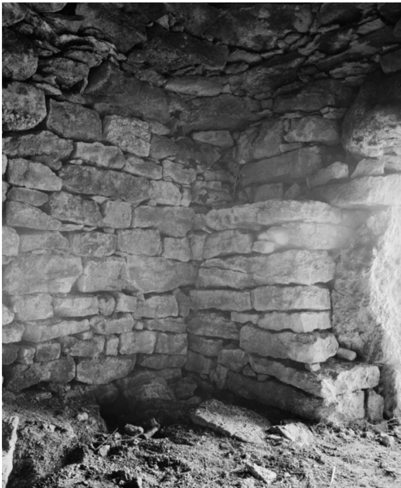
Vue intérieure : retraite du mur formant tablette, à droite de l'entrée. 21, Cormot-le-Grand C.R. 7 dit Rue des Vaches 1ère cabane