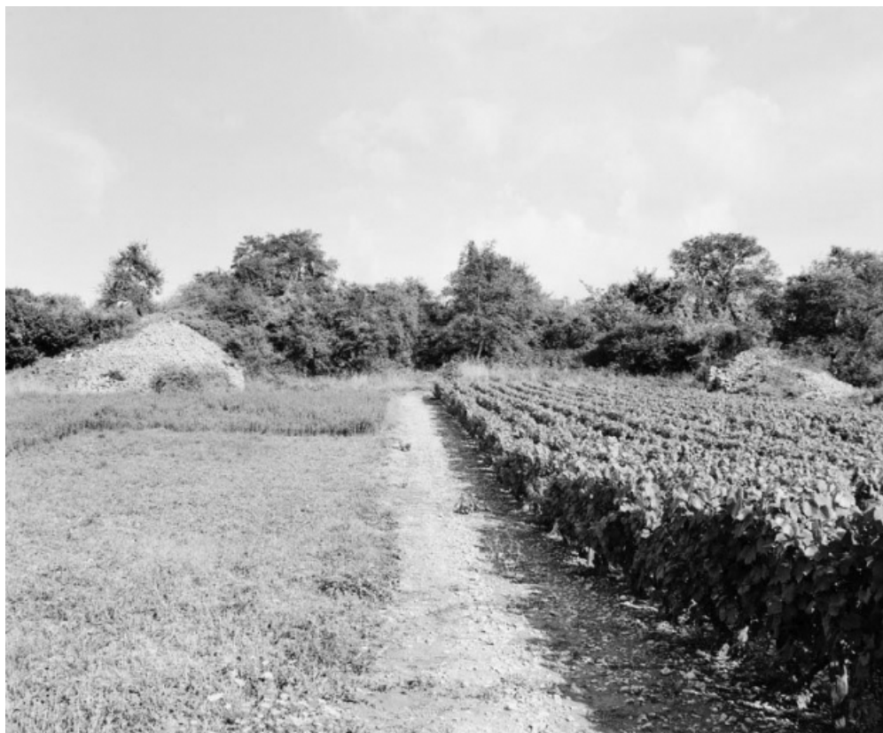
Vue d'ensemble de la cabane et des murgers : la cabane est située dans l'axe de la prise de vue. 21, Cormot-le-Grand C.R. 7 dit Rue des Vaches 1ère cabane