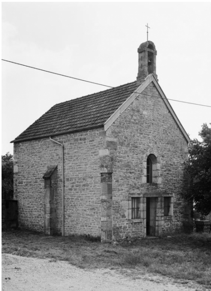
Vue de la façade et du mur gauche.