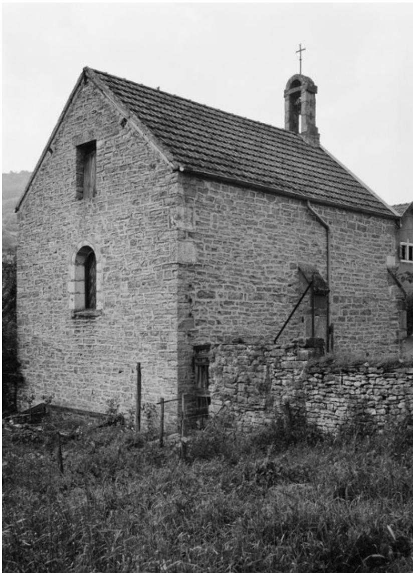
Vue du chevet du mur gauche.