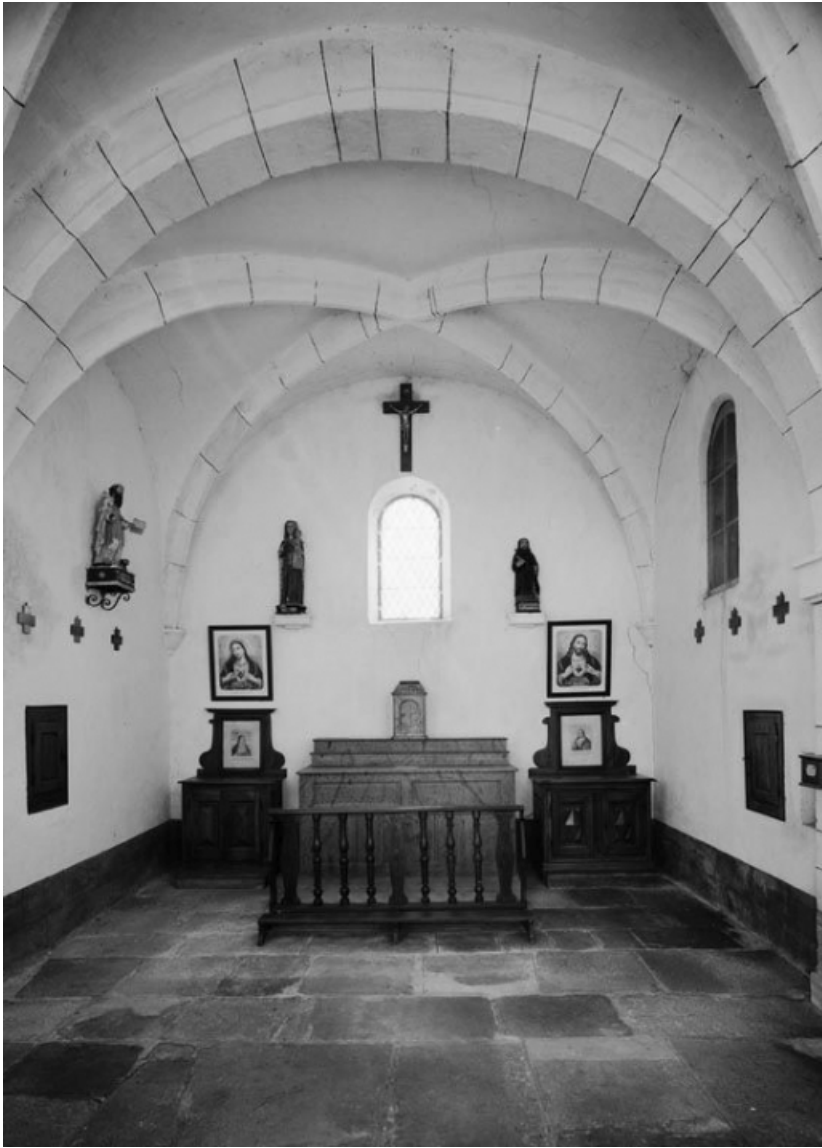
Vue de l'intérieur, depuis l'entrée.