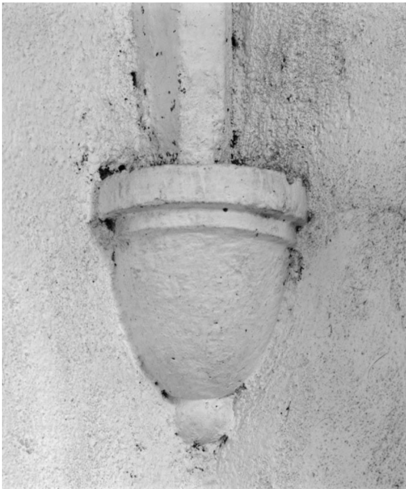
Détail du culot postérieur gauche de la 2ème travée.