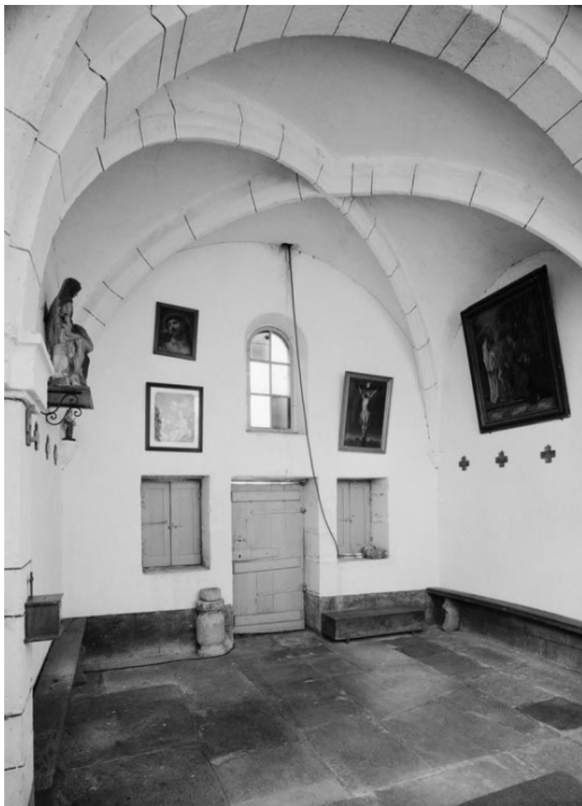
Vue de l'intérieur, depuis l'autel.