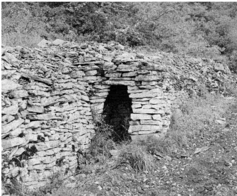
Partie antérieure de la cabane et mur de soutènement.

21, Chassagne-Montrachet Proximité C.D. 113 a, lieu dit : Clos Pitois