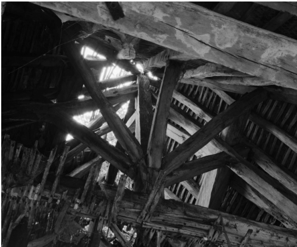
Charpente de l'ancienne abside (en 1979).

21, Aubigny-la-Ronce R.D. 33, à l'ouest du village