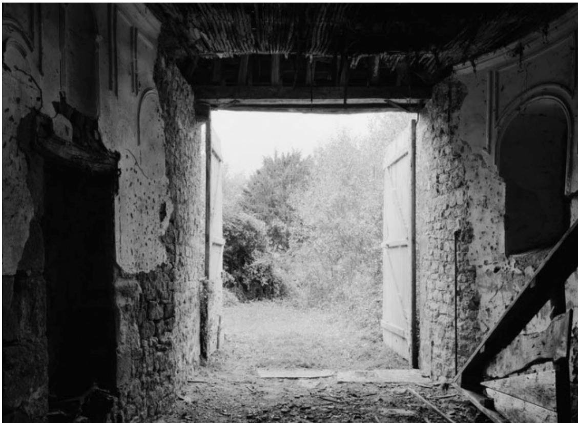
Vestiges de l'abside (en 1979).

21, Aubigny-la-Ronce R.D. 33, à l'ouest du village