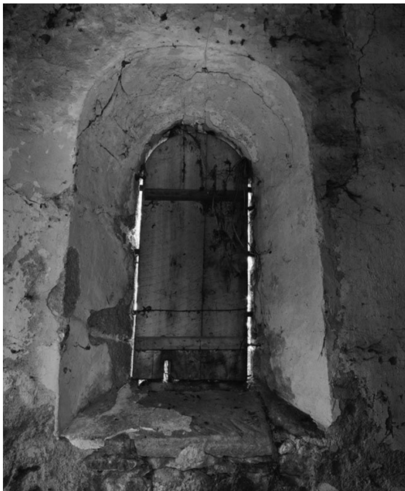
Détail de la fenêtre droite (en 1979).

21, Aubigny-la-Ronce R.D. 33, à l'ouest du village