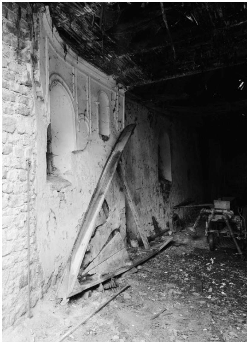
Élévation intérieure droite (en 1979).

21, Aubigny-la-Ronce R.D. 33, à l'ouest du village