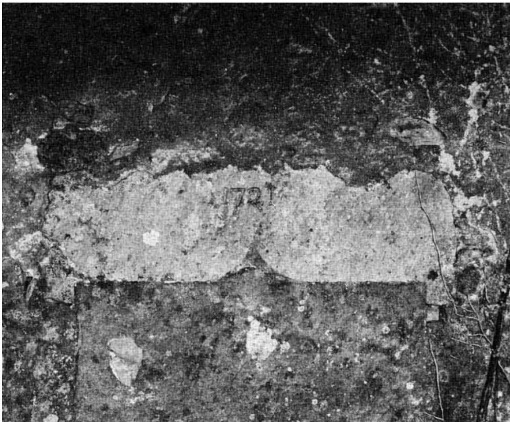
Détail du linteau de la porte latérale gauche (murée) (en 1979).

21, Aubigny-la-Ronce R.D. 33, à l'ouest du village