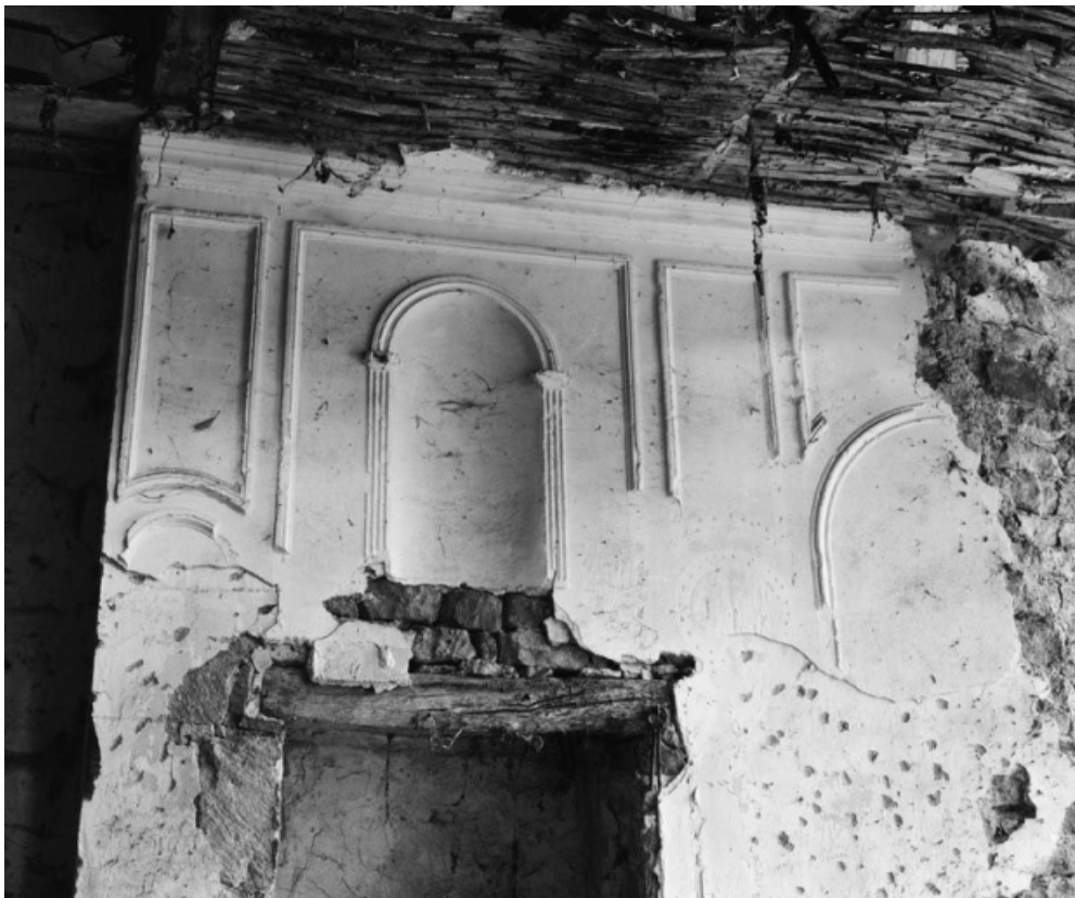
Détail du décor en stuc du mur gauche (en 1979). 21, Aubigny-la-Ronce R.D. 33, à l'ouest du village