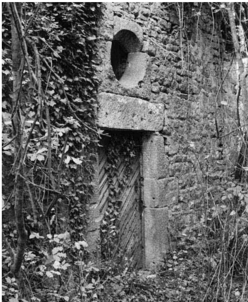
Détail de la porte d'entrée (en 1979).

21, Aubigny-la-Ronce R.D. 33, à l'ouest du village