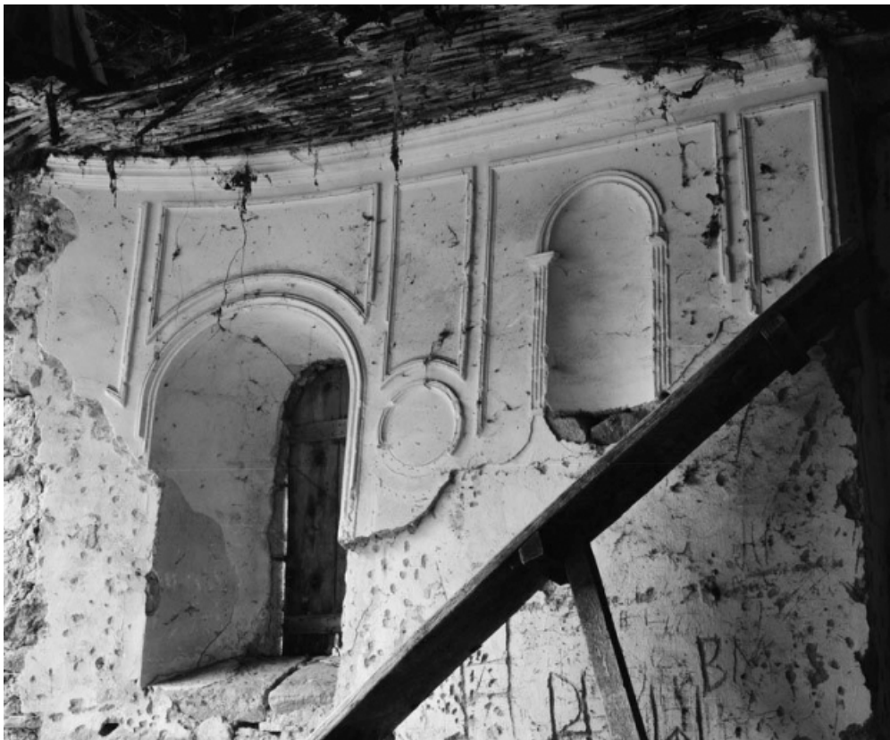
Détail du décor en stuc du mur droit (en 1979). 21, Aubigny-la-Ronce R.D. 33, à l'ouest du village