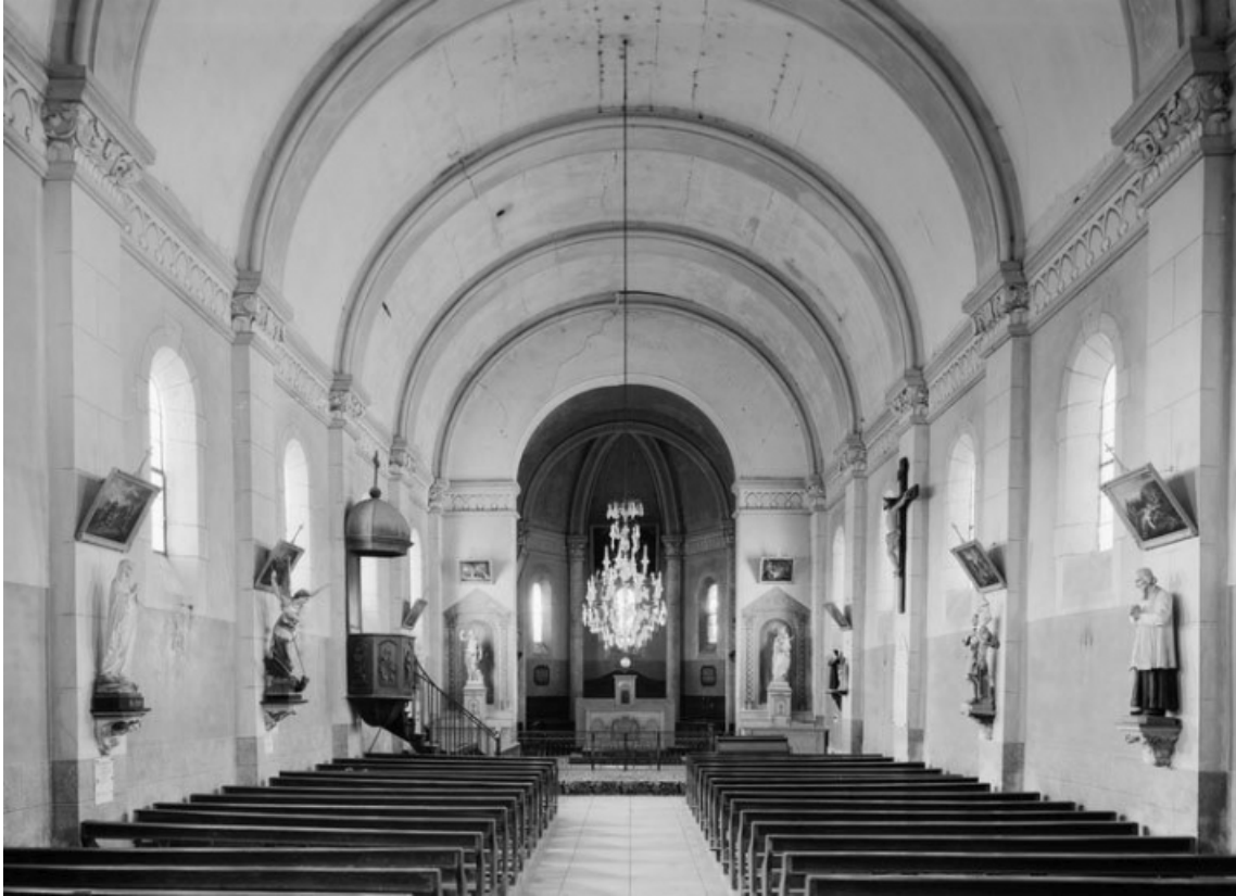
Vue d'ensemble de l'intérieur, depuis l'entrée.