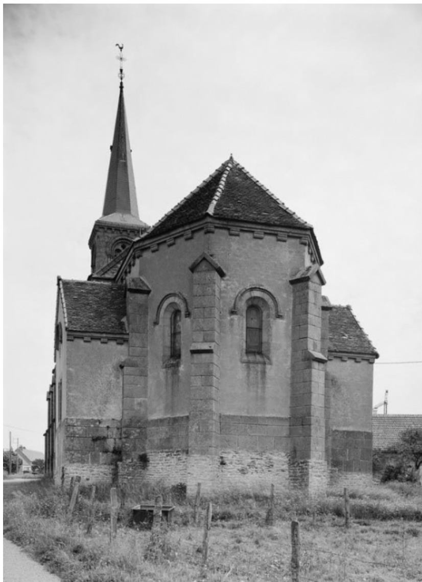
Vue du chevet.