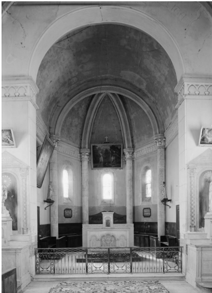
Vue du chœur.