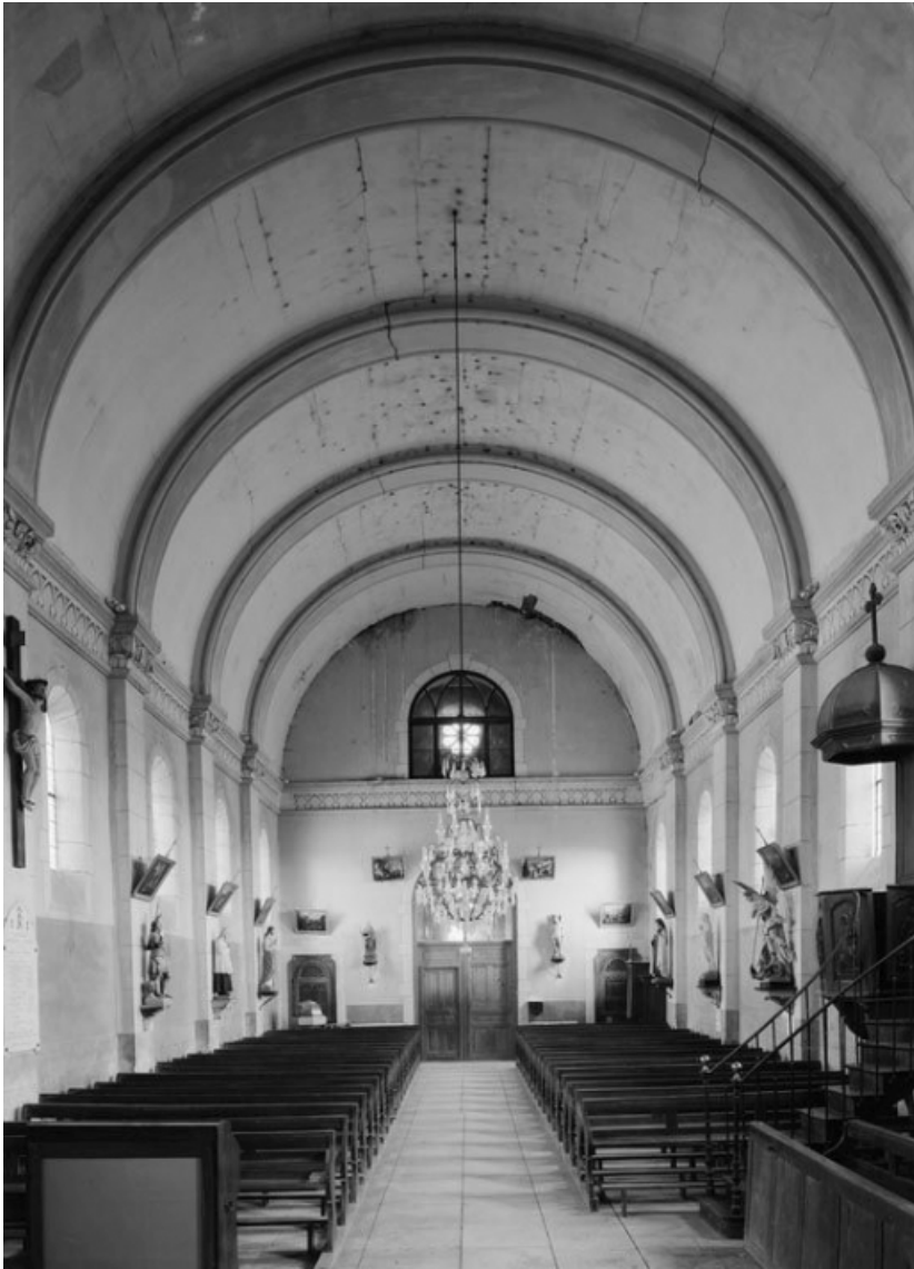
Vue de la nef depuis le chœur.