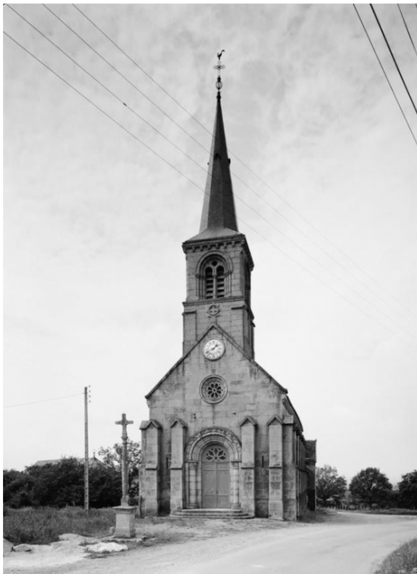
Vue de la façade.