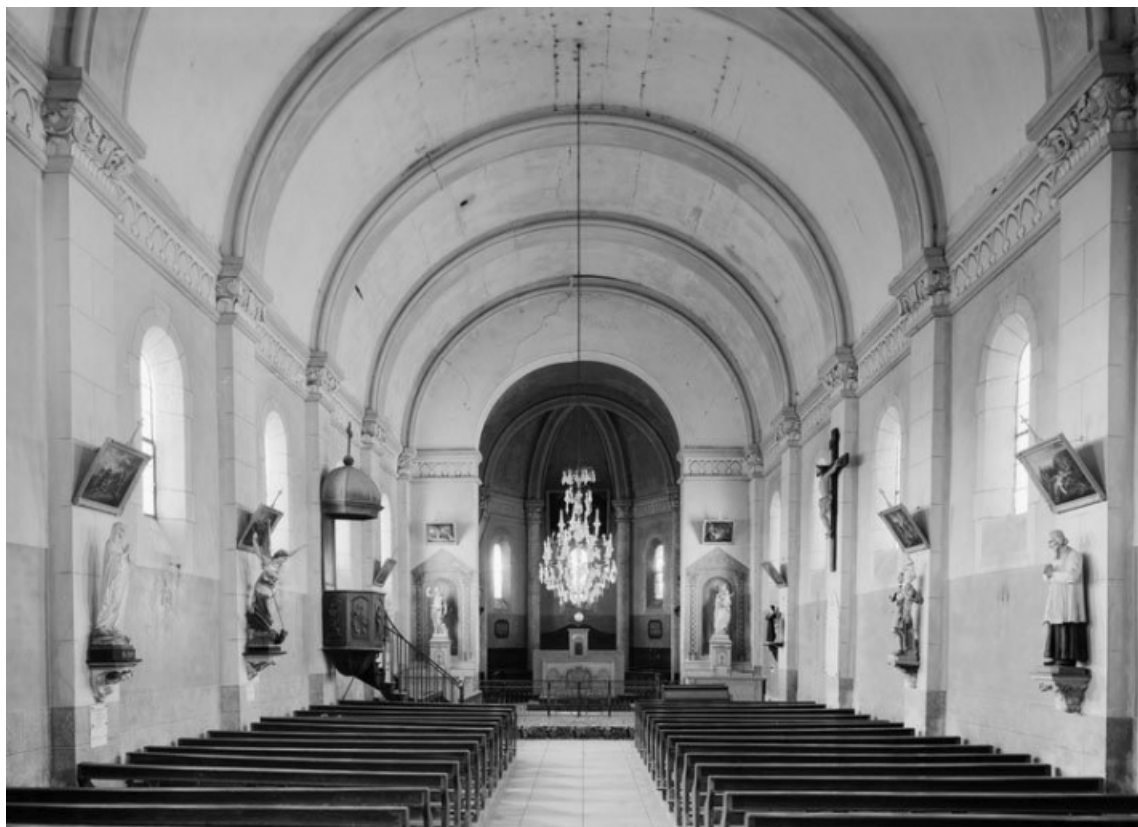
Vue d'ensemble de l'intérieur, depuis l'entrée.