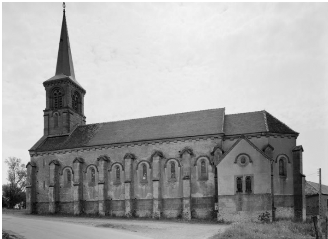
Vue de l'élévation droite.