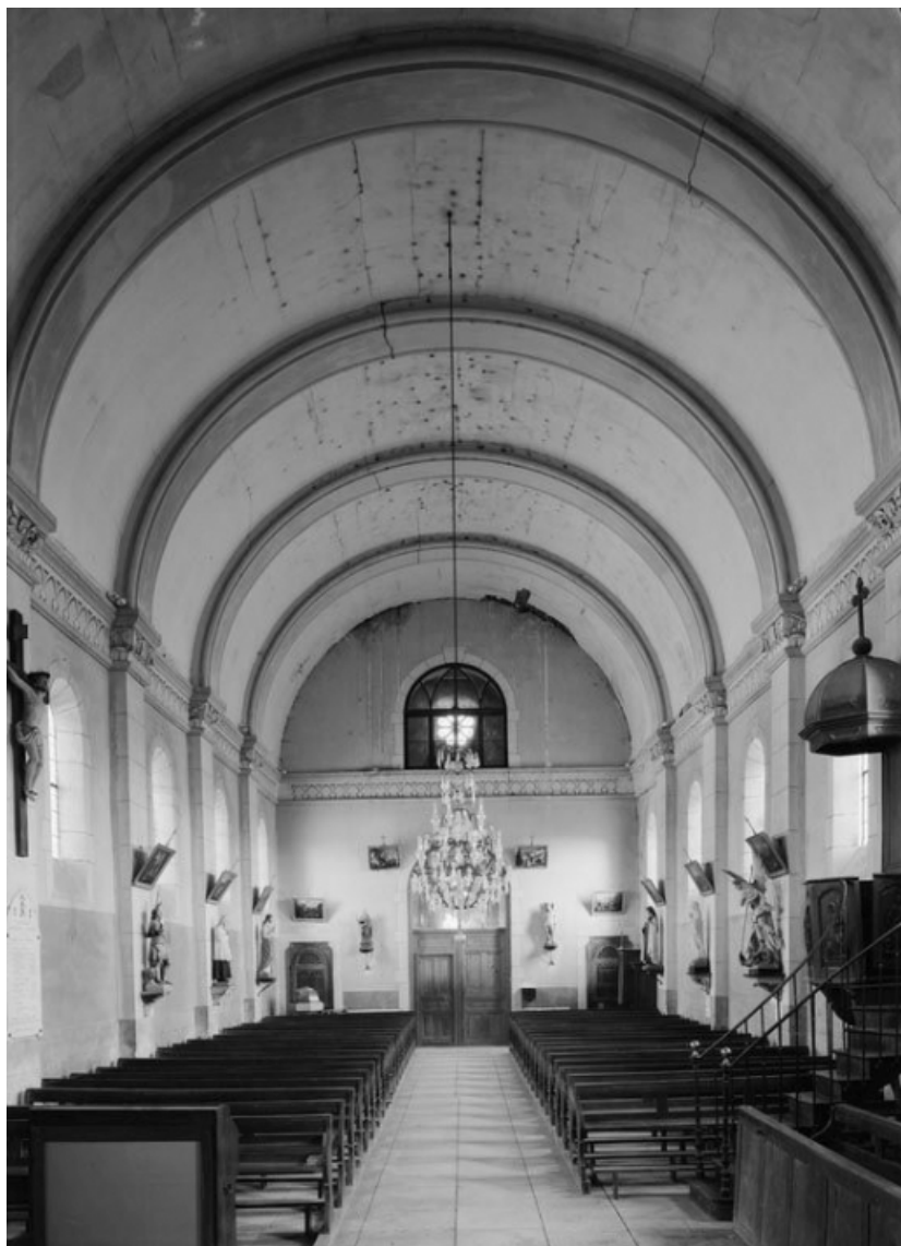
Vue de la nef depuis le chœur.