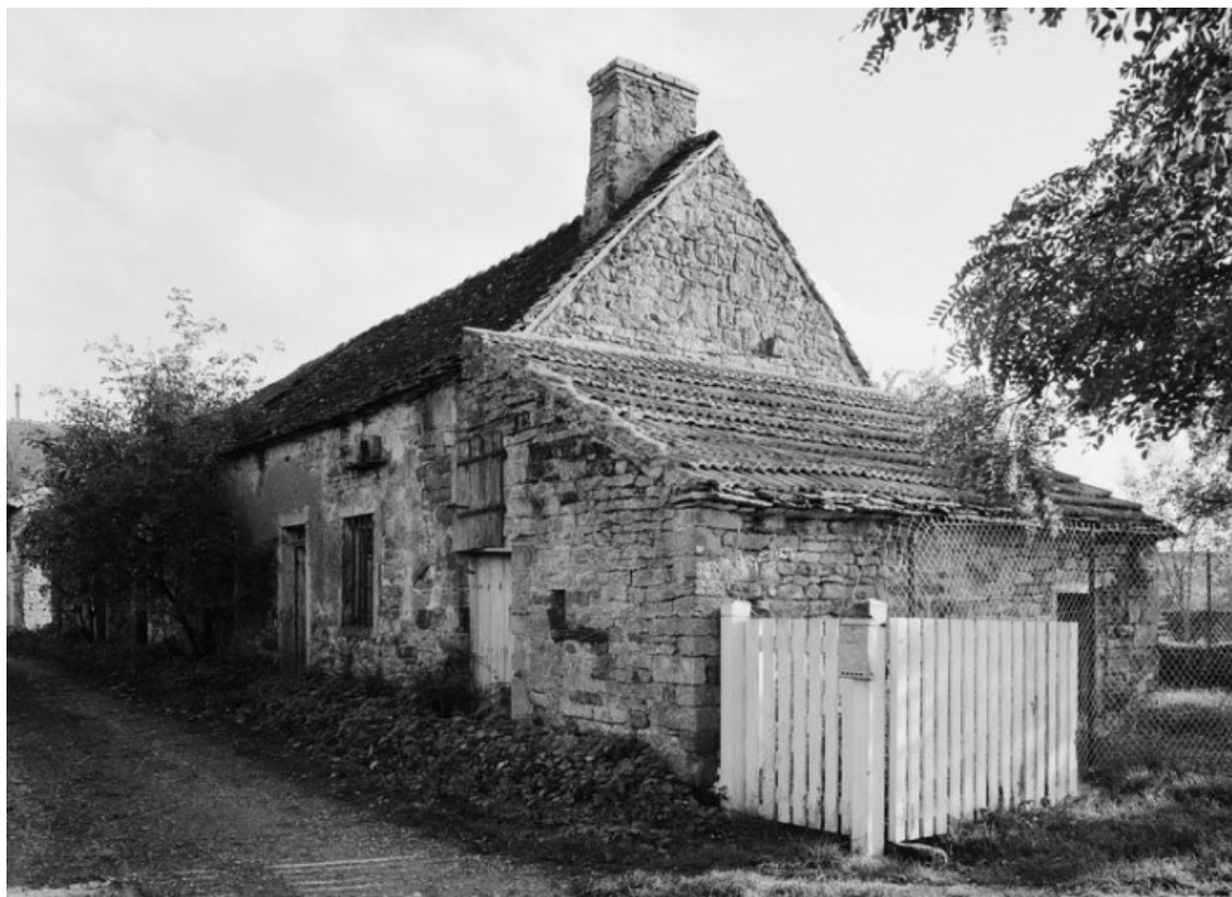
Vue d'ensemble de trois quarts droit d'une maison (parcelle 132 sur le plan cadastral de 1988, section AB). 21, Aubigny-la-Ronce