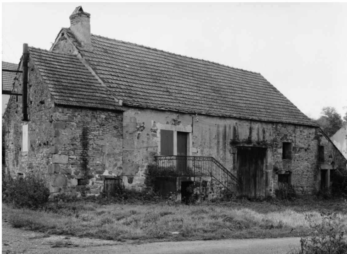
Vue d'ensemble d'une ferme (parcelle 105 sur le plan cadastral de 1959, section A1). 21, Aubigny-la-Ronce