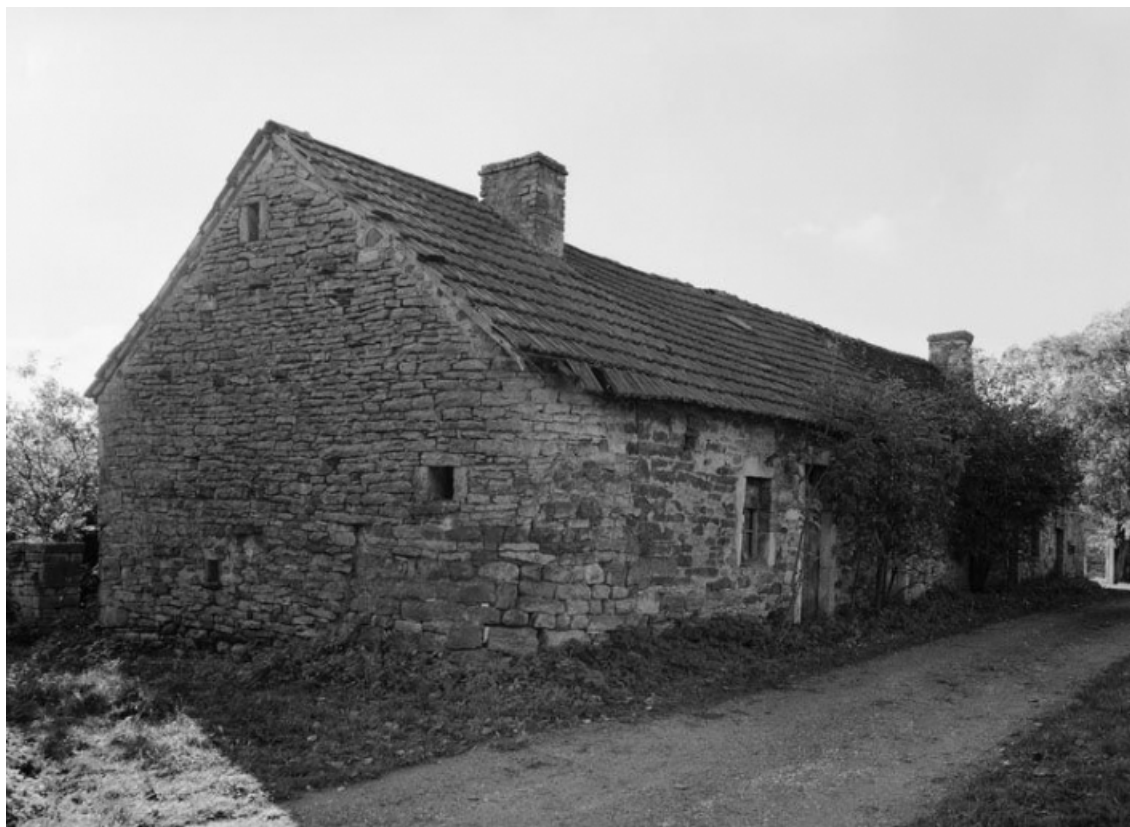
Vue d'ensemble de trois quarts gauche d'une maison (parcelle 132 sur le plan cadastral de 1988, section AB). 21, Aubigny-la-Ronce