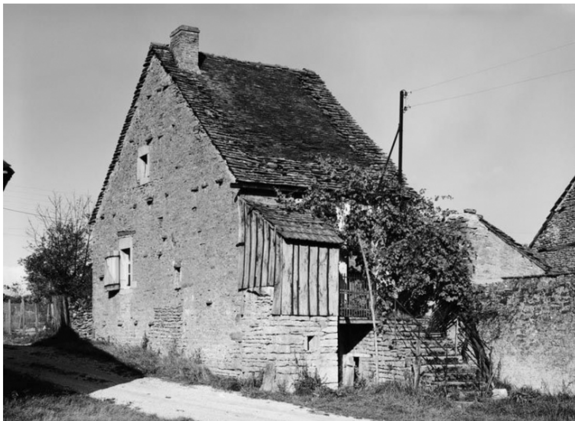
Vue d'ensemble d'une maison (parcelle 99 sur le plan cadastral de 1988, section AB). 21, Aubigny-la-Ronce