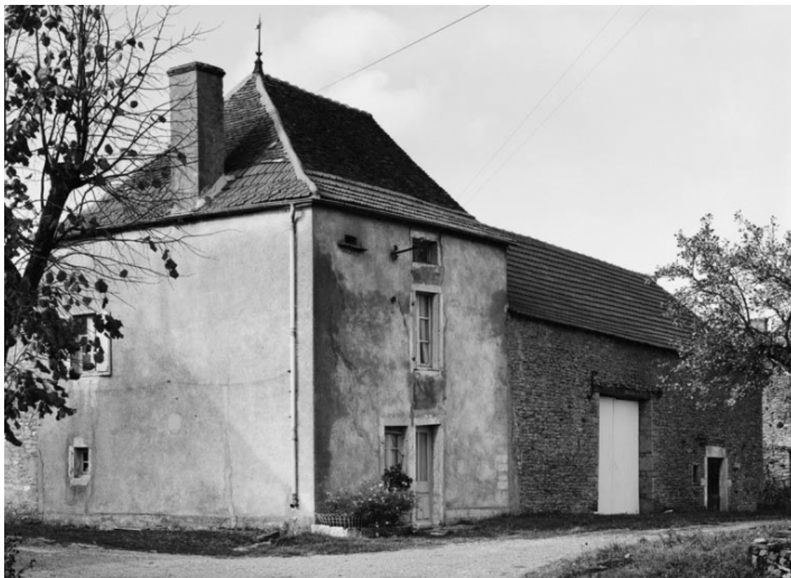
Vue d'ensemble d'une maison (parcelle 166 sur le plan cadastral de 1988, section AB). 21, Aubigny-la-Ronce