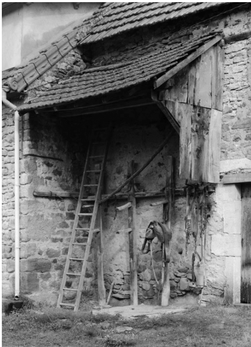
Détail de l'auvent d'une ferme (parcelle 118 sur le plan cadastral de 1959, section A1). 21, Aubigny-la-Ronce