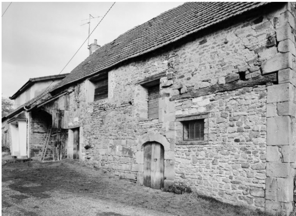
Vue d'ensemble d'une ferme (parcelle 118 sur le plan cadastral de 1959, section A1). 21, Aubigny-la-Ronce