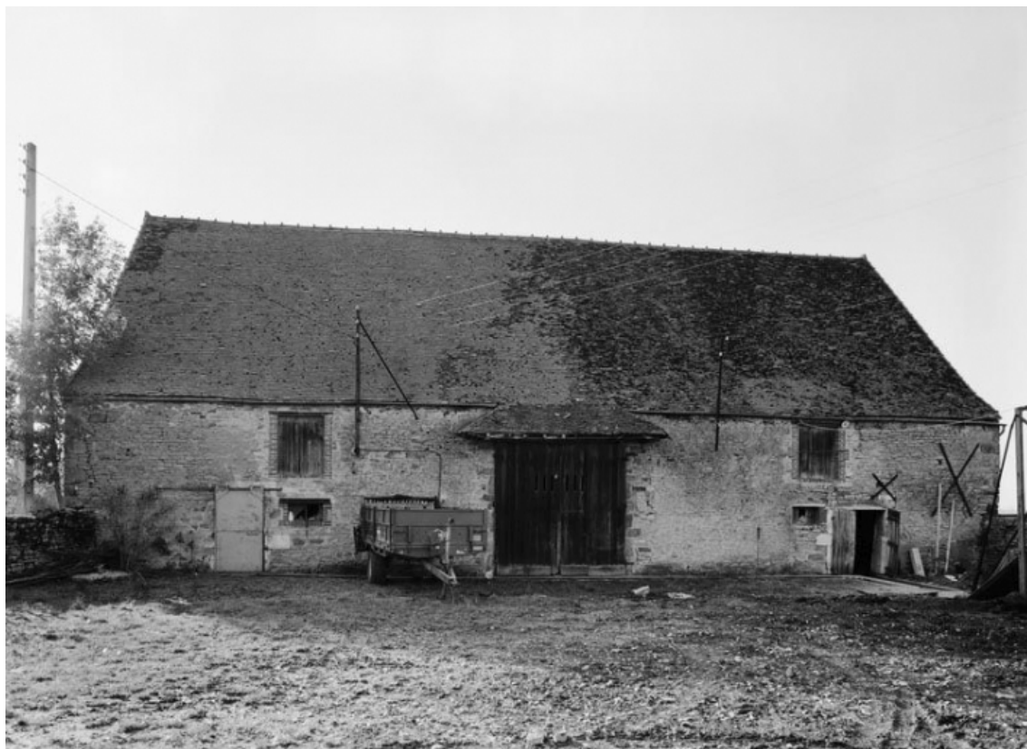
Vue d'ensemble d'une ferme (parcelle 19 sur le plan cadastral de 1988, section AB). 21, Aubigny-la-Ronce