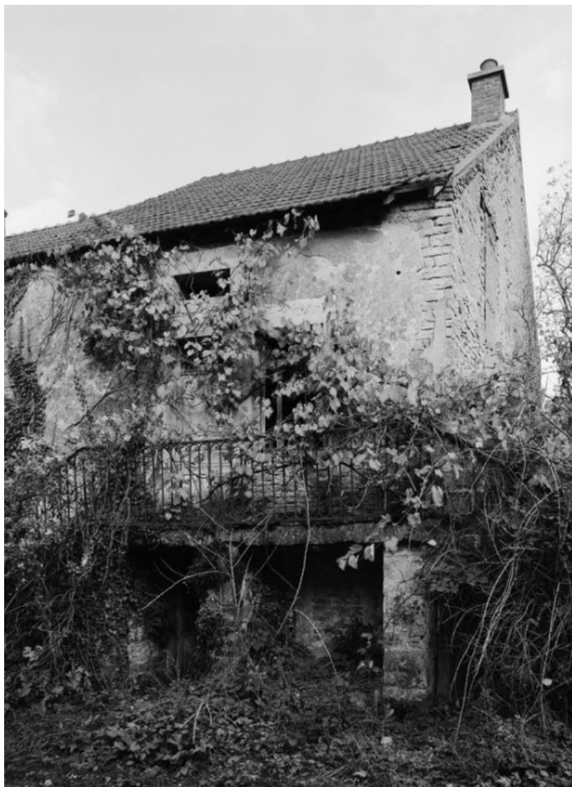
Vue d'ensemble d'une maison (parcelle 192 sur le plan cadastral de 1988, section AB). 21, Aubigny-la-Ronce