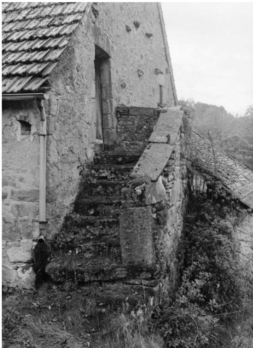
Détail de l'escalier extérieur d'une maison (parcelle 94 sur le plan cadastral de 1959, section A1). 21, Aubigny-la-Ronce