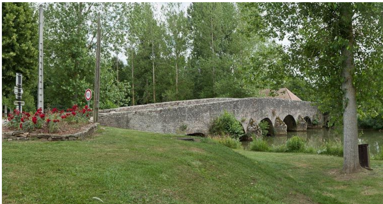
Vue du pont ancien sur l'Ouche prolongeant le pont sur l'écluse 36 du versant Saône. 21, Sainte-Marie-sur-Ouche

N° de l'illustration : 20112103511NUC4AQ