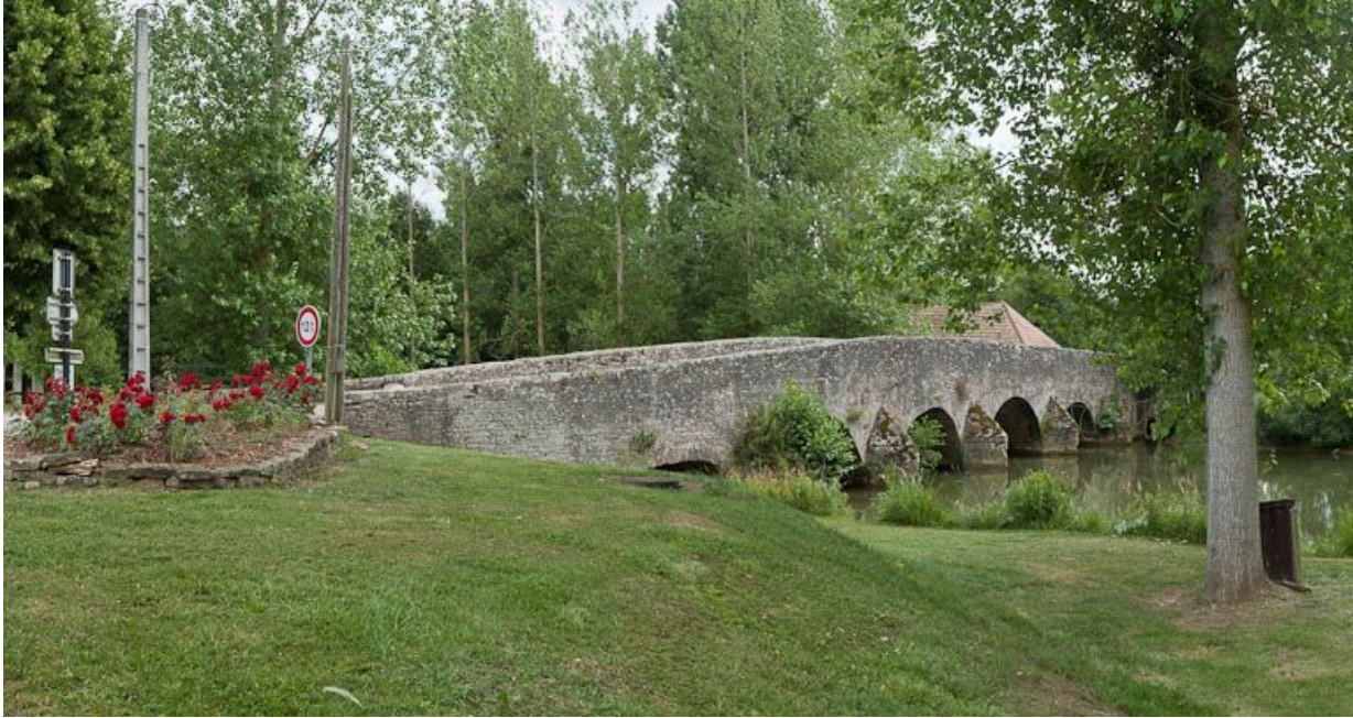
Vue du pont ancien sur l'Ouche prolongeant le pont sur l'écluse 36 du versant Saône. 21, Sainte-Marie-sur-Ouche

N° de l'illustration : 20112103511NUC4AQ