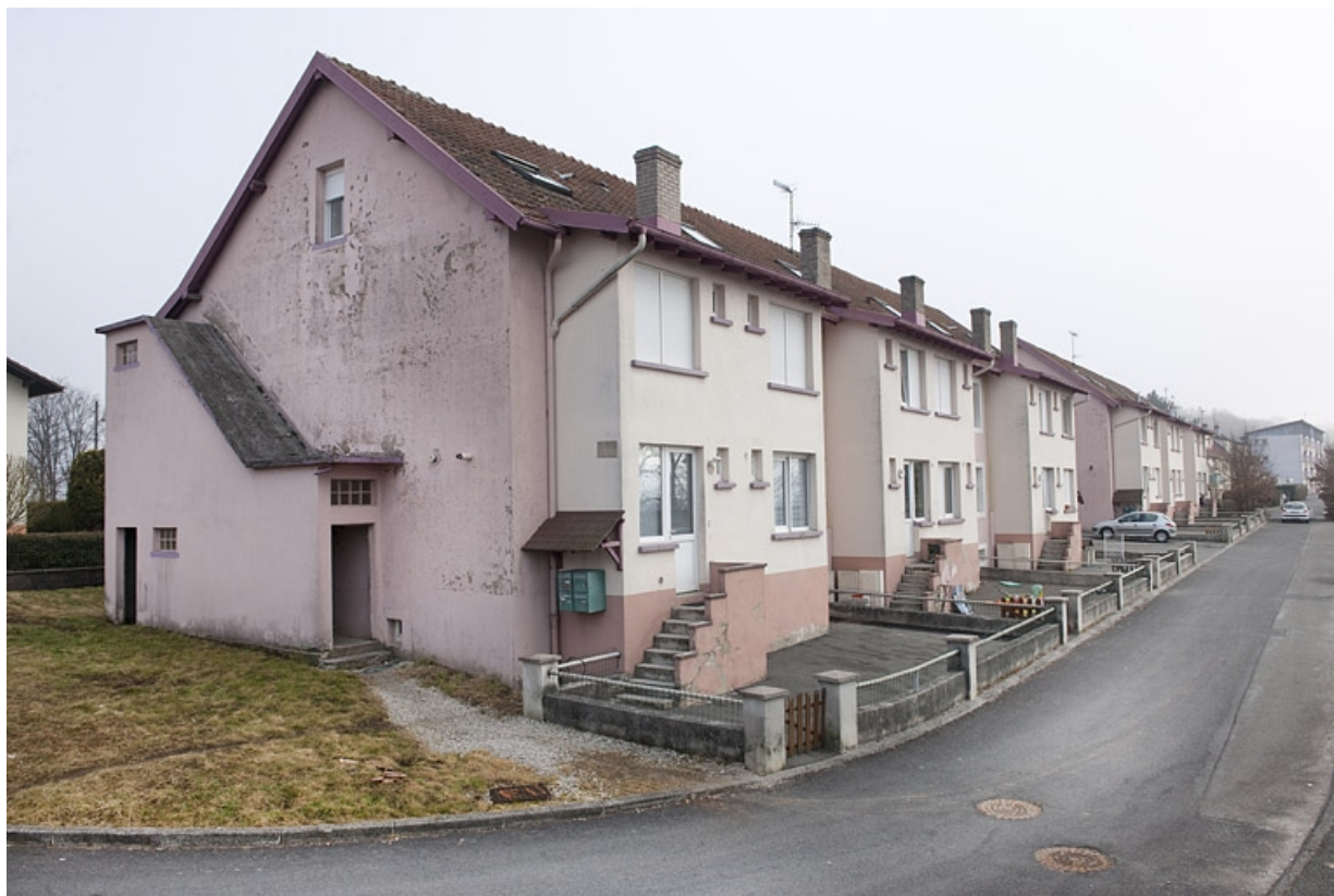
Immeubles d'habitation vus depuis l'ouest. 25, Fesches-le-Châtel route de Méziré