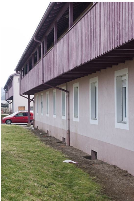
Façade postérieure d'un immeuble d'habitation. 25, Fesches-le-Châtel route de Méziré