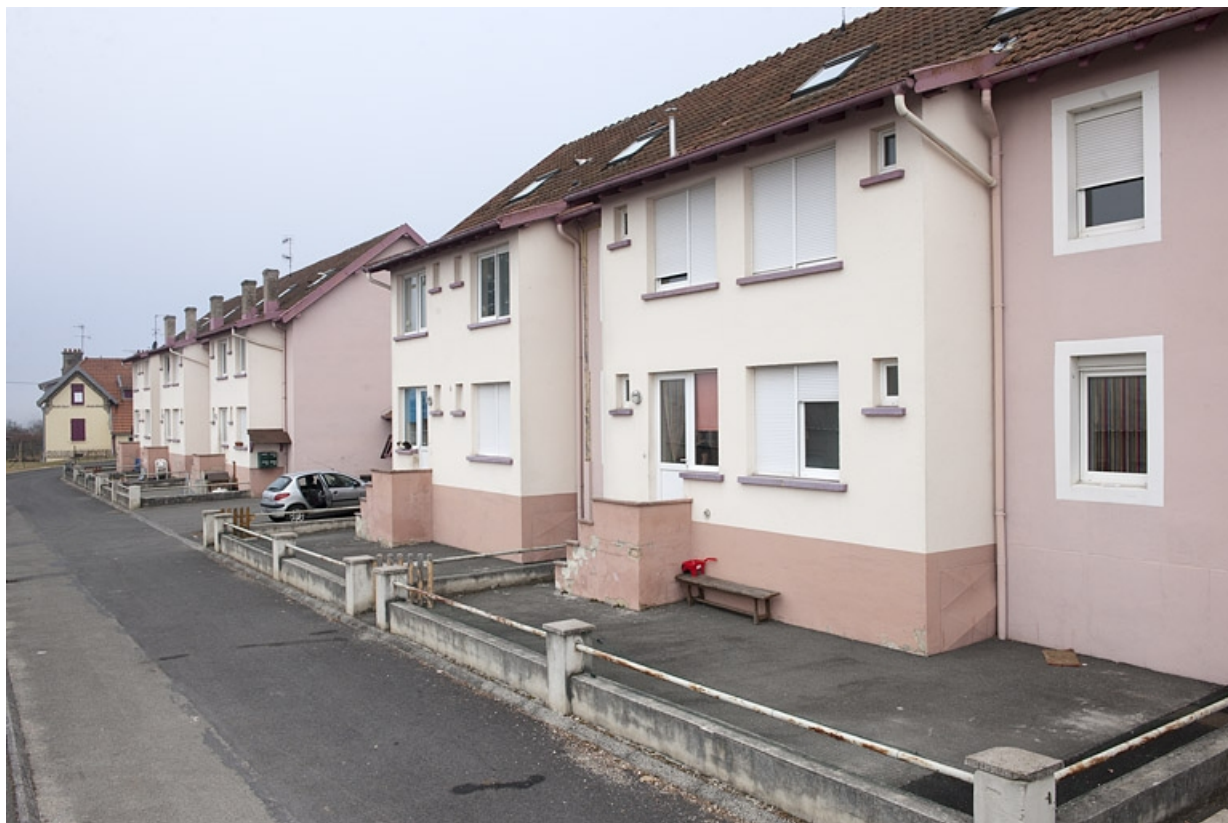
Immeubles d'habitation vus depuis l'est. 25, Fesches-le-Château route de Méziré