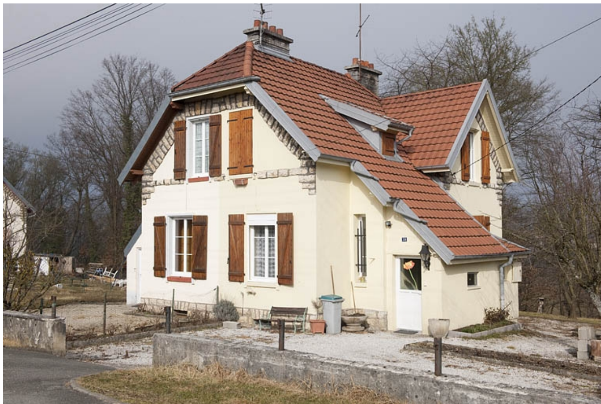
Maison jumelée route de Méziré. Vue de trois quarts.