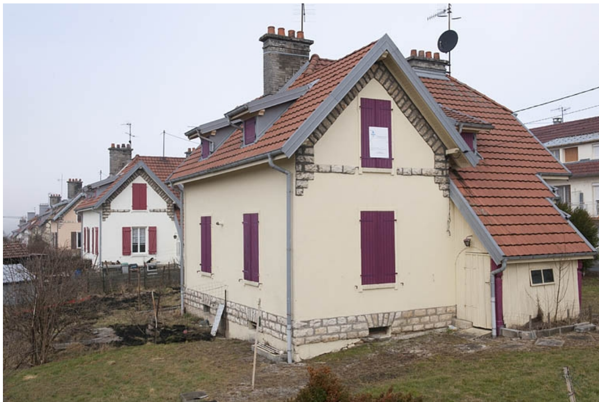
Façades sud des maisons jumelées impasse Bellevue.