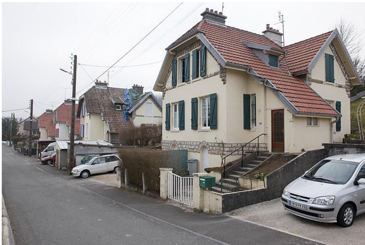
Vue d'ensemble depuis l'ouest. 25, Fesches-le-Châtel