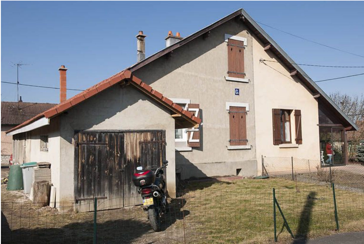
Façade ouest d'une maison jumelée.

25, Fesches-le-Châtel rue des Voironnes, lieudit : aux Voironnes du Bas