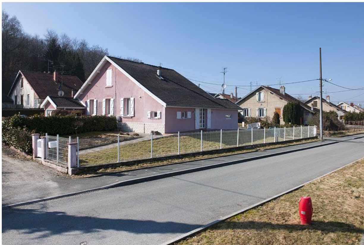
Vue d'ensemble depuis le nord-est. 25, Fesches-le-Châtel