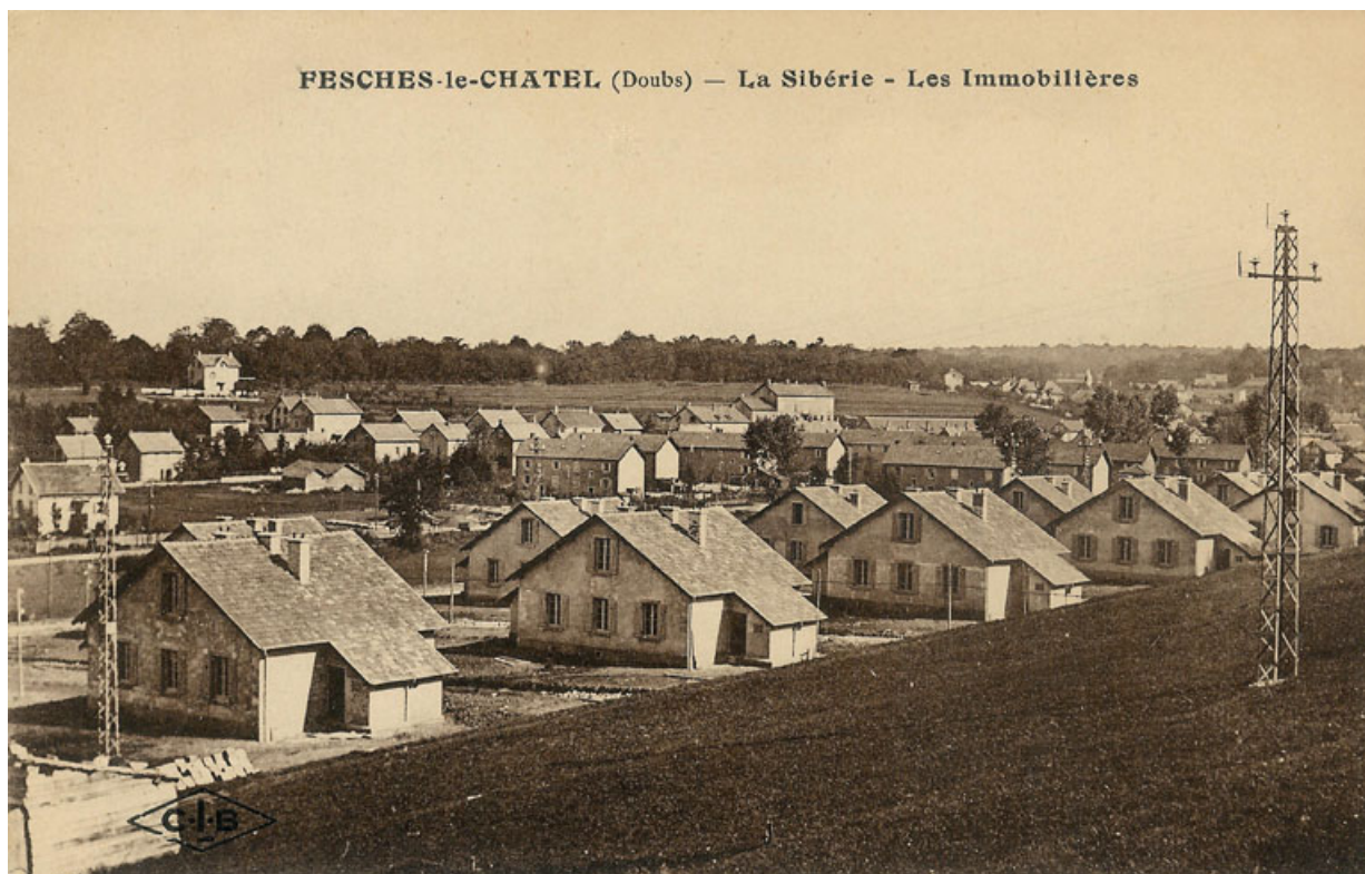
Fesches-le-Château (Doubs) - La Sibérie - Les Immobilières. Carte postale, CLB éd., s.d. [vers 1925]. 25, Fesches-le-Château rue des Voironnes, lieudit : aux Voironnes du Bas