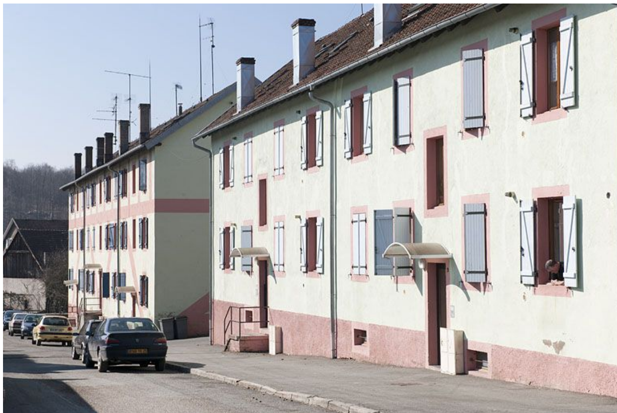
Immeubles de 10 et 18 logements vus depuis le nord-est.

25, Fesches-le-Châtel, 1 à 12 rue des Combes