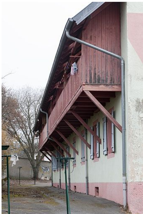
Façade postérieure de l'immeuble de 10 logements. 25, Fesches-le-Châtel, 1 à 12 rue des Combes