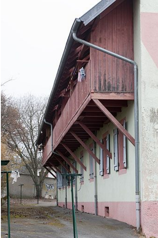
Façade postérieure de l'immeuble de 10 logements. 25, Fesches-le-Châtel, 1 à 12 rue des Combes