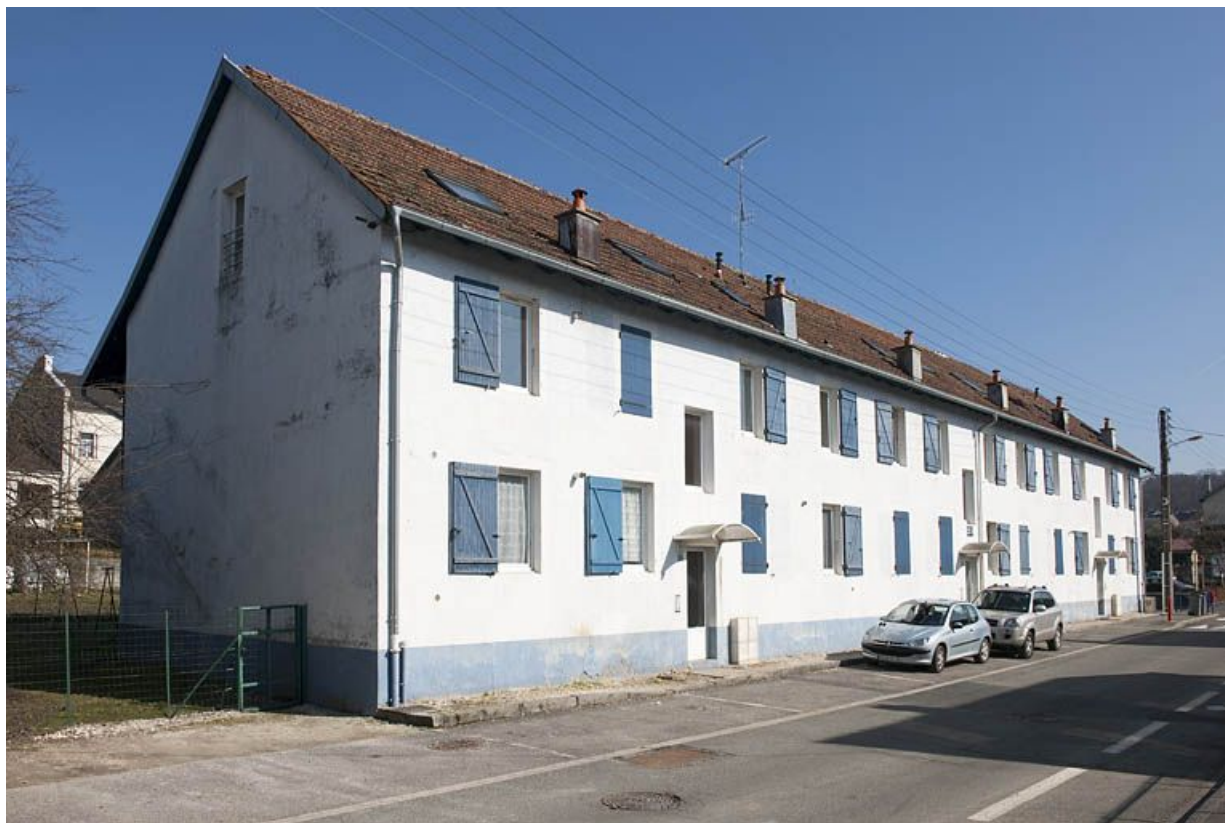
Immeuble de 12 logements vu depuis l'ouest. 25, Fesches-le-Châtel