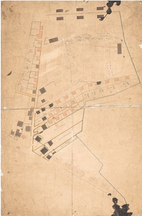
Plan des [...] ouvrières de Japy au Rondelot.

25, Fesches-le-Châtel, lieudit : les Boulets montants