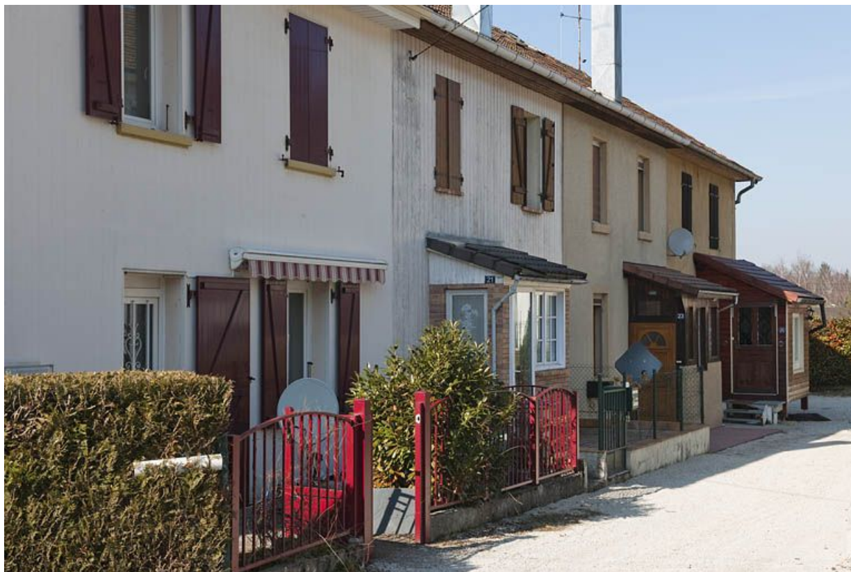
Habitation à 4 logements rue d'Alsace. Façade est. 25, Fesches-le-Châtel, lieudit : les Boulets montants