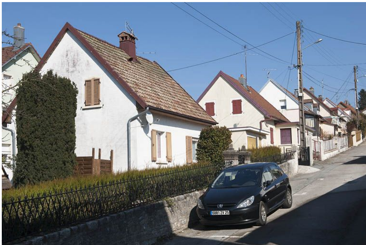
Rue de Belfort. Maisons côté impair. 25, Fesches-le-Châtel