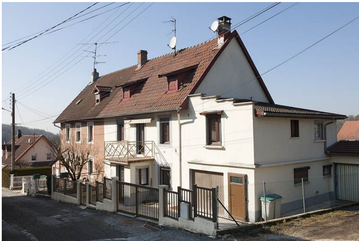
Rue d'Alsace. Maison à 2 logements (?) vue de trois quarts.

25, Fesches-le-Châtel, lieudit : les Boulets montants