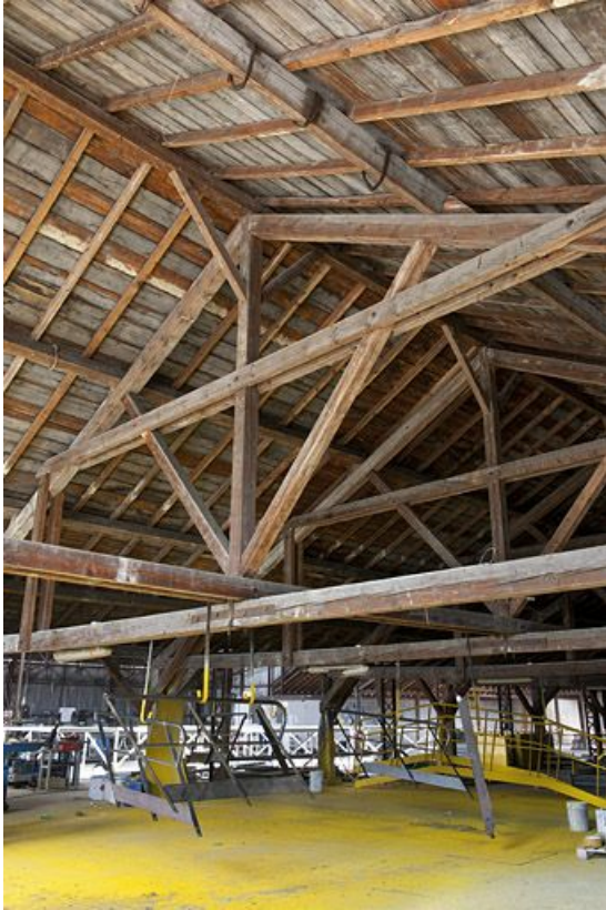
Entrepôt industriel. Charpente.