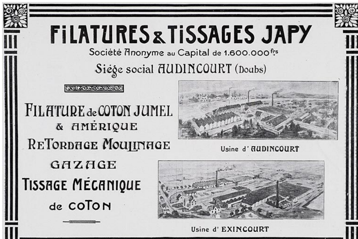
Filatures et tissages Japy [vue cavalière des usines d'Audincourt et d'Exincourt].