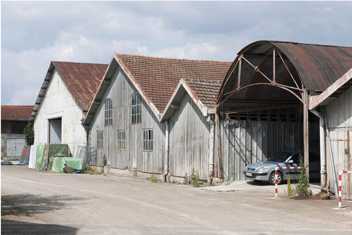
Pignons des magasins et entrepôts industriels.