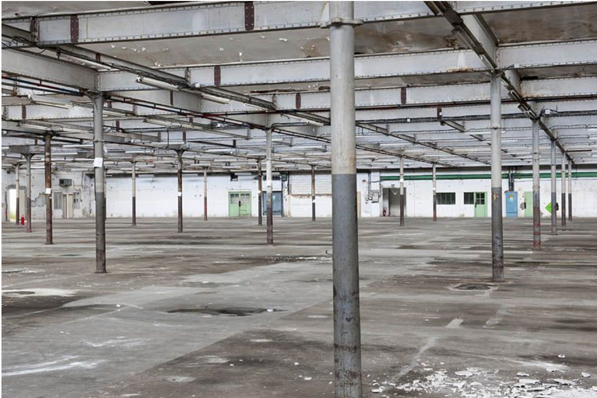
Salle de filature. Vue depuis le nord-ouest.