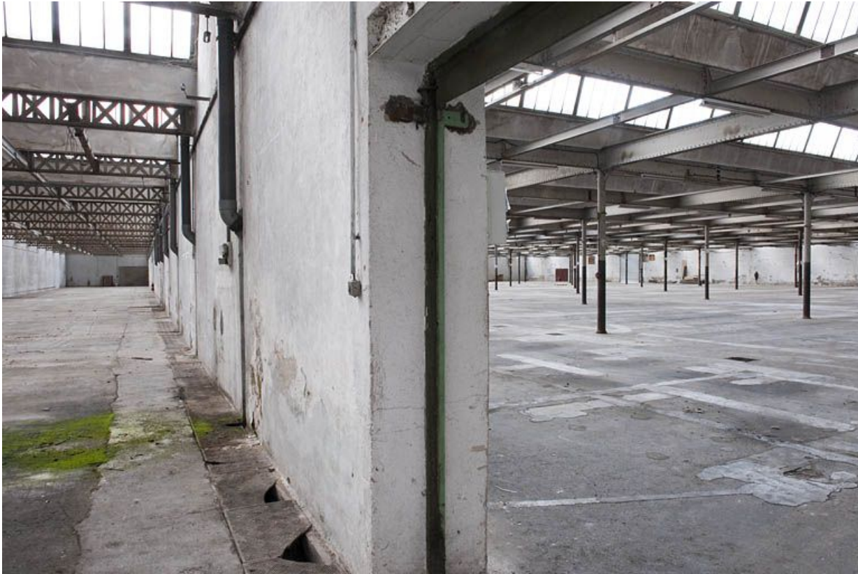
Salle de filature. Extension ouest (?).