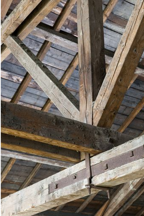
Entrepôt industriel. Charpente : jonction poinçon-entrait. 25, Exincourt, 58 rue des Mines