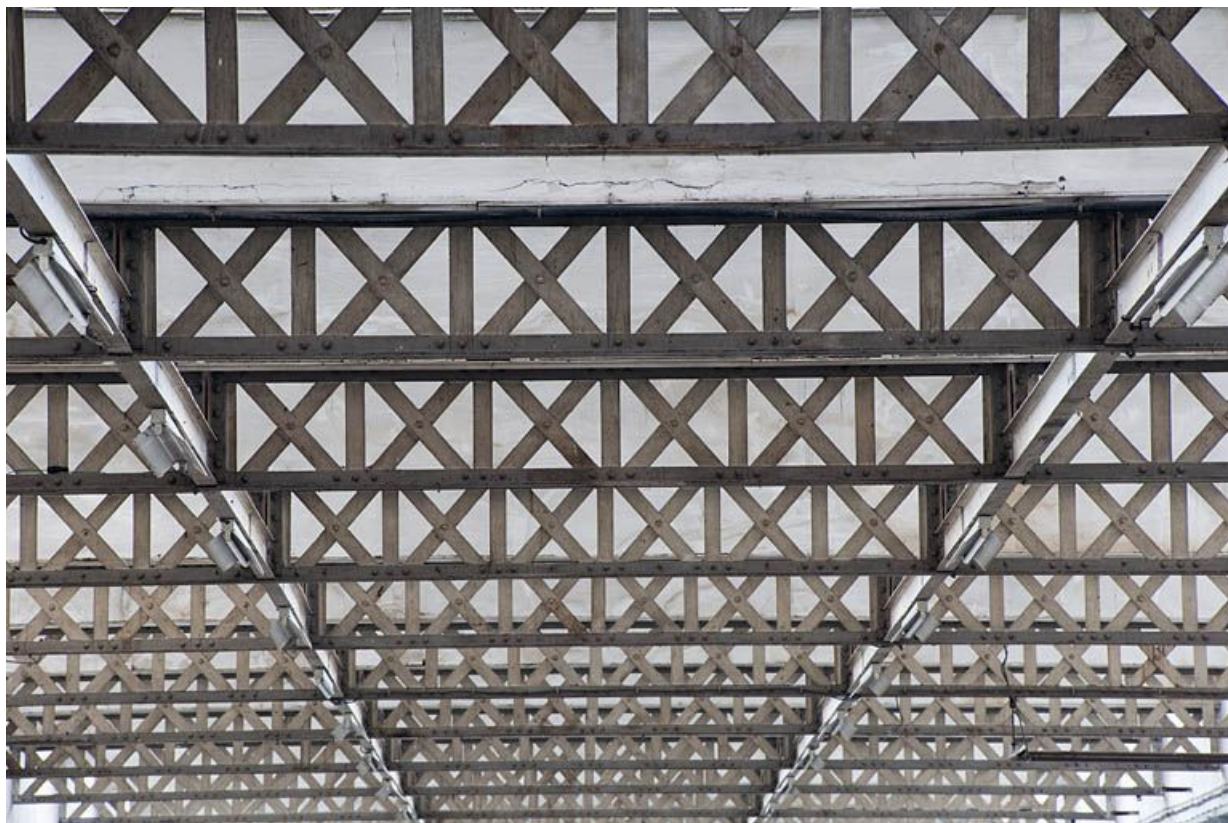
Extension ouest. Poutrelles à treillis de la charpente.