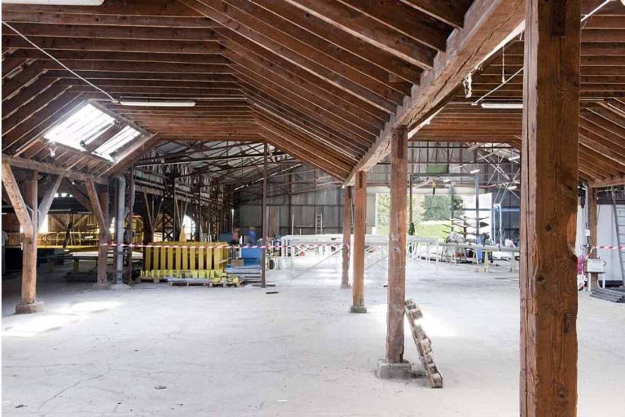
Vue intérieure d'un entrepôt industriel.