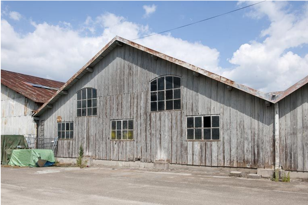
Pignon en bois d'un entrepôt industriel.