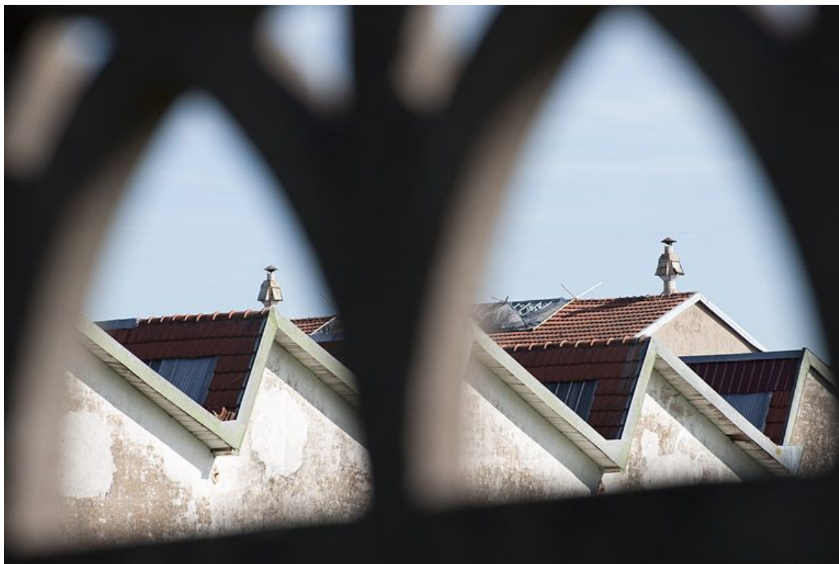
Sheds de l'atelier de filature vus à travers une clôture.