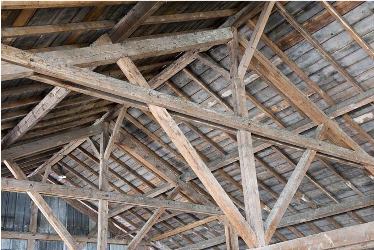
Entrepôt industriel. Détail de la charpente.