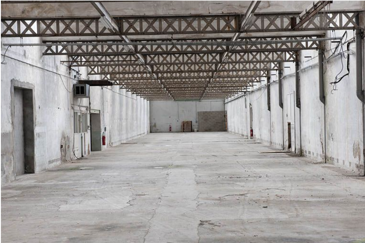
Extension ouest. Vue depuis le sud.