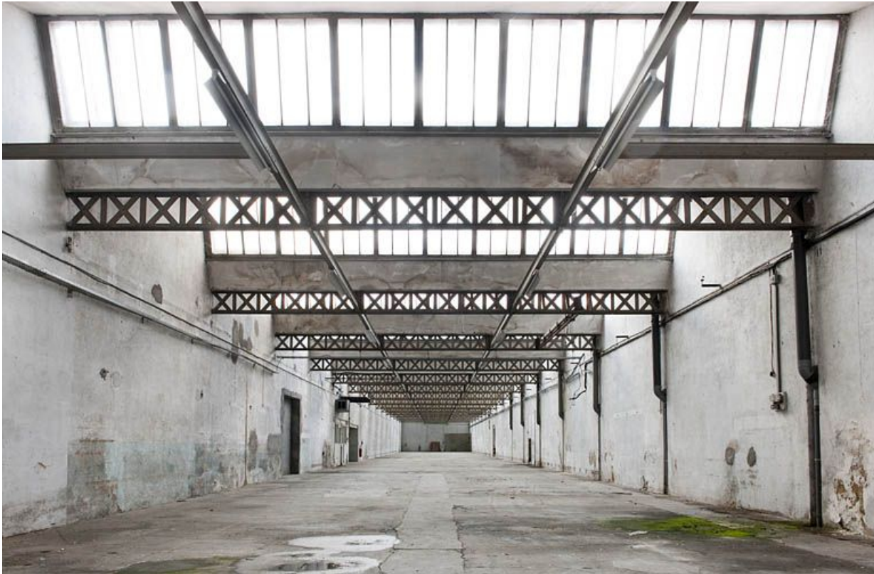
Extension ouest. Vue perspective.