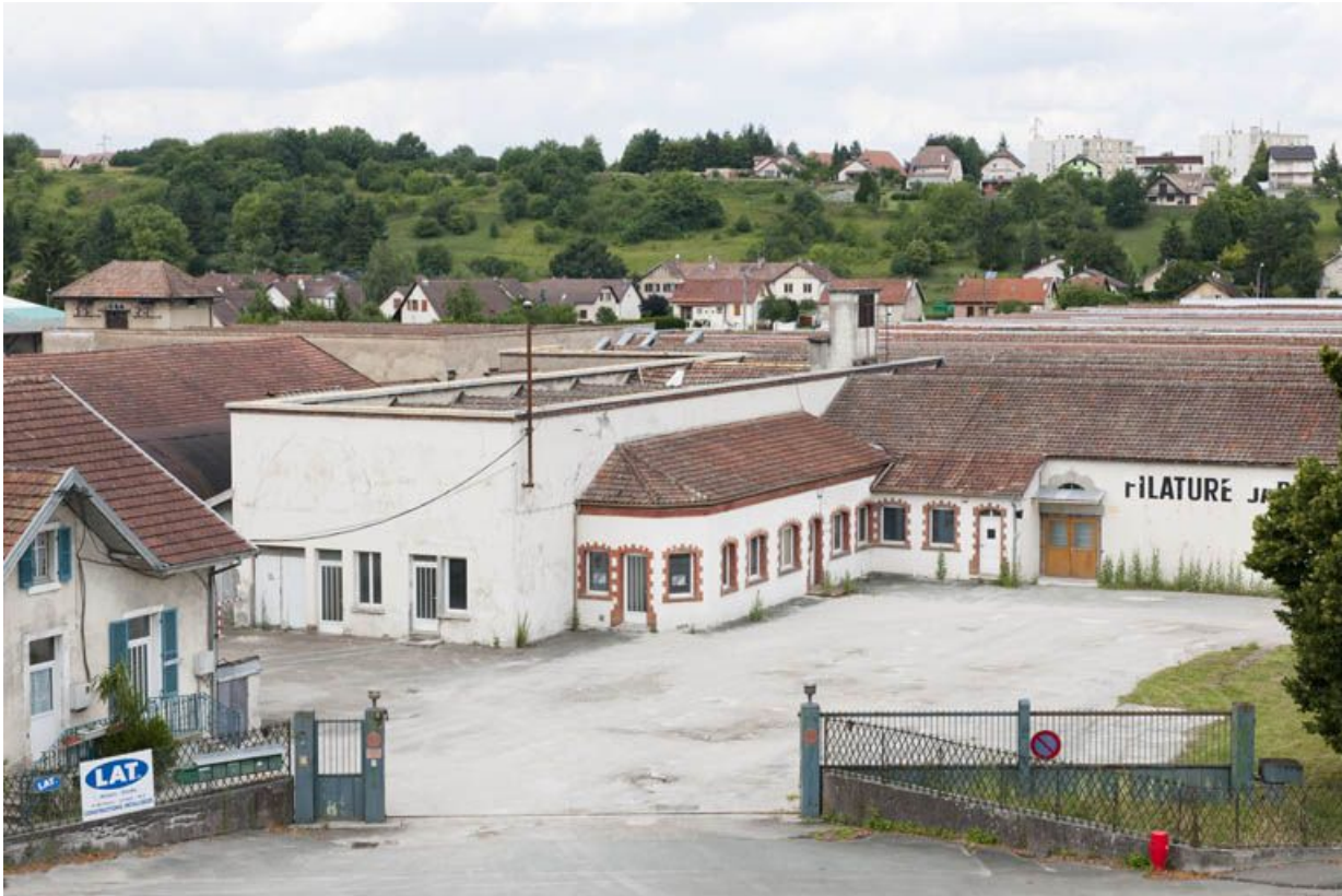
Vue d'ensemble plongeante depuis le sud. 25, Exincourt, 58 rue des Mines