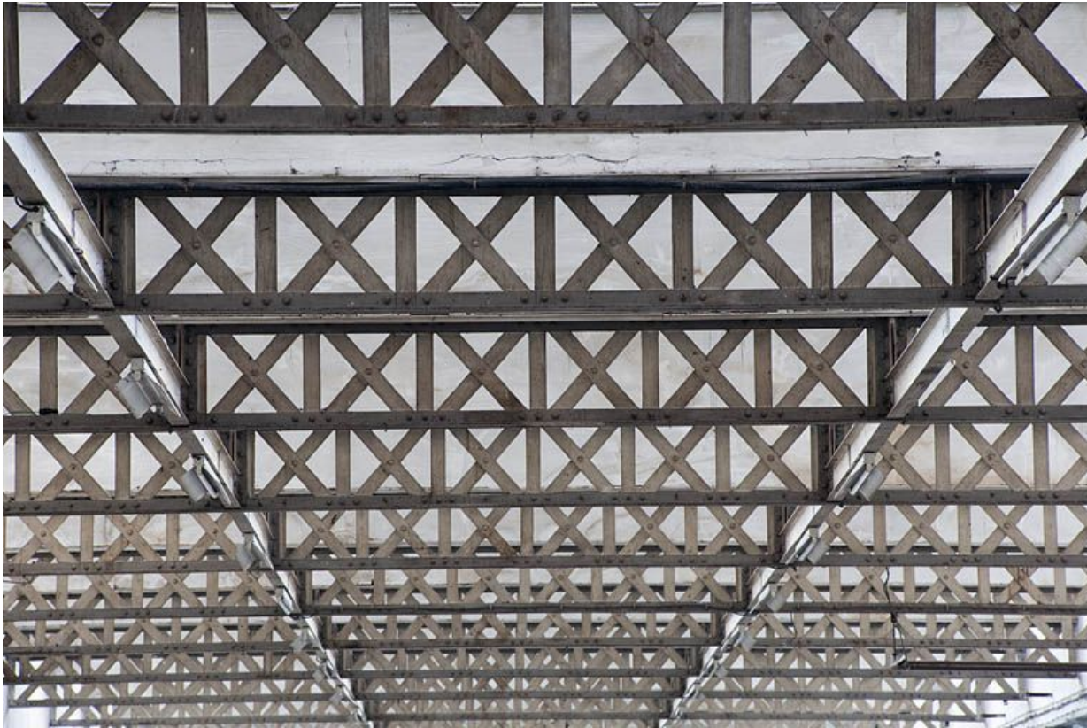
Extension ouest. Poutrelles à treillis de la charpente.