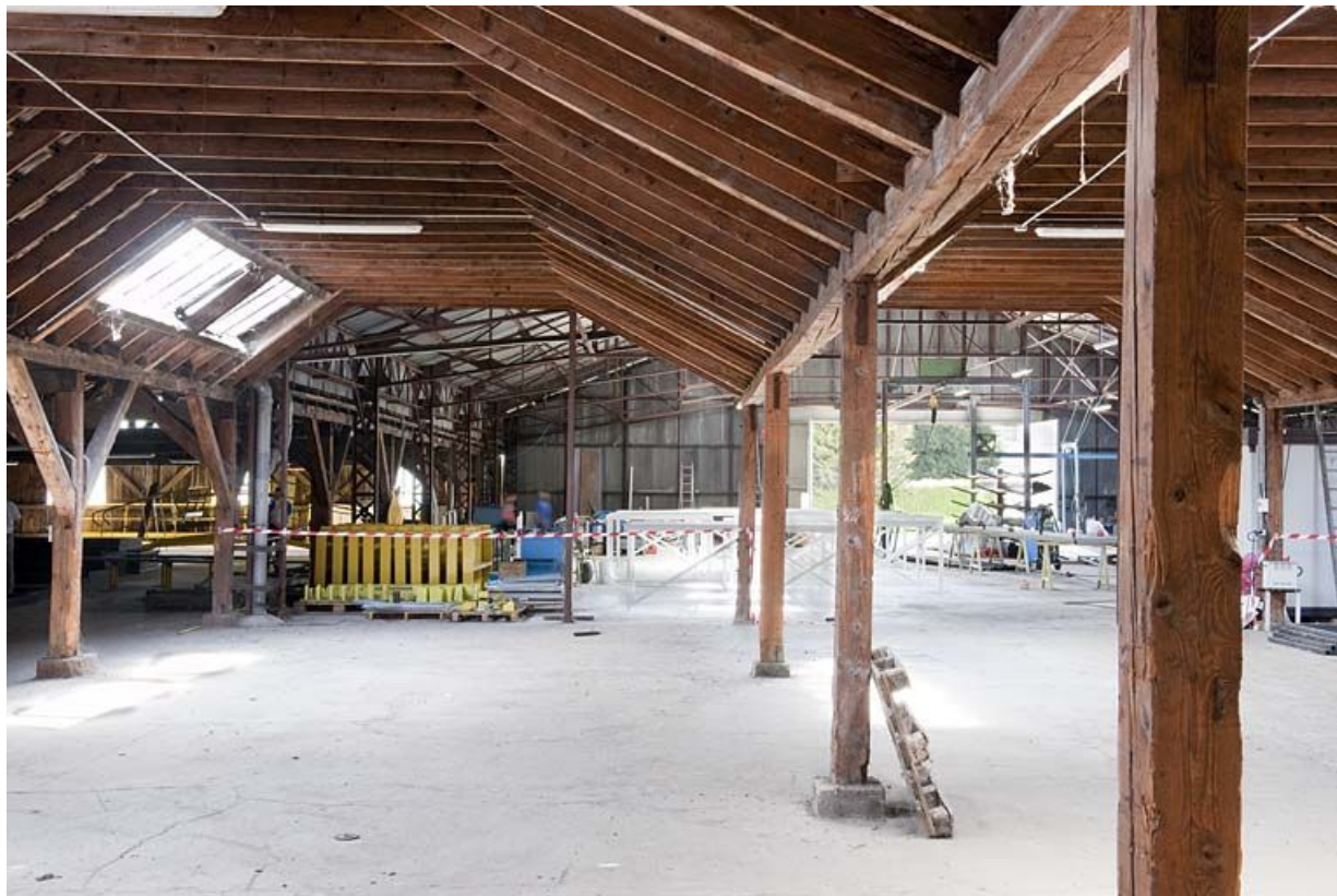
Vue intérieure d'un entrepôt industriel.