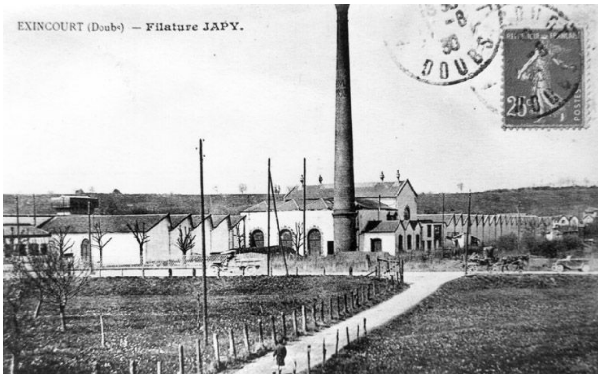
Exincourt (Doubs). Filature Japy.