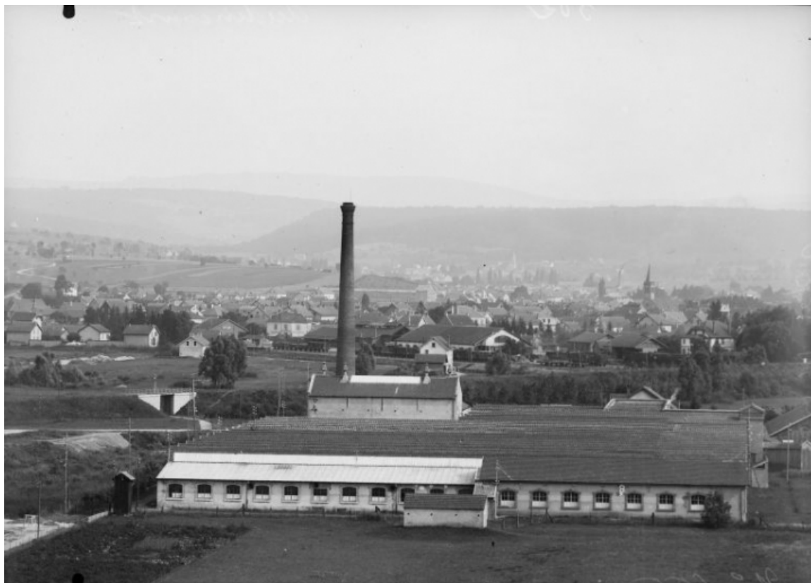
[Vue d'ensemble depuis le nord].