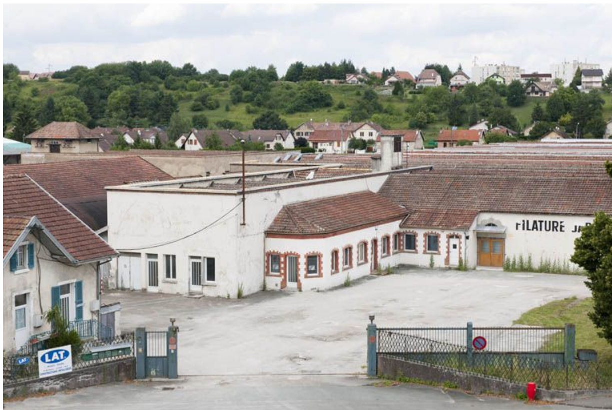
Vue d'ensemble plongeante depuis le sud. 25, Exincourt, 58 rue des Mines