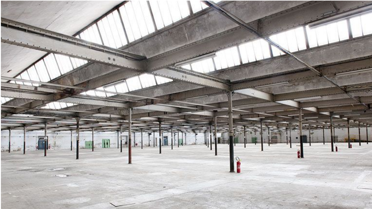
Salle de filature. Vue depuis le sud-est.