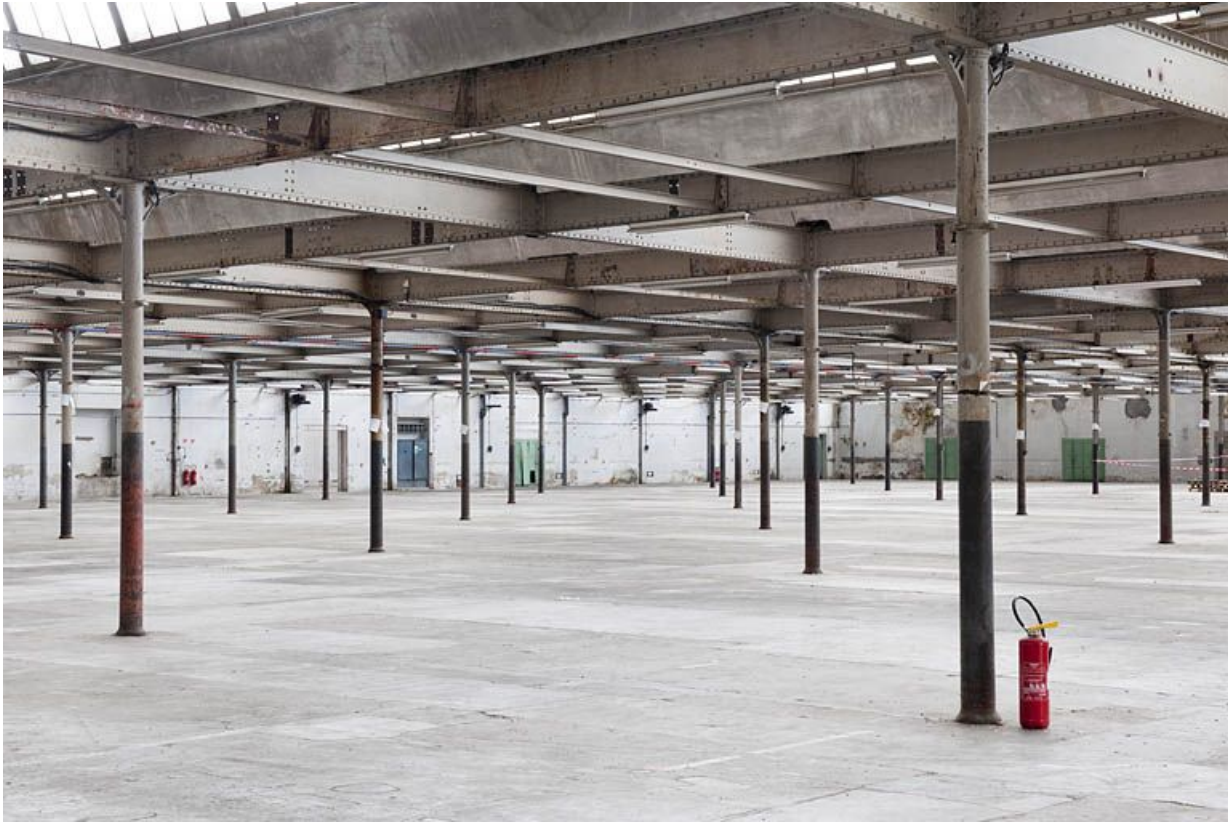
Salle de filature. Vue d'ensemble.