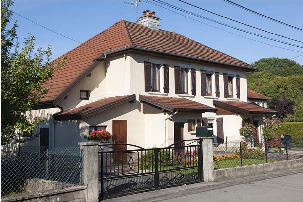
Maison vue de trois quarts gauche.