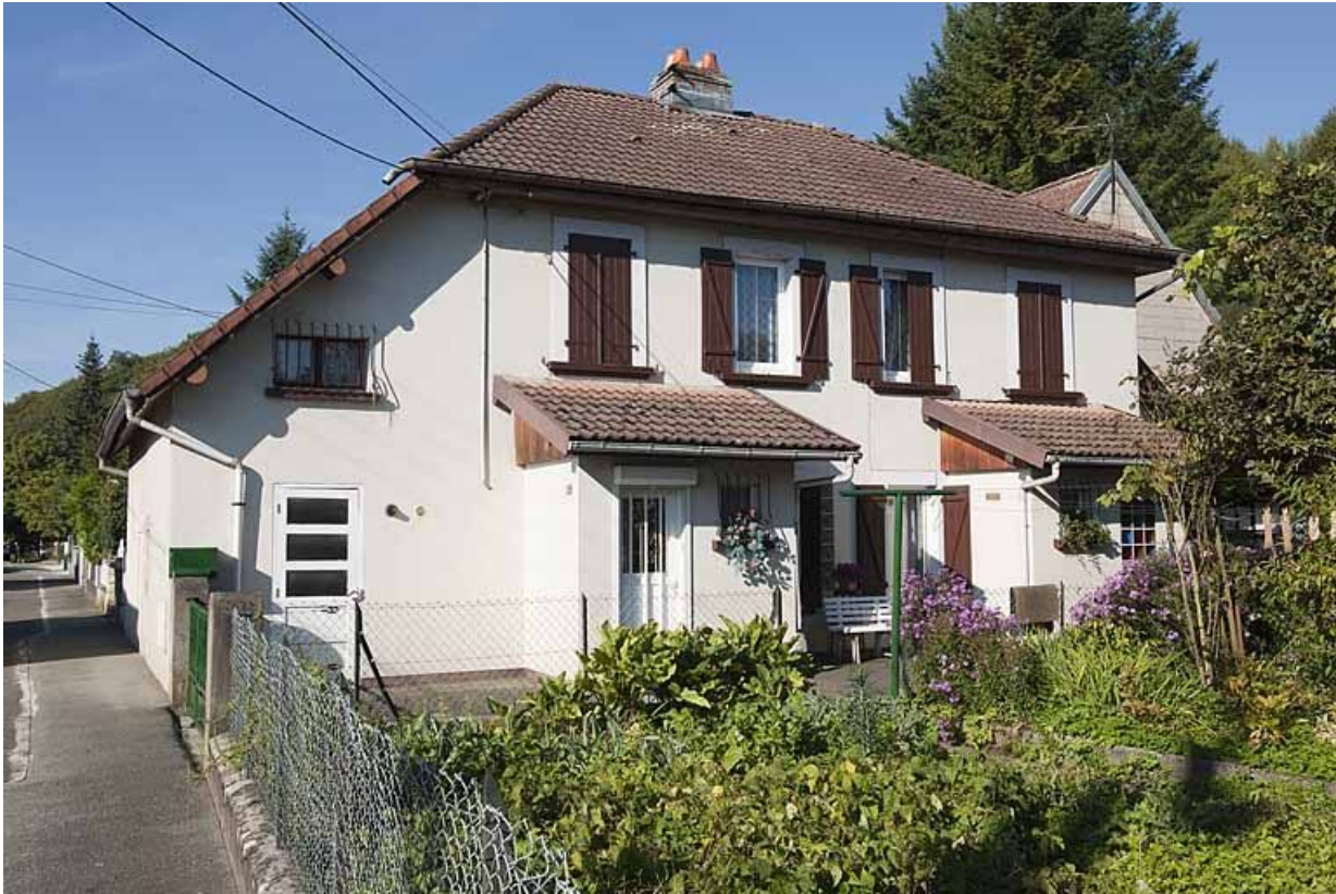
Façade est d'une maison.