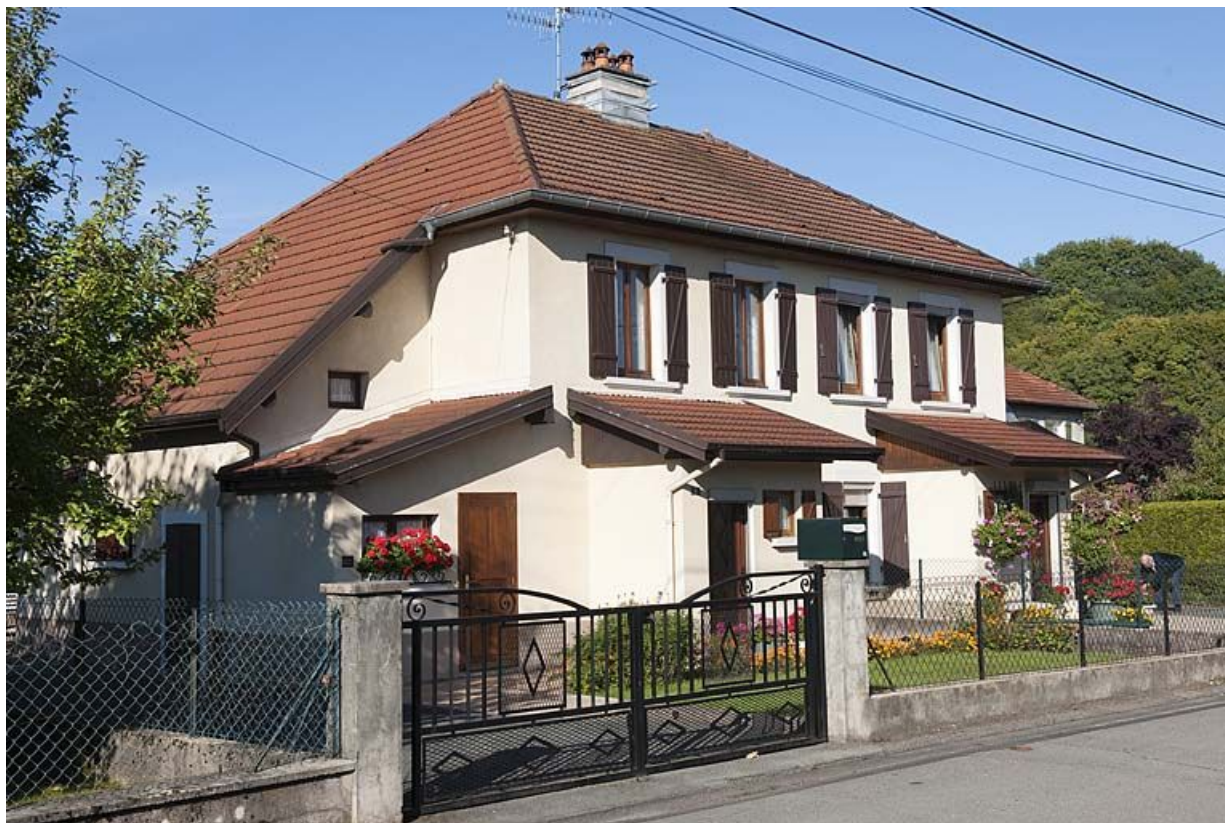
Maison vue de trois quarts gauche. 25, Exincourt rue du général Weygand