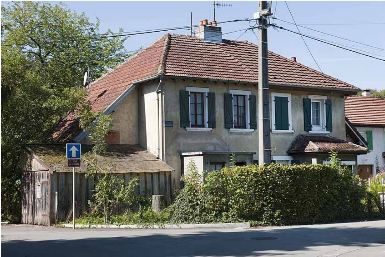
Maison vue de trois quarts droite.