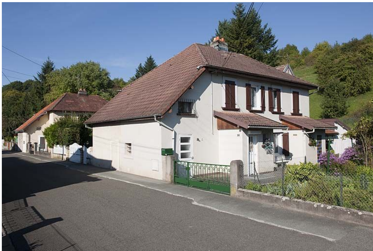
Maisons rue des Gravier. Vue de trois quarts 25, Exincourt rue du général Weygand