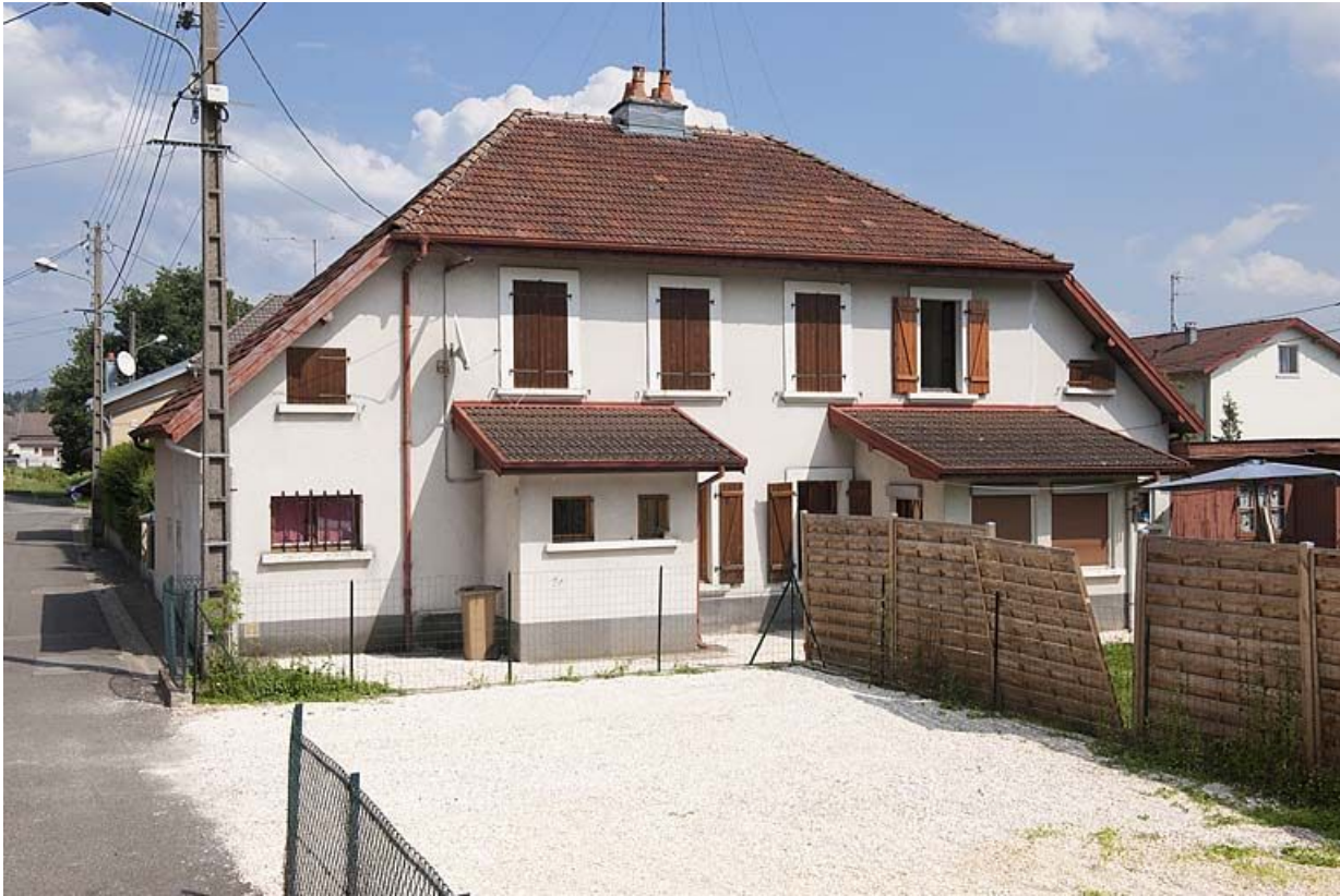
Façade ouest d'une maison.