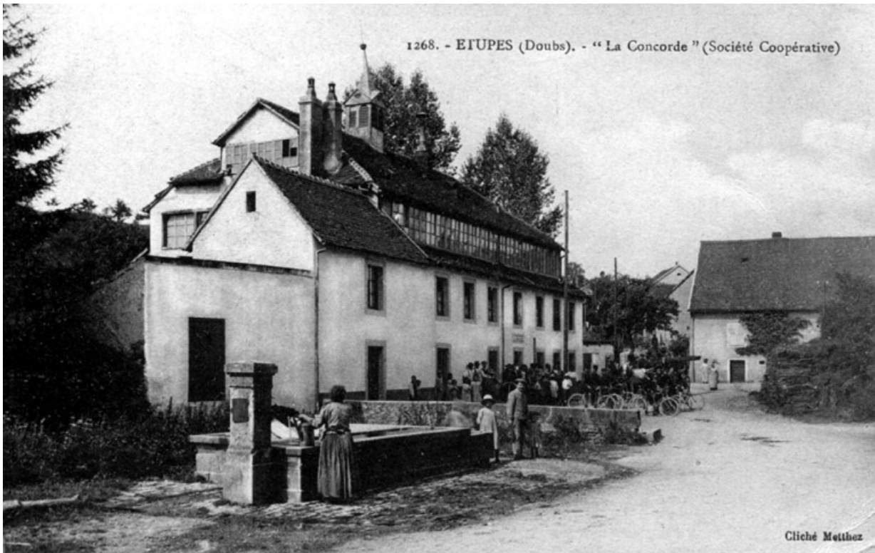
Étupes (Doubs). La " Concorde " (société coopérative). 25, Étupes place du Marché