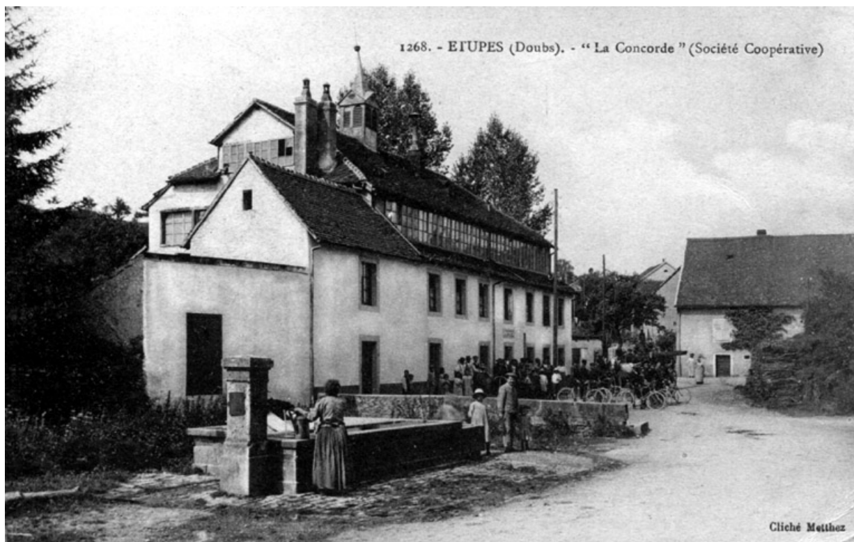
Étupes (Doubs). La " Concorde " (société coopérative). 25, Étupes place du Marché