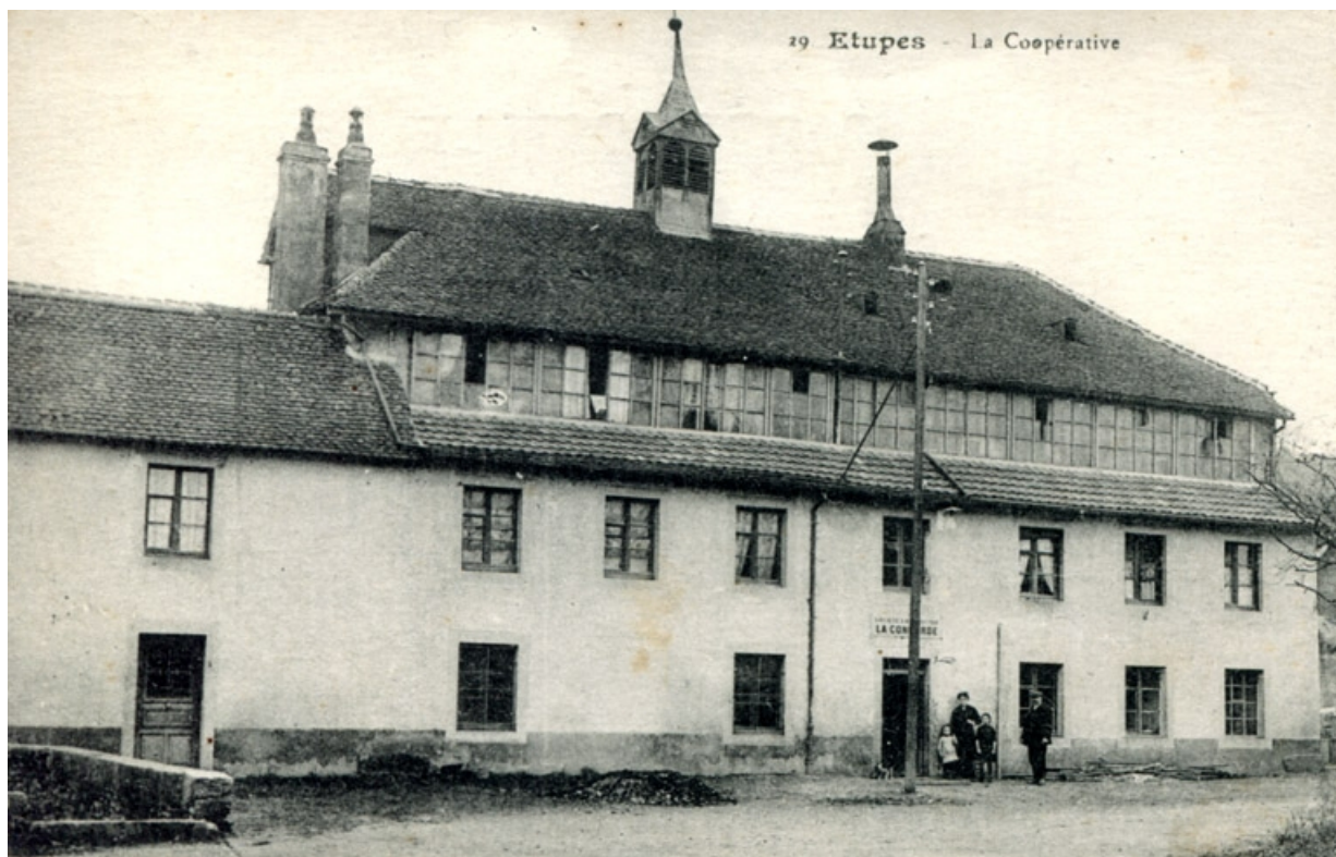
Étupes. La Coopérative.