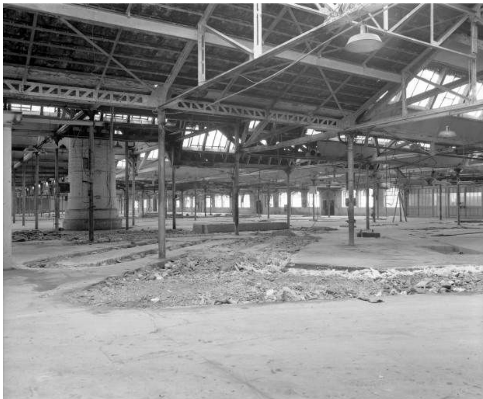
Intérieur de l'atelier d'émaillerie en 1981. Cheminée du four A. 25, Dampierre-les-Bois rue des Eaux, lieudit : le Gros Pré