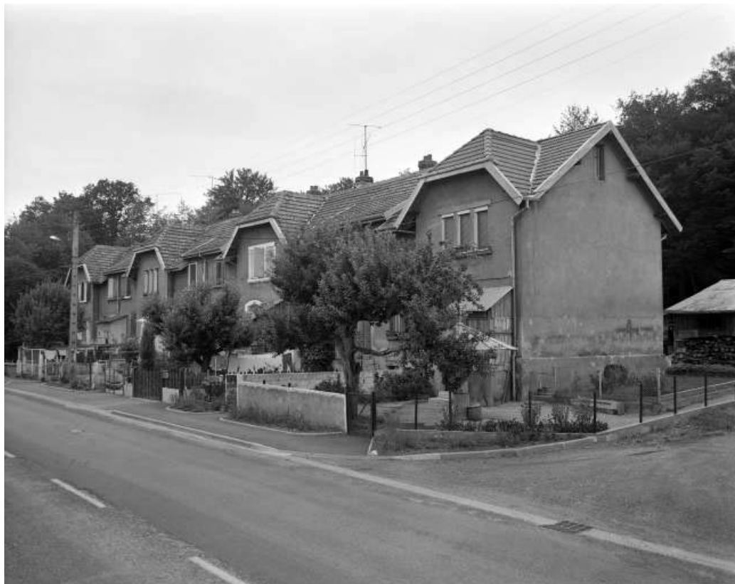
Logement ouvrier P en 1986, vu de trois quarts.

25, Dampierre-les-Bois rue des Emaux, lieudit : le Gros Pré