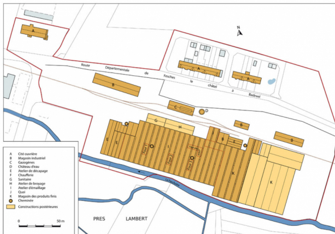
Plan-masse de l'usine en 1967. D'après un extrait du plan cadastral.

25, Dampierre-les-Bois rue des Eaux, lieudit : le Gros Pré