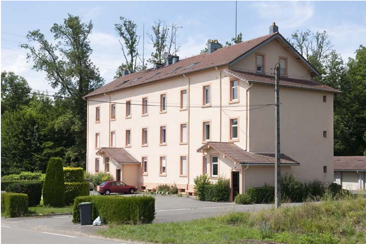
Immeuble dit pension italienne. Vue de trois quarts.

25, Dampierre-les-Bois rue des Eaux, lieudit : le Gros Pré