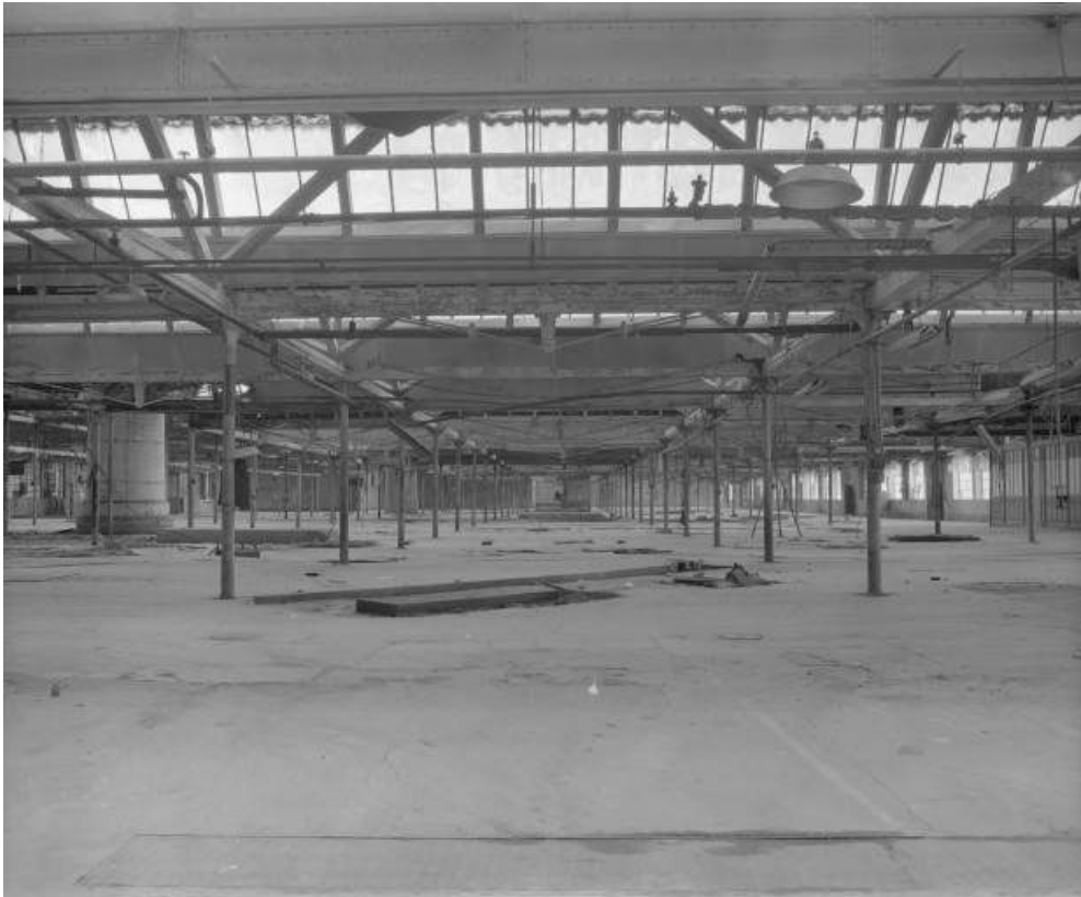
Intérieur de l'atelier d'émaillerie en 1981.

25, Dampierre-les-Bois rue des Emaux, lieudit : le Gros Pré