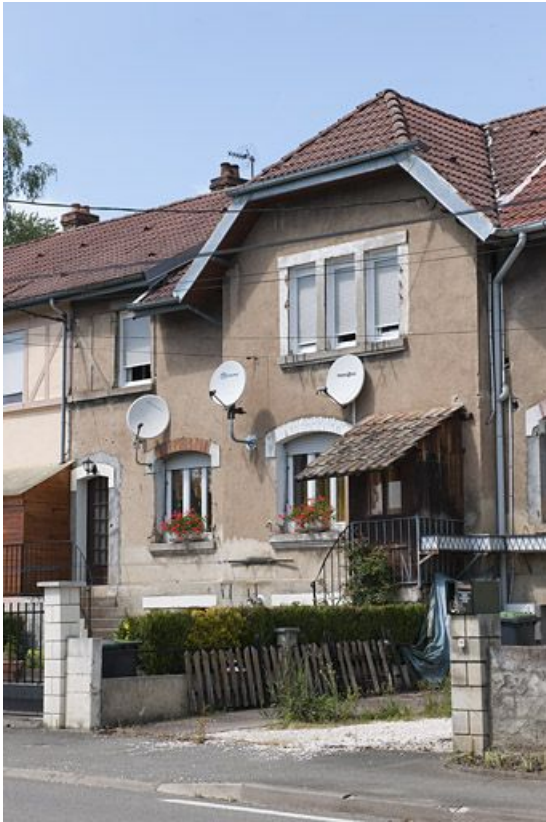
Logement ouvrier P. Détail de la façade.

25, Dampierre-les-Bois rue des Eaux, lieudit : le Gros Pré