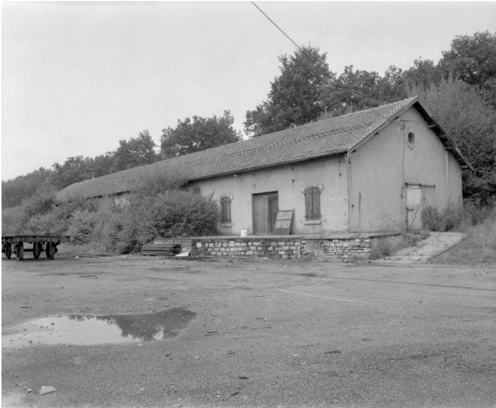
Magasin de second choix en 1981.

25, Dampierre-les-Bois rue des Emaux, lieudit : le Gros Pré