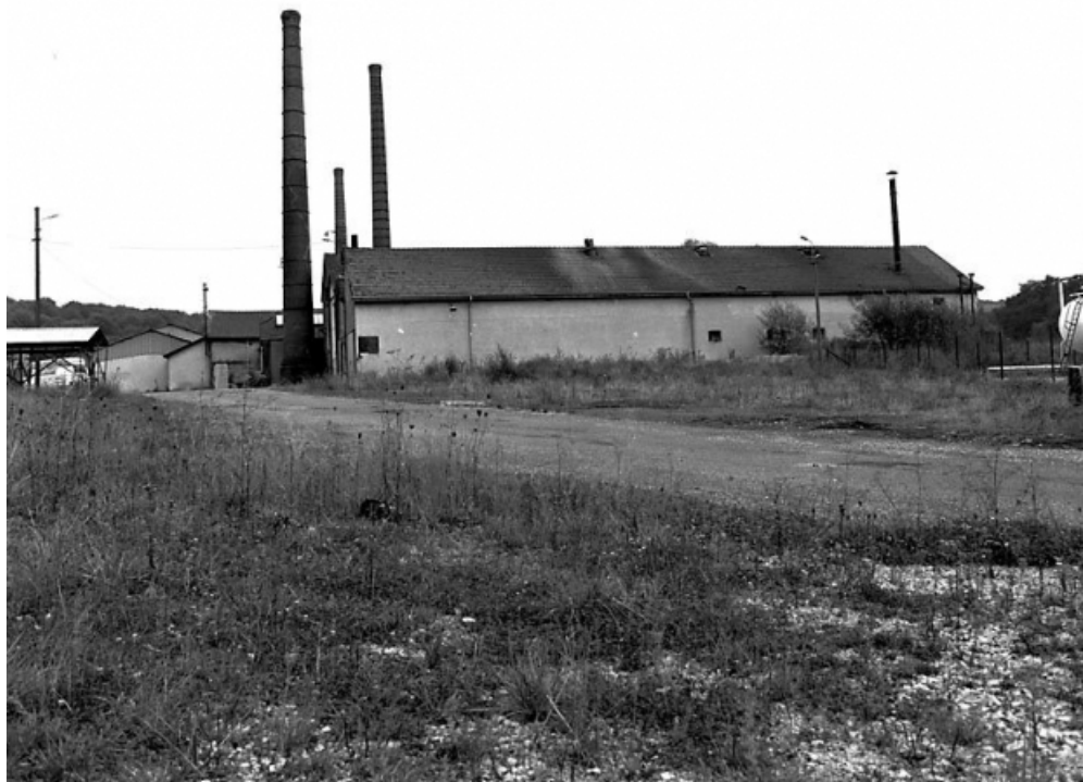
Vue de l'atelier d'émaillerie depuis l'ouest en 1981.

25, Dampierre-les-Bois rue des Emaux, lieudit : le Gros Pré