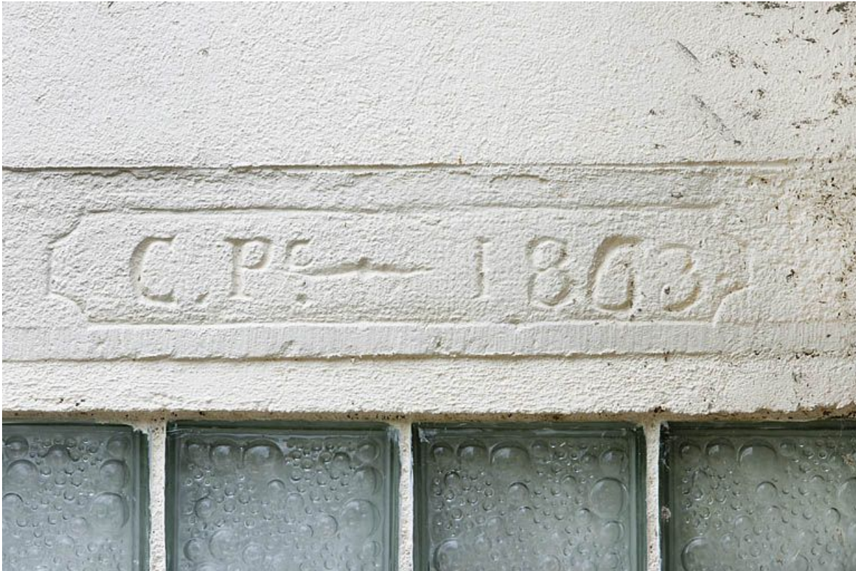
Linteau de porte d'une maison individuelle (rue du Mavuron).