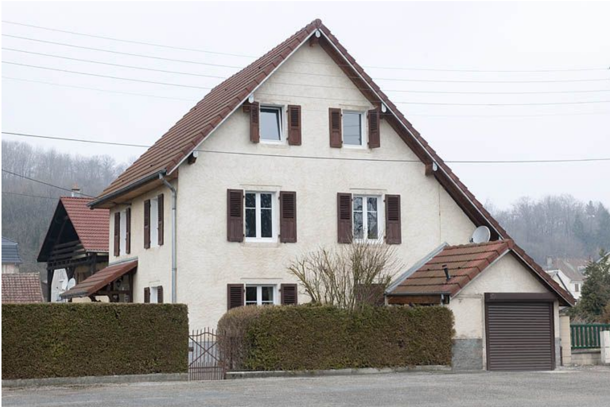
Pignon d'une maison individuelle donnant sur la place publique.