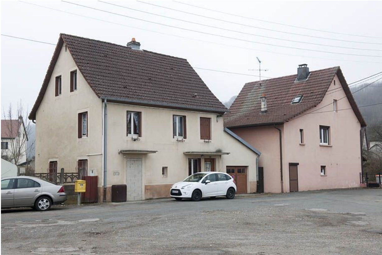
Maisons individuelles rue de la Poste.