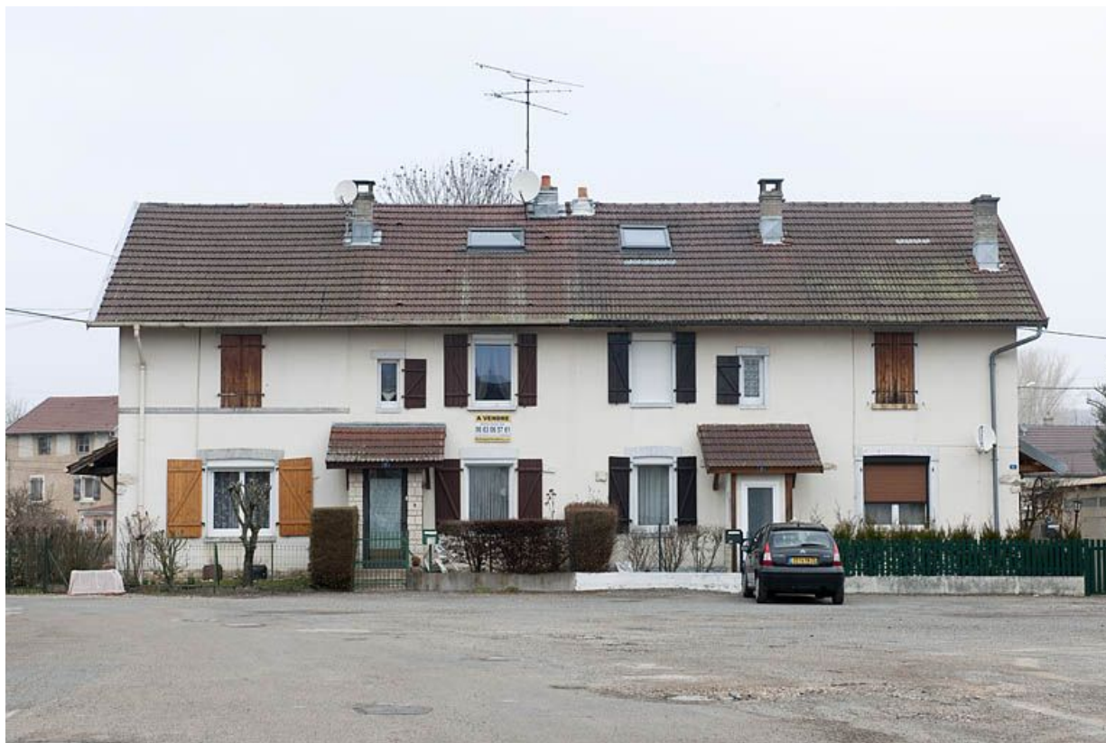
Immeuble à 4 logements. Façade sud.