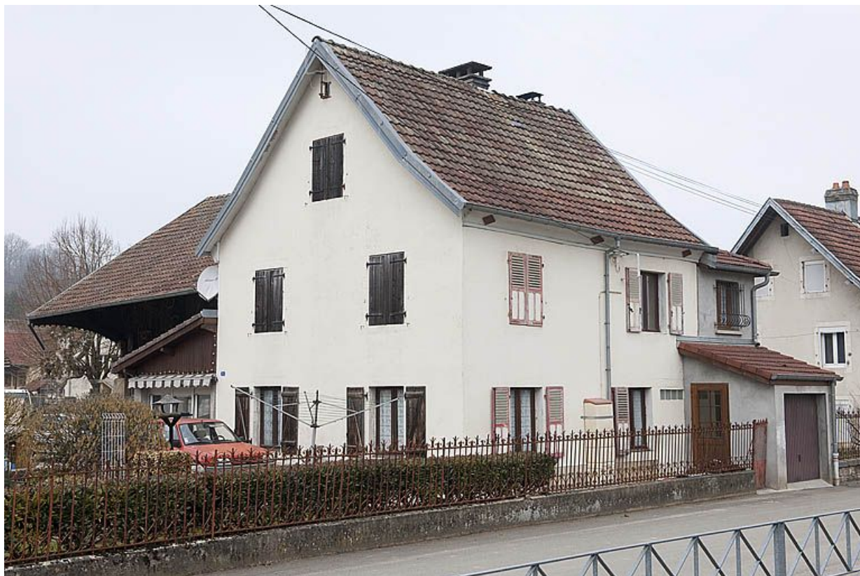
Maison individuelle rue du Mavuron.