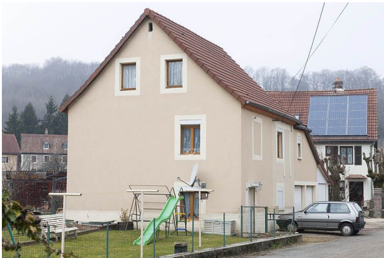
Maison individuelle (modifiée) vue de trois quarts.