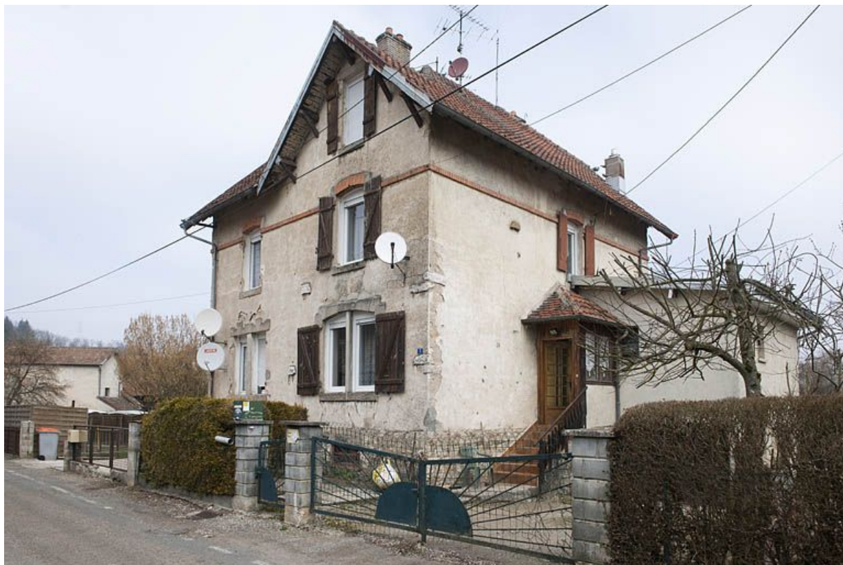
Maison à deux logements (de cadre ?).