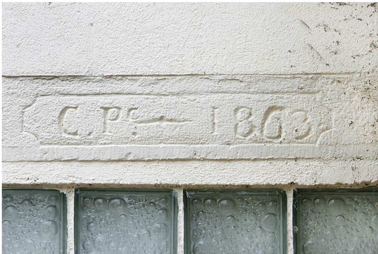
Linteau de porte d'une maison individuelle (rue du Mavuron).