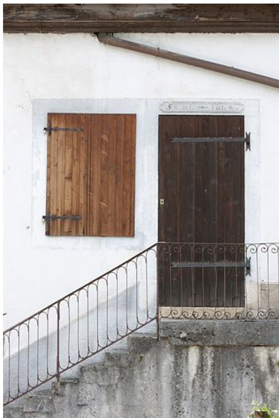
Détail de la façade est d'une maison (10 rue du Mavuron). 25, Badevel rue de la Poste