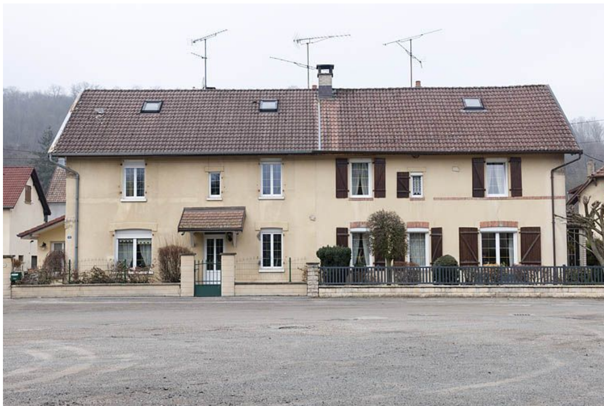
Immeuble à 4 logements. Façade est.