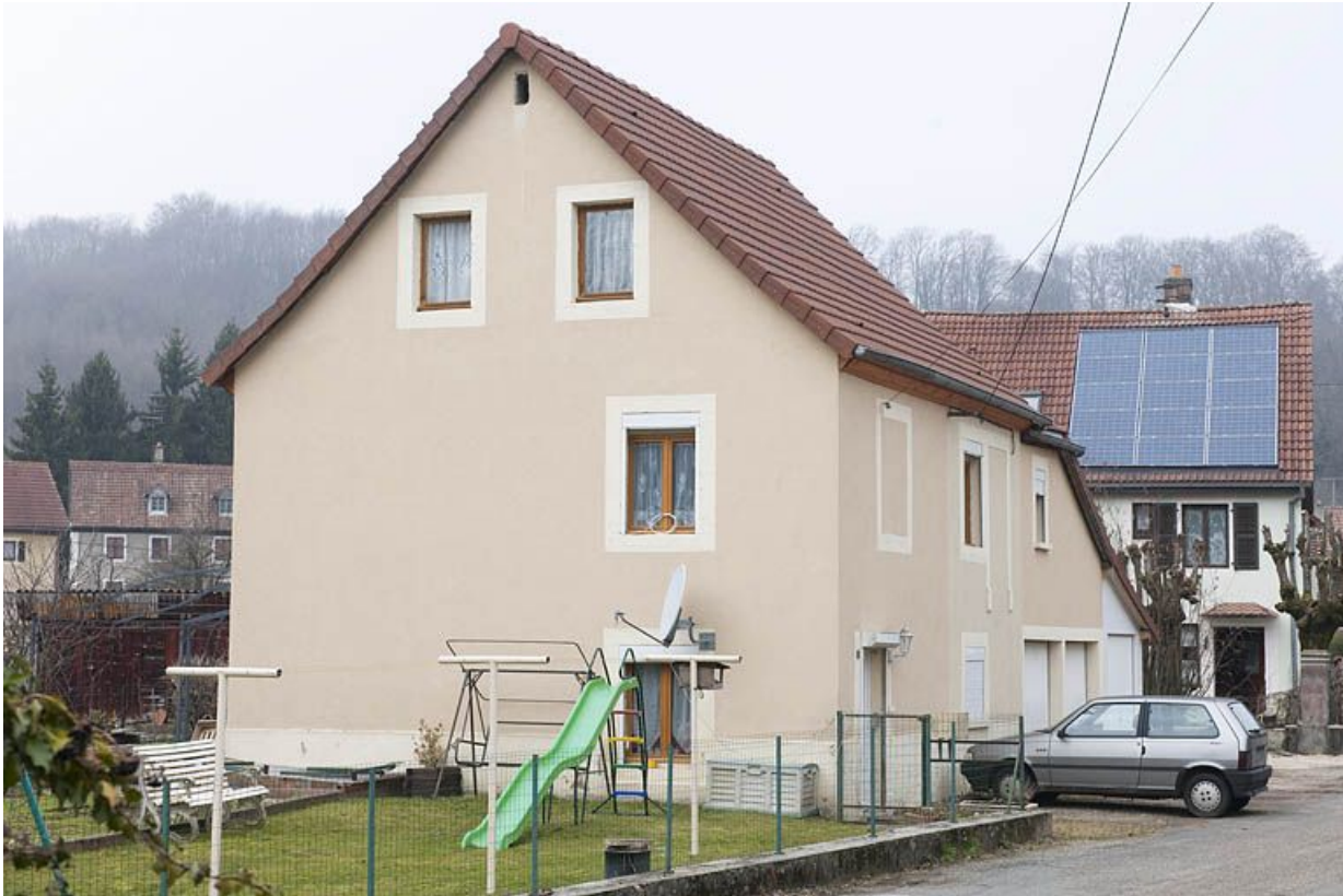
Maison individuelle (modifiée) vue de trois quarts.