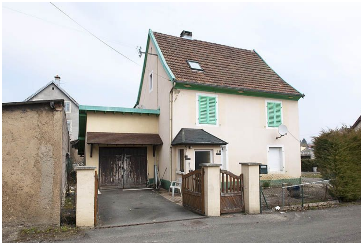
Maison individuelle rue de la Poste.