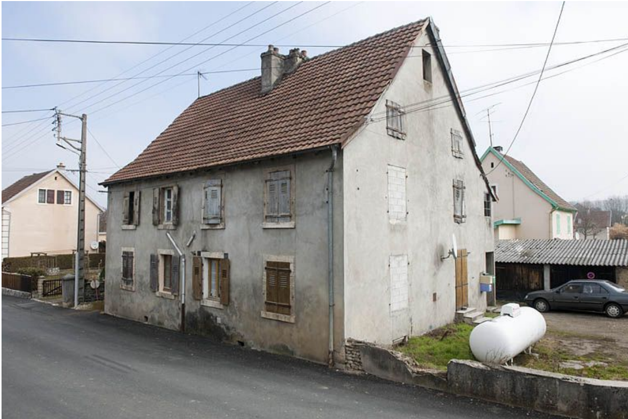
Immeuble à 4 logements dit "la Bastille".