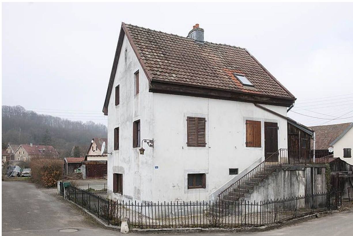
Maison individuelle 10 rue du Mavuron.