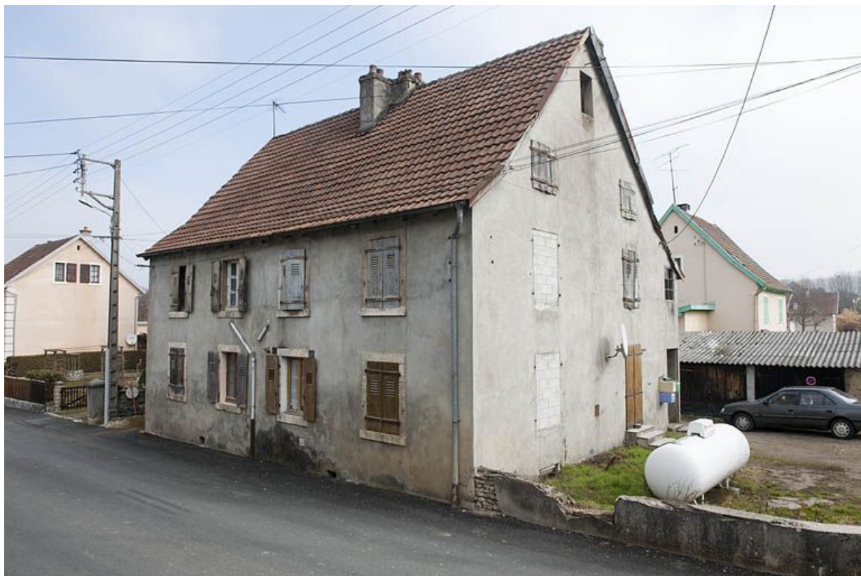
Immeuble à 4 logements dit "la Bastille".