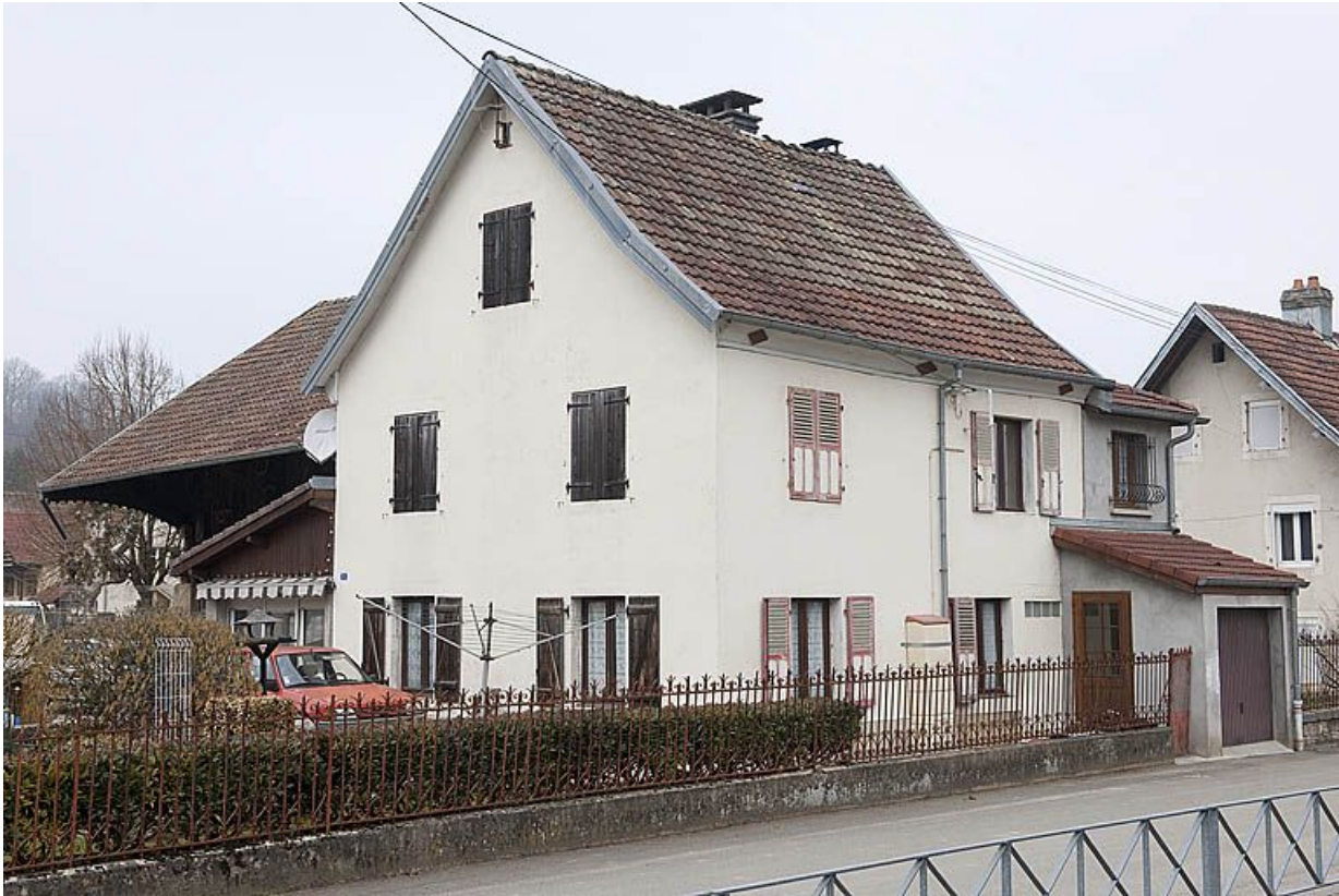
Maison individuelle rue du Mavuron.