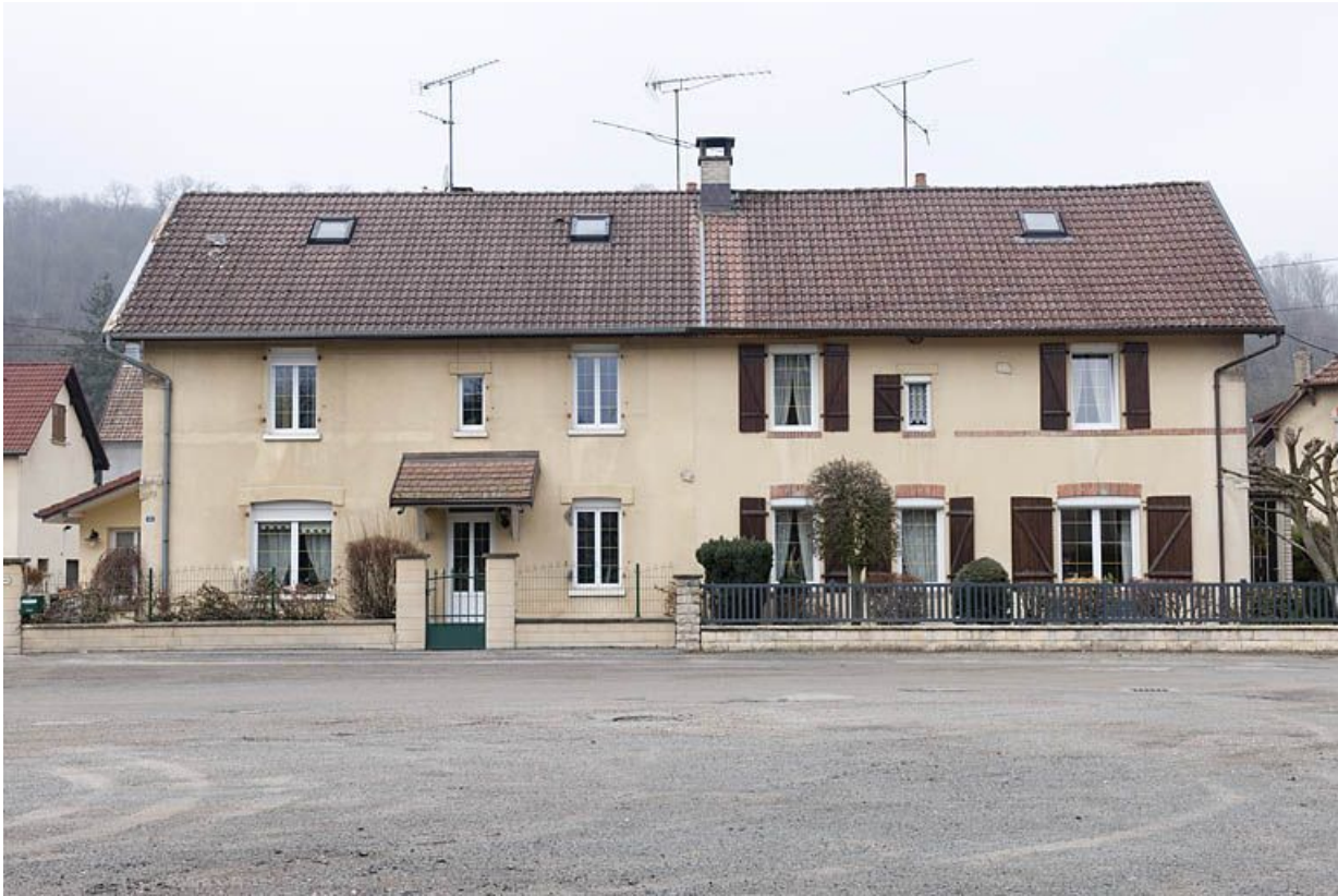
Immeuble à 4 logements. Façade est.