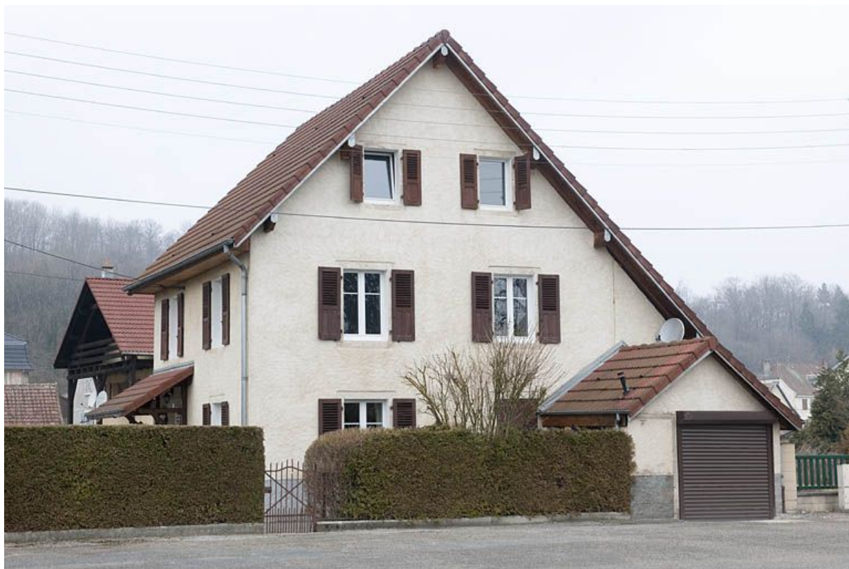
Pignon d'une maison individuelle donnant sur la place publique.