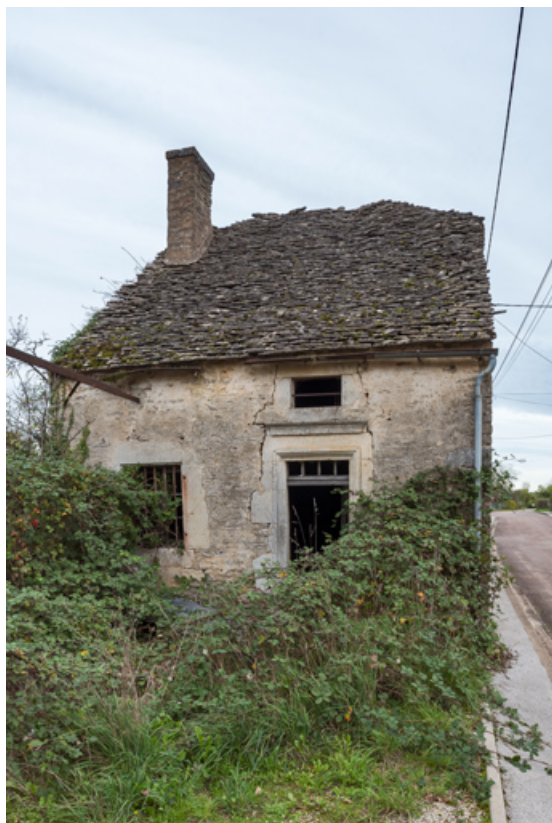
Vue de la façade ouest.

21, Saint-Broing-les-Moines, 17 rue Mignois