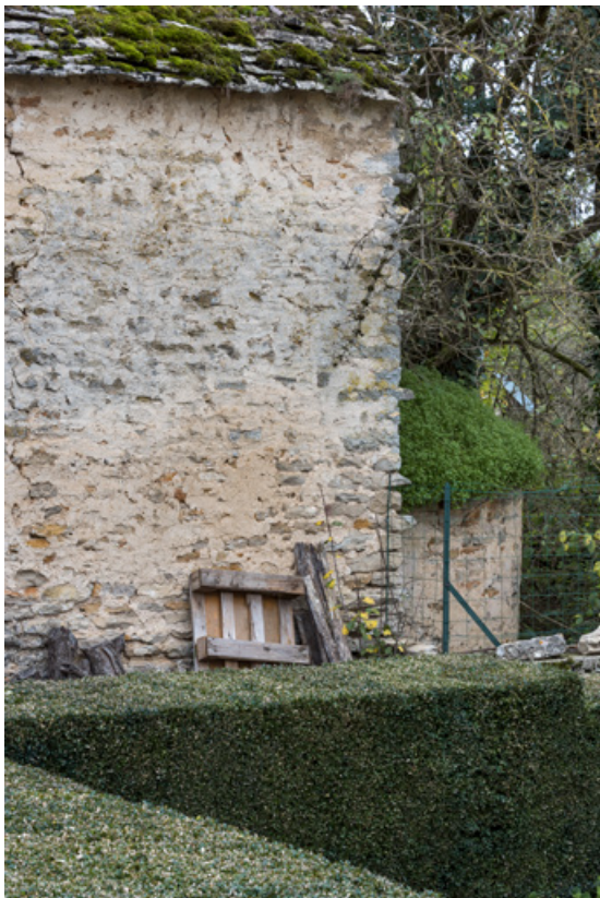
Détail du four à pain.

21, Saint-Broing-les-Moines, 17 rue Mignois