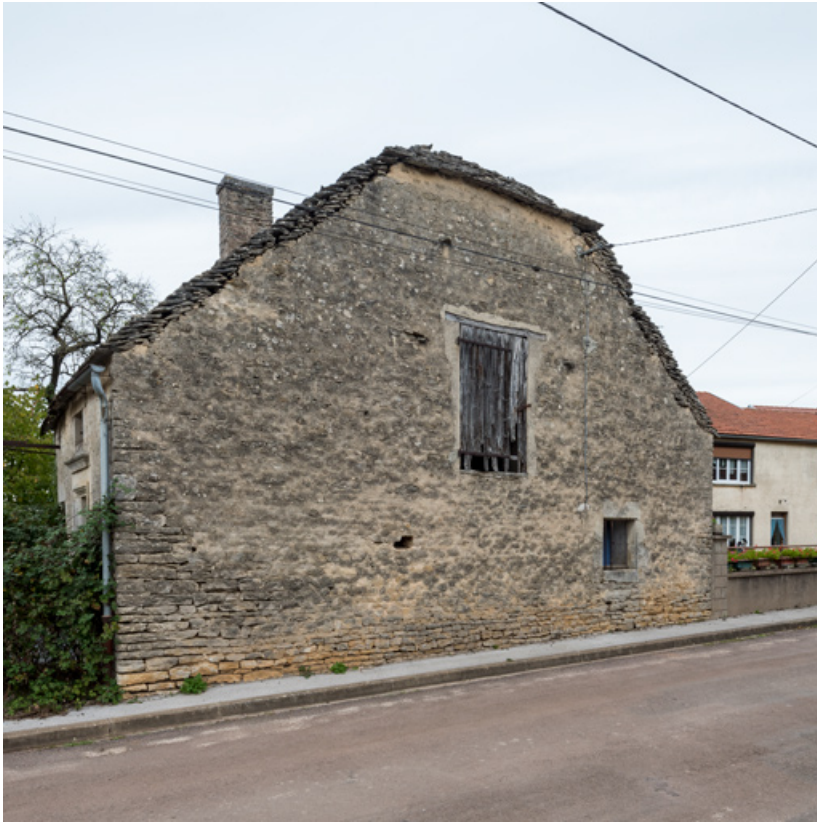
Vue de la façade sud.

21, Saint-Broing-les-Moines, 17 rue Mignois