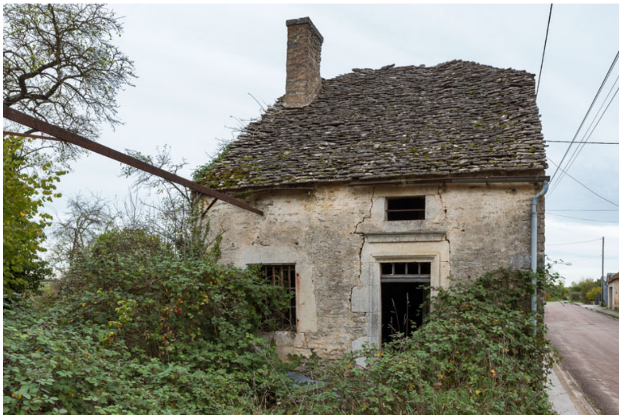
Vue de la façade ouest.

21, Saint-Broing-les-Moines, 17 rue Mignois