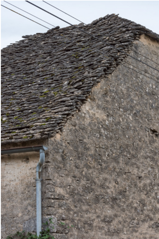
Détail du mur pignon sud.

21, Saint-Broing-les-Moines, 17 rue Mignois