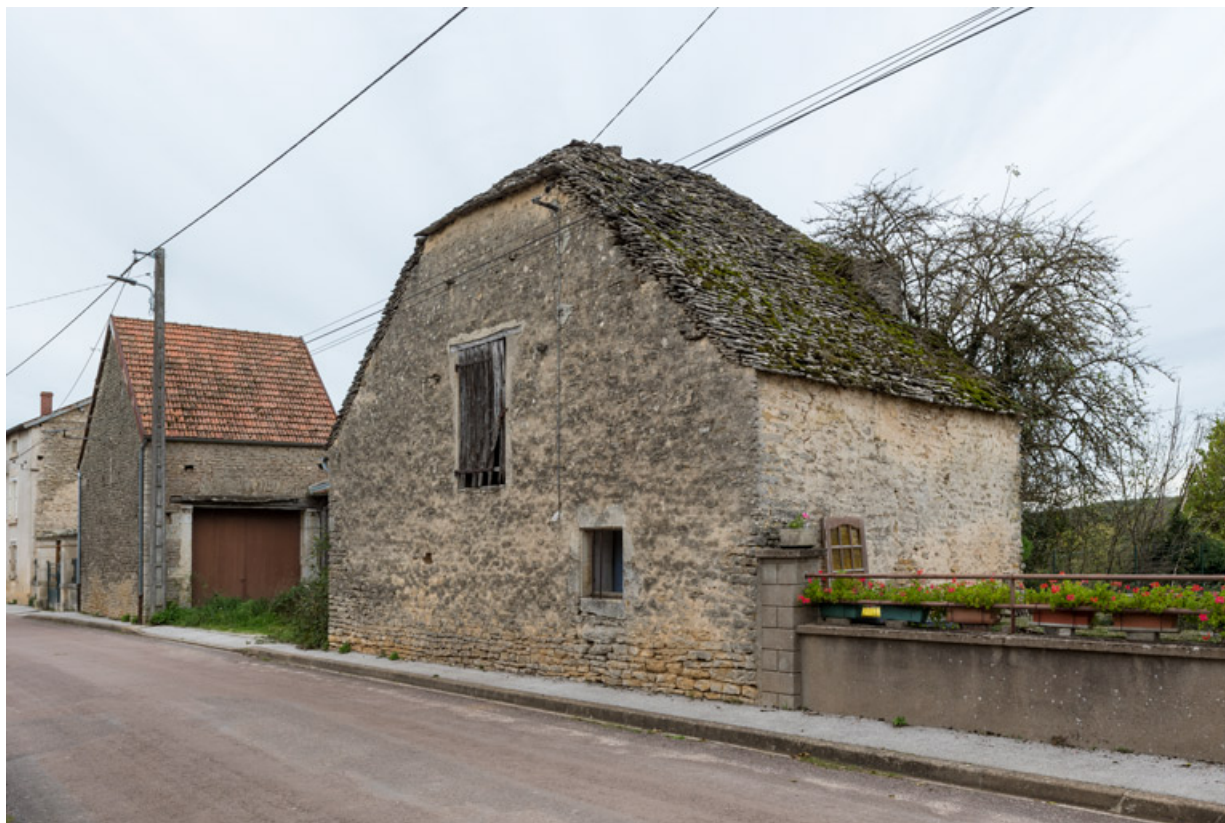
Vue d'ensemble depuis sud-est.

21, Saint-Broing-les-Moines, 17 rue Mignois