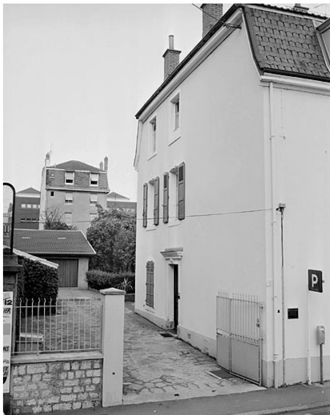
Façade latérale gauche du corps d'habitation.