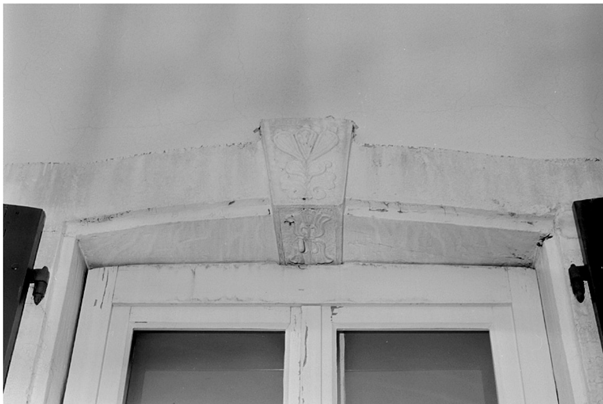
Façade sur rue du corps d'habitation. Détail de la première fenêtre du rez-de-chaussée en partant de la gauche. 25, Montbéliard, 8, 12 rue de Velotte