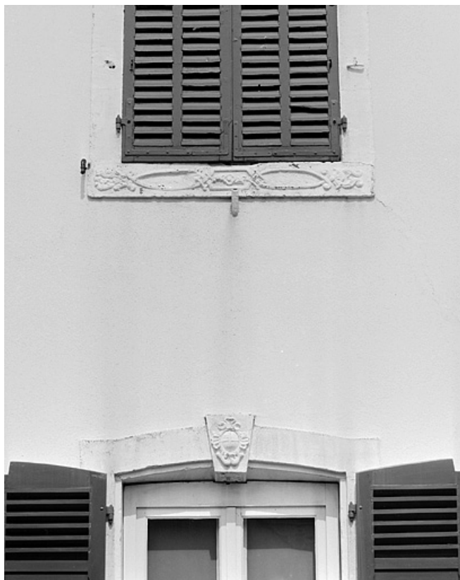
Façade sur rue du corps d'habitation. Détail de la travée centrale. 25, Montbéliard, 8, 12 rue de Velotte