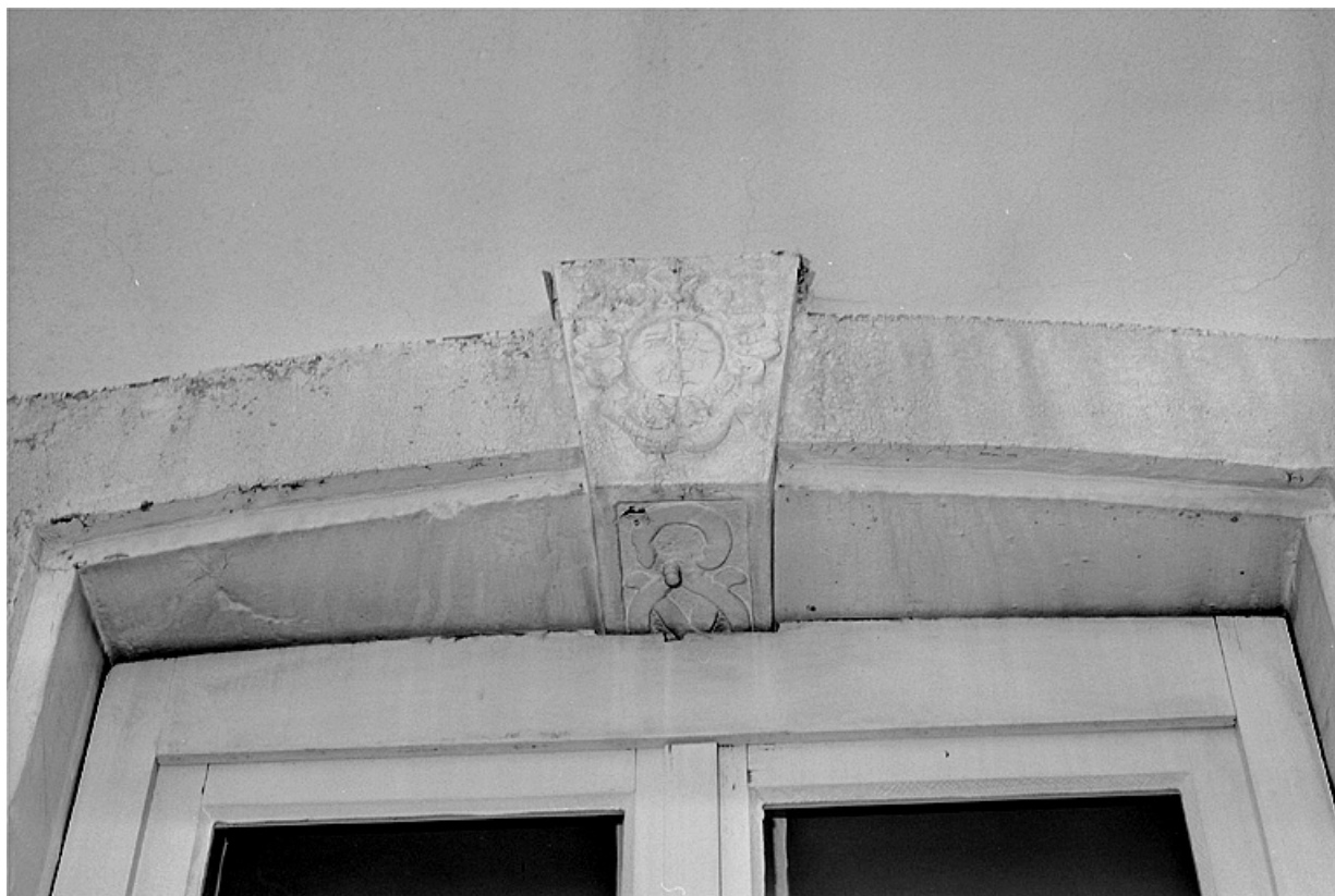
Façade sur rue du corps d'habitation. Détail de la troisième fenêtre du rez-de-chaussée en partant de la gauche. 25, Montbéliard, 8, 12 rue de Velotte