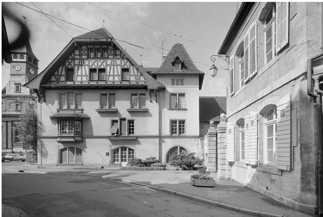
Façade sur la rue du Général-Leclerc. 25, Montbéliard, 31 place Saint-Martin