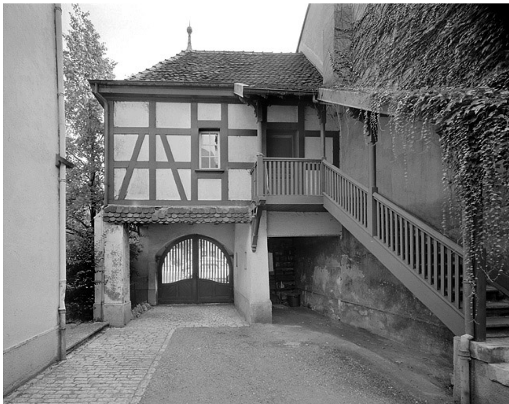
Pavillon d'entrée vu de la cour.