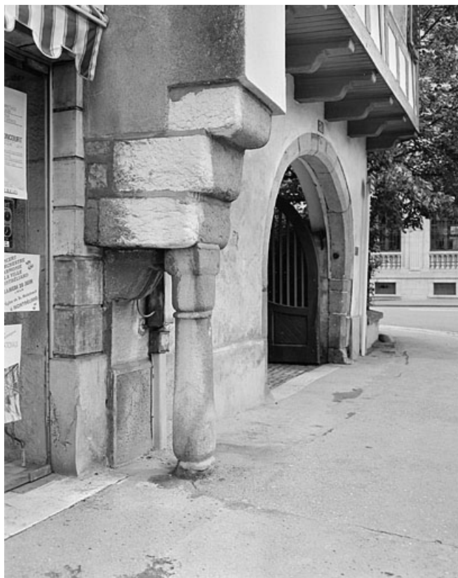
Vestige d'une ancienne maison à surplomb sur lequel s'accolle le corps d'entrée. 25, Montbéliard, 31 place Saint-Martin