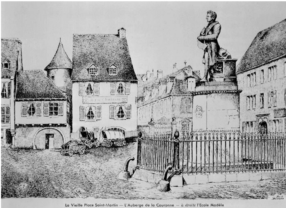
La Vieille Place Saint-Martin — L'Auberge de la Couronne — à droite l'Ecole Modèle

La vieille place Saint-Martin. L'auberge de la Couronne. L'école Modèle, avant 1900. 25, Montbéliard, 31 place Saint-Martin