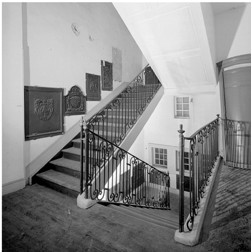
Escalier vu du palier du premier étage.