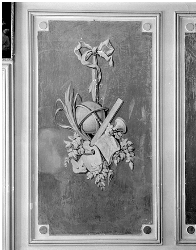
Trophée d'un panneau du grand salon.