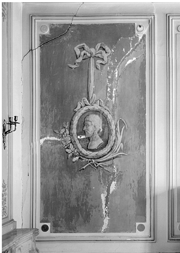
Médaille d'un panneau du grand salon.