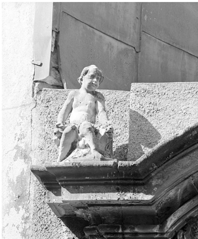
Portail provenant de l'hôtel 11, rue des Febvres, détail du putto de gauche. 25, Montbéliard, 8 place Saint-Martin