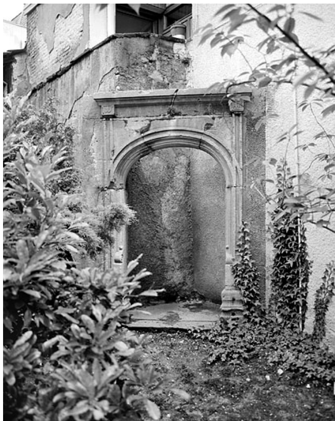
Portail provenant d'une maison détruite rue du Château. 25, Montbéliard, 8 place Saint-Martin