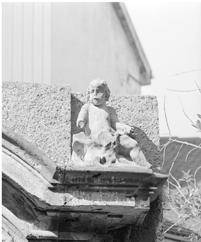
Portail provenant de l'hôtel 11, rue des Febvres, détail du putto de droite. 25, Montbéliard, 8 place Saint-Martin