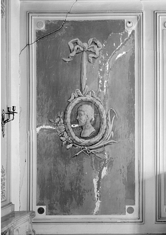
Médaille d'un panneau du grand salon.