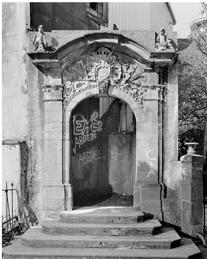
Portail provenant de l'hôtel 11, rue des Febvres. 25, Montbéliard, 8 place Saint-Martin