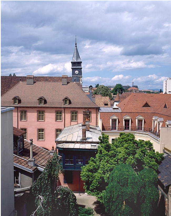
Façade sur cour du corps de bâtiment principal et jardin.