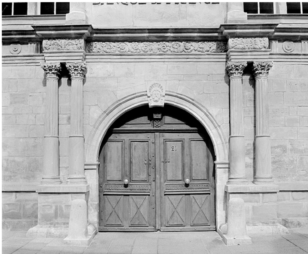
Façade sur la place, portail.