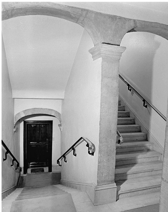
Escalier vu du palier du deuxième étage.