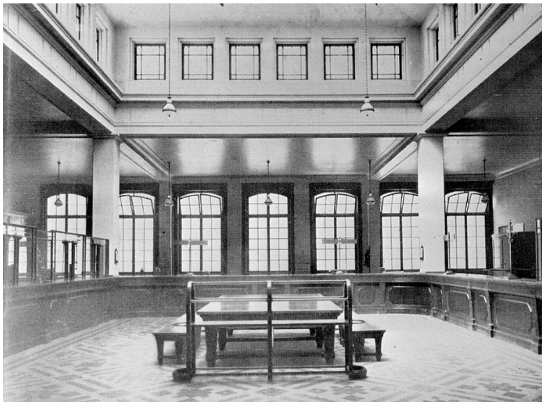
Hall de la banque [au premier étage du nouveau bâtiment], 1934. 25, Montbéliard, 21 place Saint-Martin