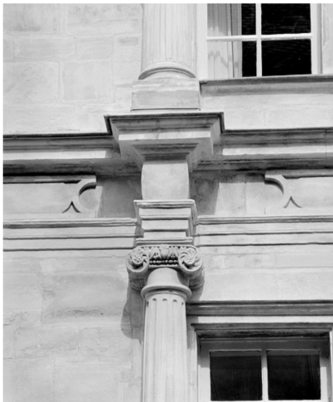
Façade sur la place, premier étage, chapiteau de l'ordre ionique à droite de la travée centrale. 25, Montbéliard, 21 place Saint-Martin