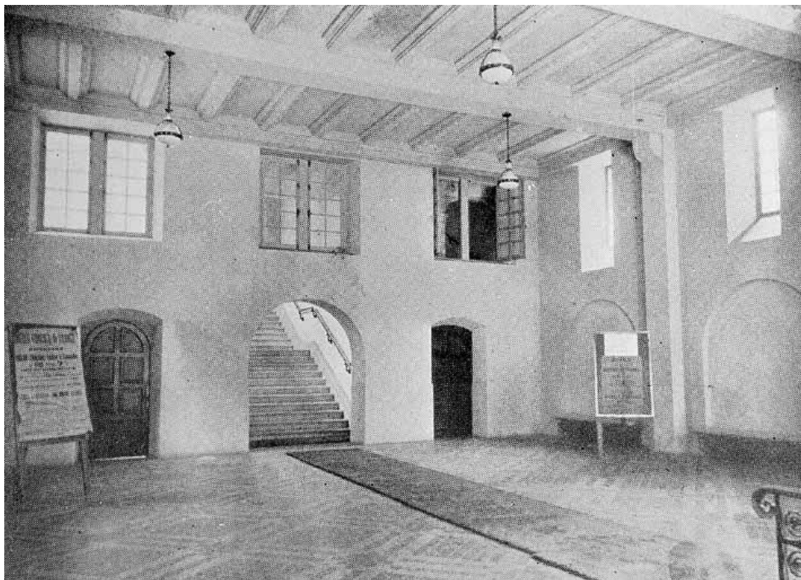
Hall d'entrée de la banque [correspondant au rez-de-chaussée et au premier étage de l'ancienne maison], 1934. 25, Montbéliard, 21 place Saint-Martin