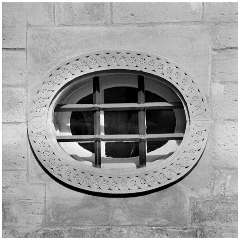
Façade sur la place, oculus du rez-de-chaussée. 25, Montbéliard, 21 place Saint-Martin