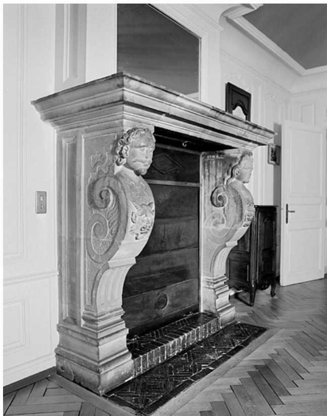
Deuxième cheminée au deuxième étage. 25, Montbéliard, 21 place Saint-Martin