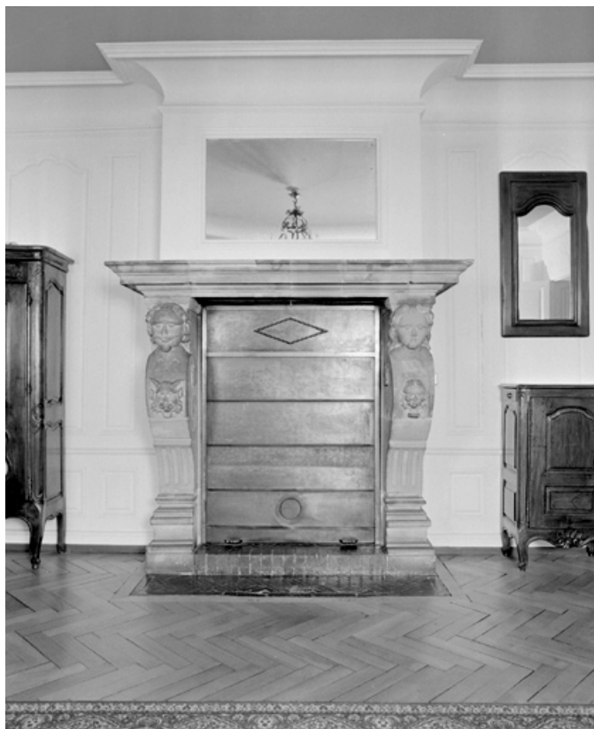
Deuxième cheminée au deuxième étage. 25, Montbéliard, 21 place Saint-Martin