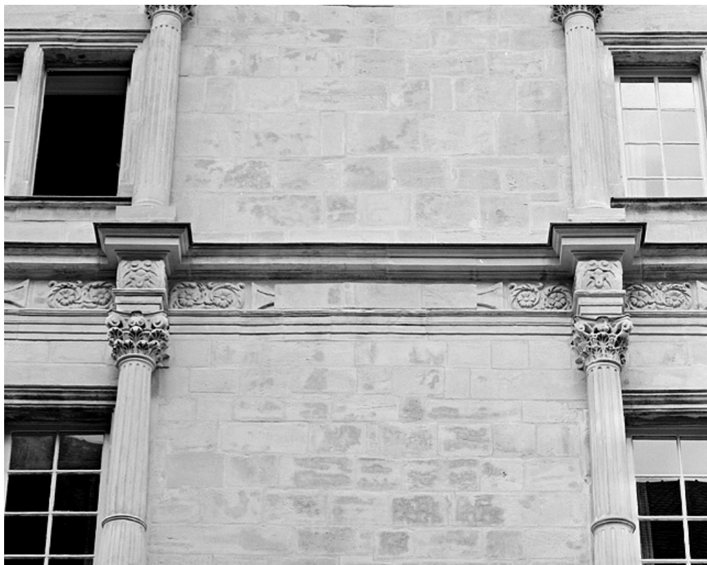
Façade sur la place, deuxième étage, détail de l'ordre corinthien de la travée centrale. 25, Montbéliard, 21 place Saint-Martin