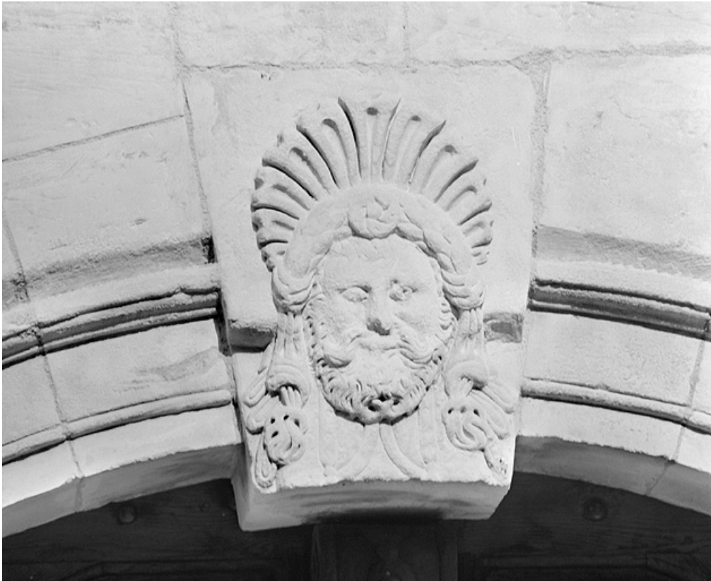
Façade sur la place, clef de l'arc du portail. 25, Montbéliard, 21 place Saint-Martin