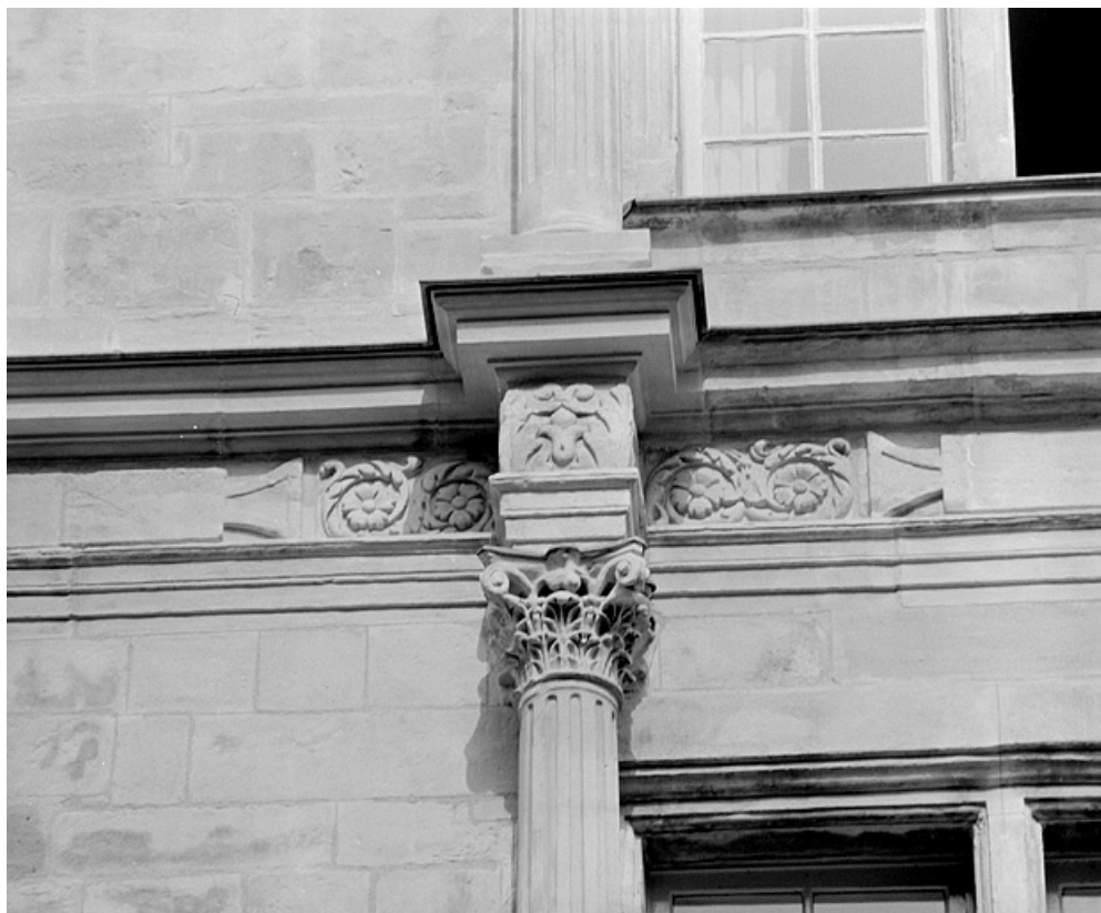
Façade sur la place, deuxième étage, chapiteau de l'ordre corinthien à droite de la travée centrale. 25, Montbéliard, 21 place Saint-Martin