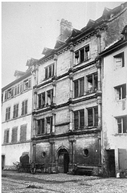
Façade sur la place Saint-Martin [avant la démolition des maisons mitoyennes], vers 1870-1880. 25, Montbéliard, 21 place Saint-Martin