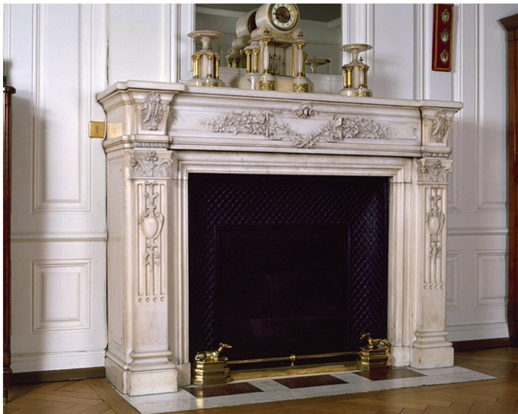
Troisième cheminée au deuxième étage. 25, Montbéliard, 21 place Saint-Martin