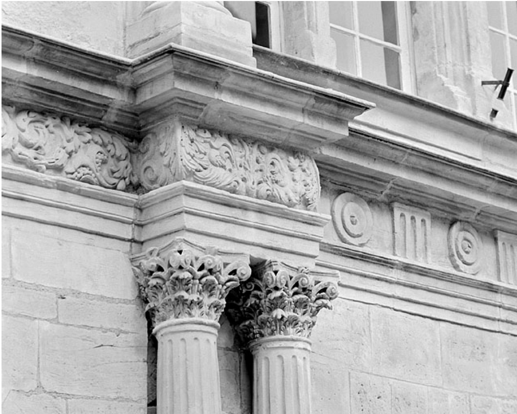
Façade sur la place, détail de l'ordre du portail.