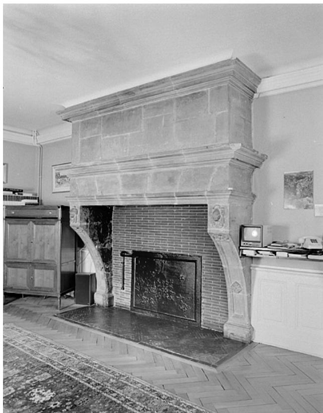
Première cheminée au deuxième étage. 25, Montbéliard, 21 place Saint-Martin