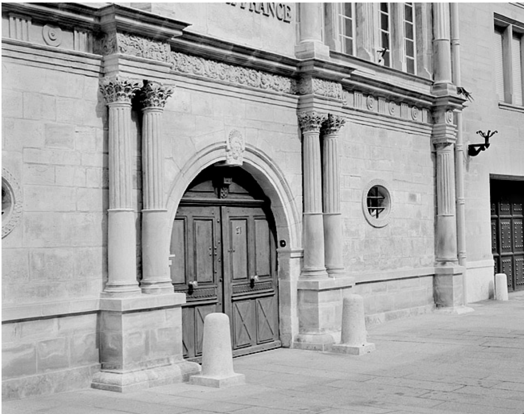
Façade sur la place, rez-de-chaussée. 25, Montbéliard, 21 place Saint-Martin