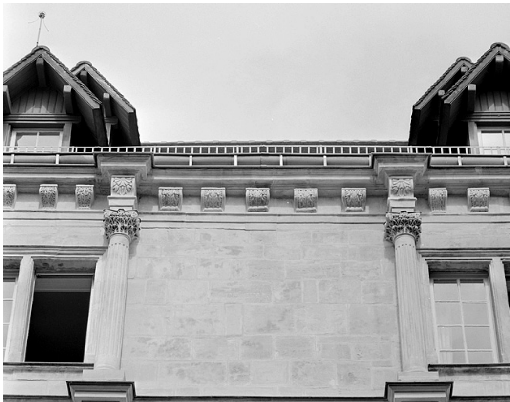
Façade sur la place, troisième étage, détail de l'ordre composite de la travée centrale. 25, Montbéliard, 21 place Saint-Martin