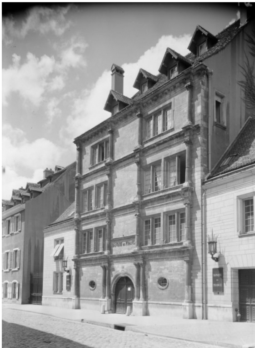
Vue de trois quarts droit [1re moitié 20e siècle]. 25, Montbéliard, 21 place Saint-Martin