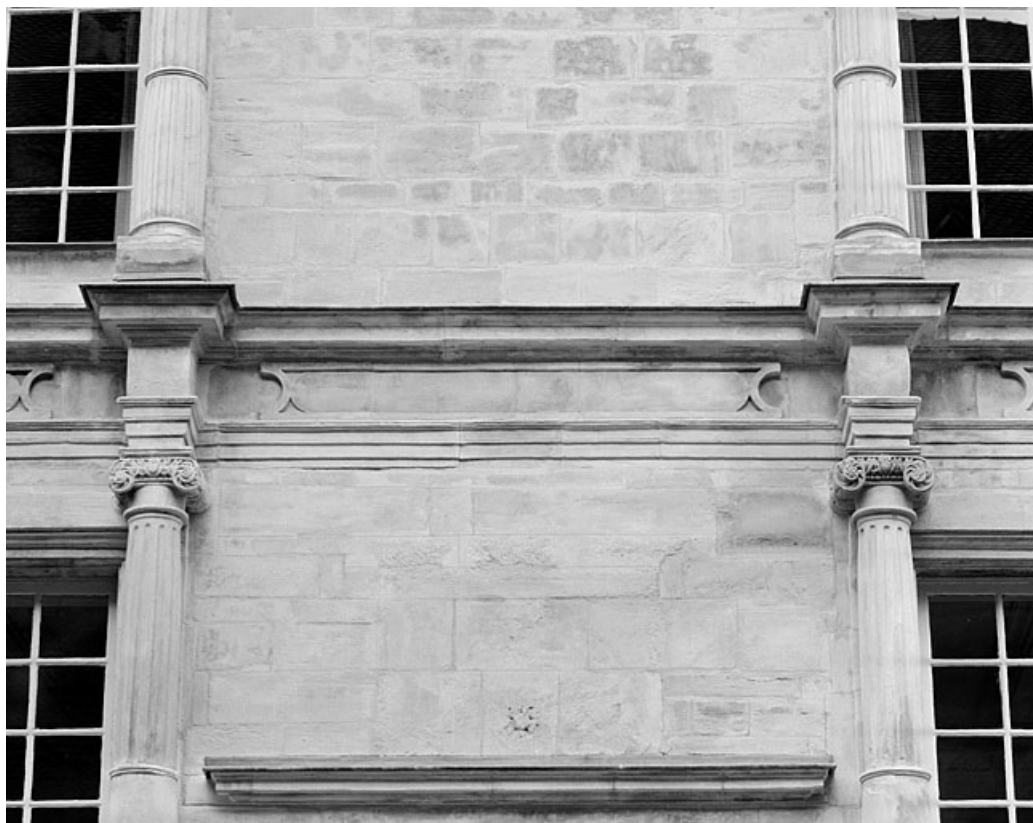
Façade sur la place, premier étage, détail de l'ordre ionique de la travée centrale. 25, Montbéliard, 21 place Saint-Martin