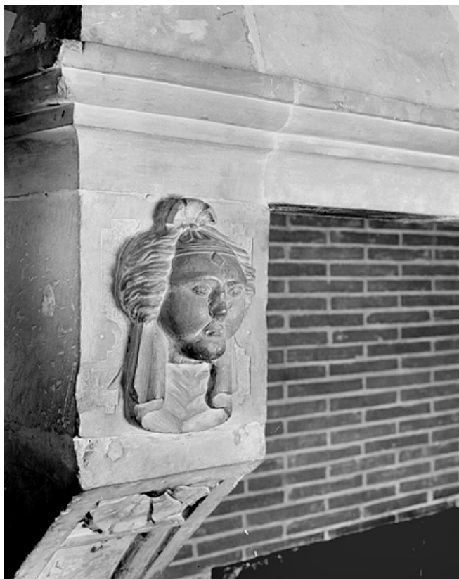
Première cheminée au deuxième étage, détail. 25, Montbéliard, 21 place Saint-Martin