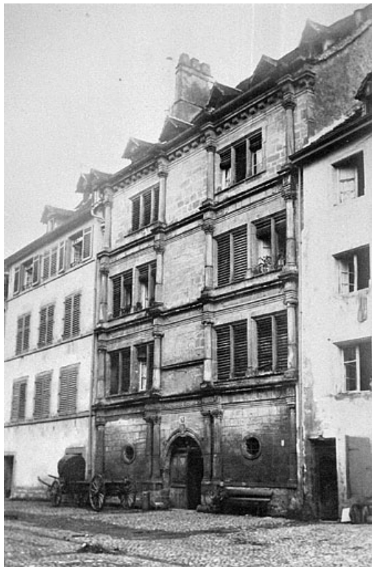
Façade sur la place Saint-Martin [avant la démolition des maisons mitoyennes], vers 1870-1880. 25, Montbéliard, 21 place Saint-Martin