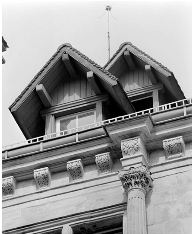
Façade sur la place, troisième étage, détail de l'ordre composite à gauche de la travée centrale. 25, Montbéliard, 21 place Saint-Martin