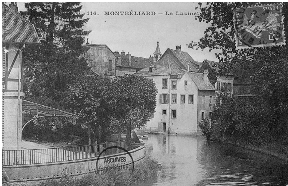
Montbéliard. La Luzine [vue du jardin de la maison], avant 1913.

25, Montbéliard, 13, 15 rue Saint-Hippolyte