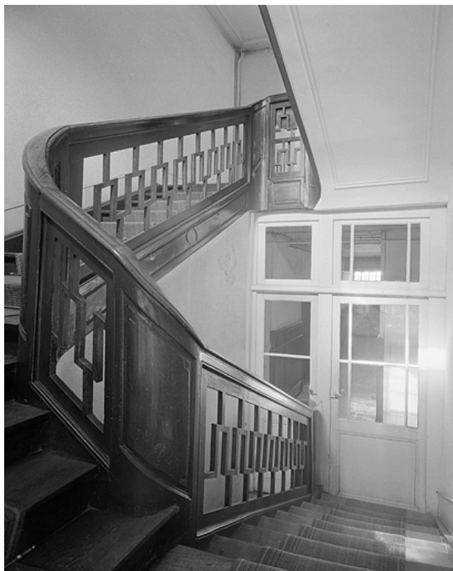
Première volée d'escalier du corps de bâtiment principal.

25, Montbéliard, 13, 15 rue Saint-Hippolyte