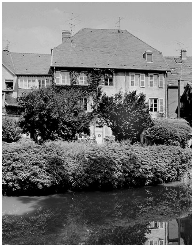
Façade sur jardin du corps de bâtiment principal.

25, Montbéliard, 13, 15 rue Saint-Hippolyte