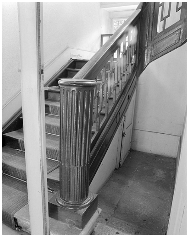
Départ de l'escalier du corps de bâtiment principal.

25, Montbéliard, 13, 15 rue Saint-Hippolyte