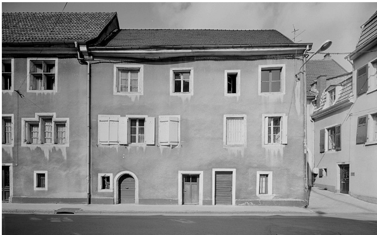
Façade sur la rue des Halles de la maison acquise entre 1715 et 1812.