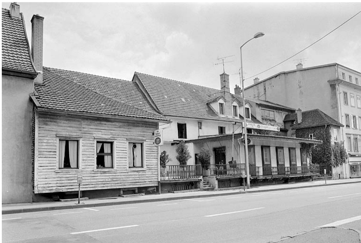
Vue d'ensemble des façades sur la place Francisco-Ferrer.