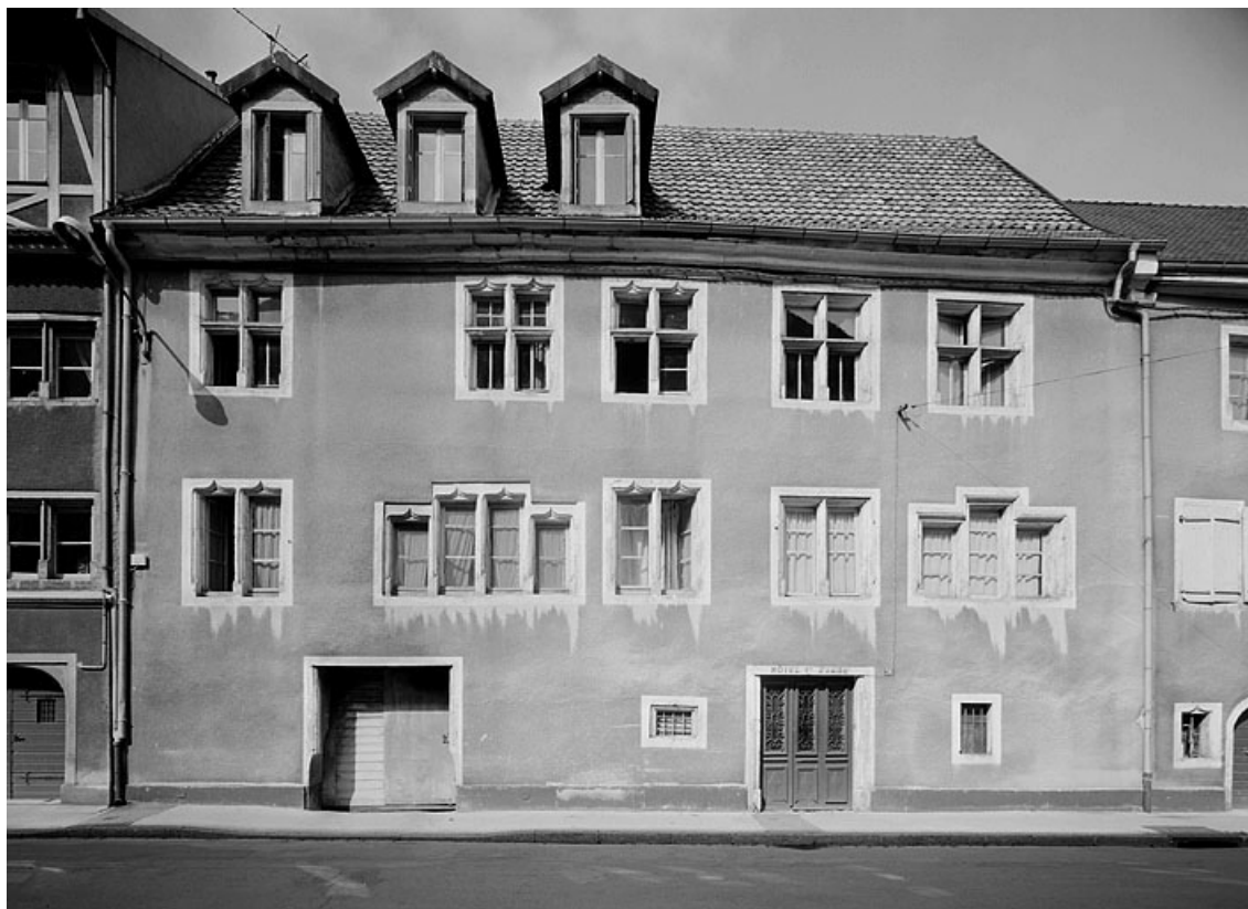
Façade sur la rue des Halles des parties édifiées au 16e siècle.