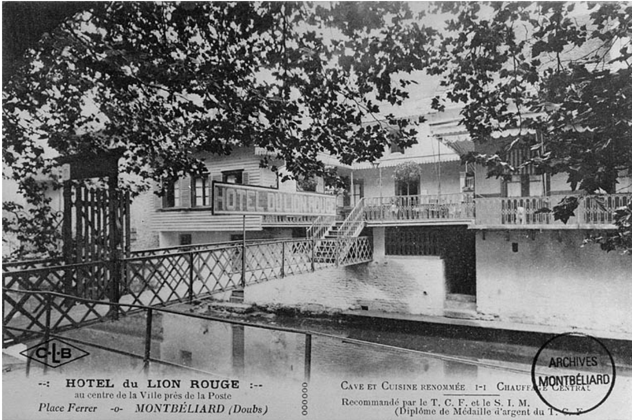
Hôtel du Lion Rouge [façade sur la Lizaine], début 20e siècle. 25, Montbéliard, 38 rue des Halles