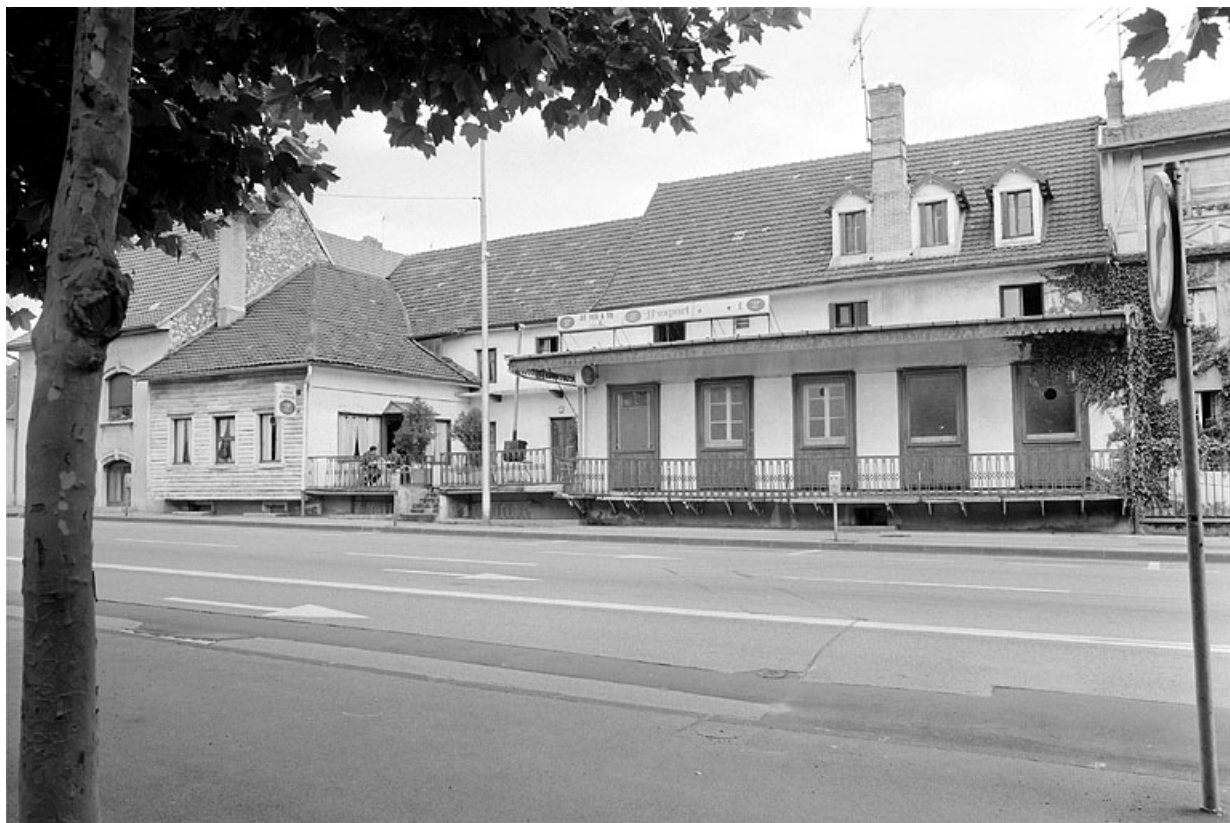
Vue d'ensemble des façades sur la place Francisco-Ferrer.