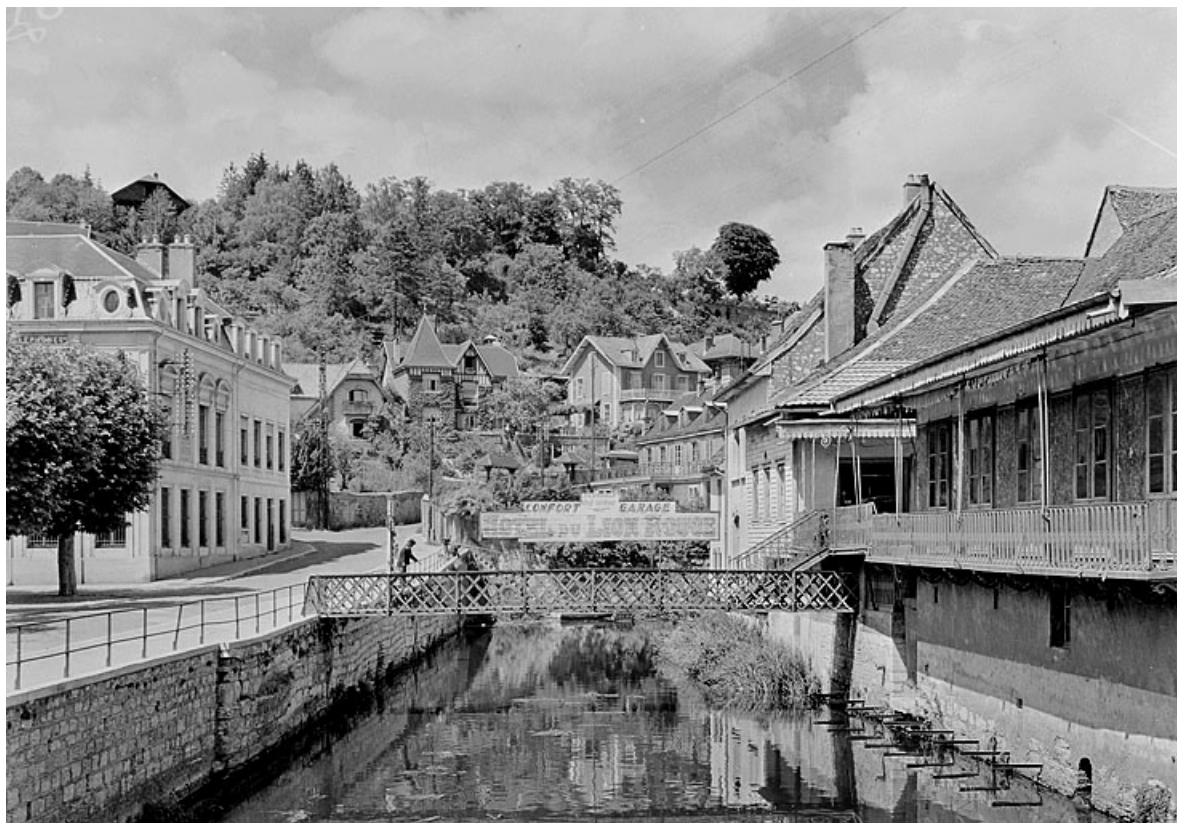
Hôtel de voyageurs du Lion Rouge. Façade sur la Luzine et passerelle, 2e tiers 20e siècle. 25, Montbéliard, 38 rue des Halles