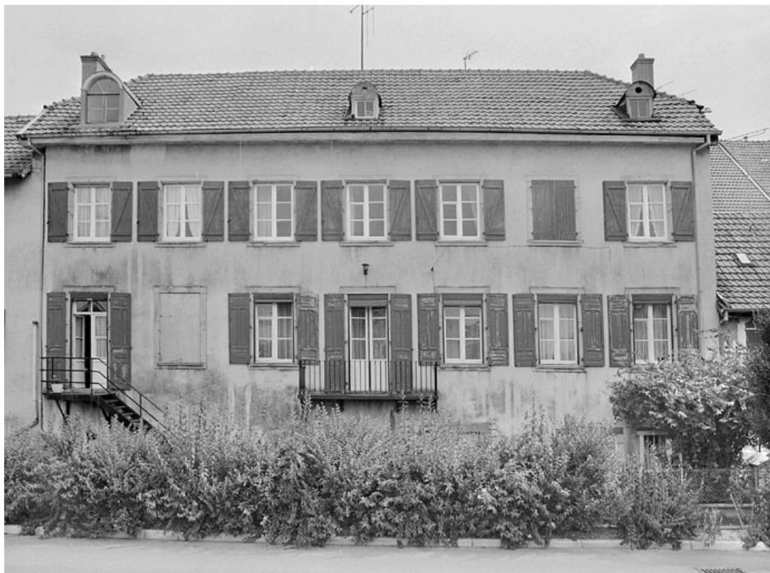
Façade sur l'ancien jardin du corps de bâtiment arrière.

25, Montbéliard, 25 rue Georges Clémenceau