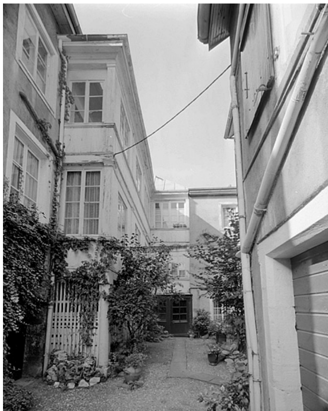
Galleries sur cour desservant le corps de bâtiment arrière.

25, Montbéliard, 25 rue Georges Clémenceau