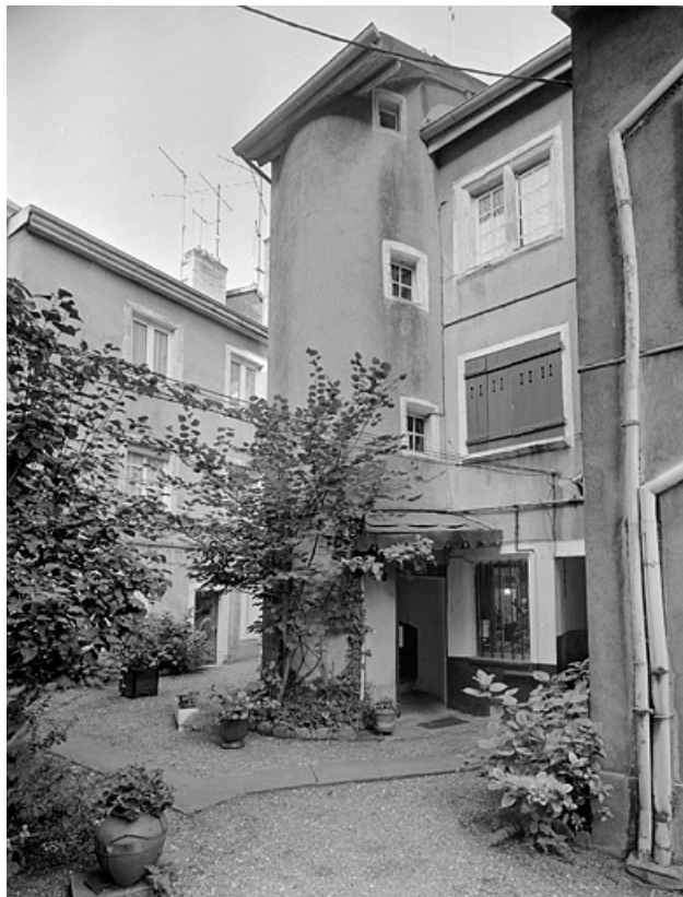
Façade sur cour et tour d'escalier de l'ancienne maison de gauche. 25, Montbéliard, 25 rue Georges Clémenceau