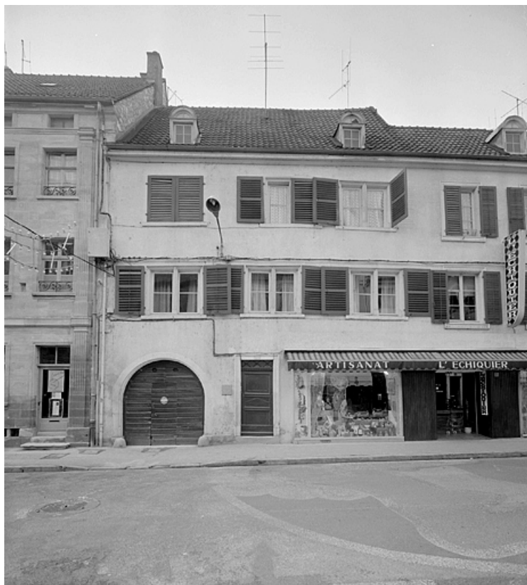
Façade sur rue de la maison de gauche.

25, Montbéliard, 25 rue Georges Clémenceau