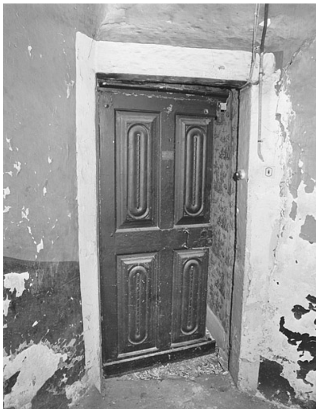
Porte du deuxième étage dans la tour d'escalier.

25, Montbéliard, 18 rue Georges Clémenceau