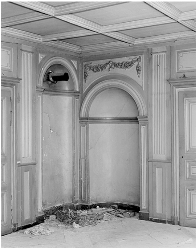
Niches de l'ancien poêle de la pièce principale.

25, Montbéliard, 18 rue Georges Clémenceau