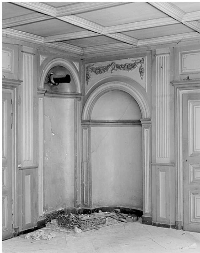
Niches de l'ancien poêle de la pièce principale.

25, Montbéliard, 18 rue Georges Clémenceau