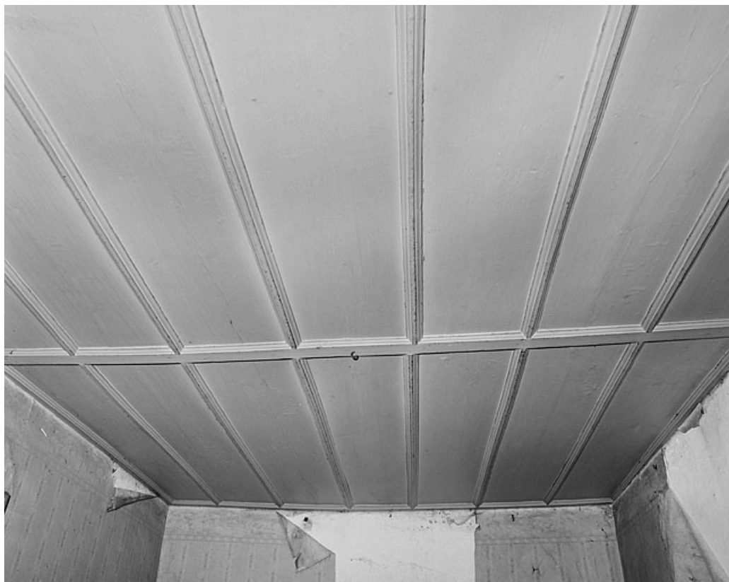
Plafond d'une pièce au premier étage du premier corps de bâtiment.

25, Montbéliard, 18 rue Georges Clémenceau