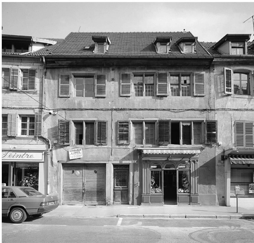
Façade sur rue. La porte cochère était à l'origine en plein-cintre.

25, Montbéliard, 18 rue Georges Clémenceau