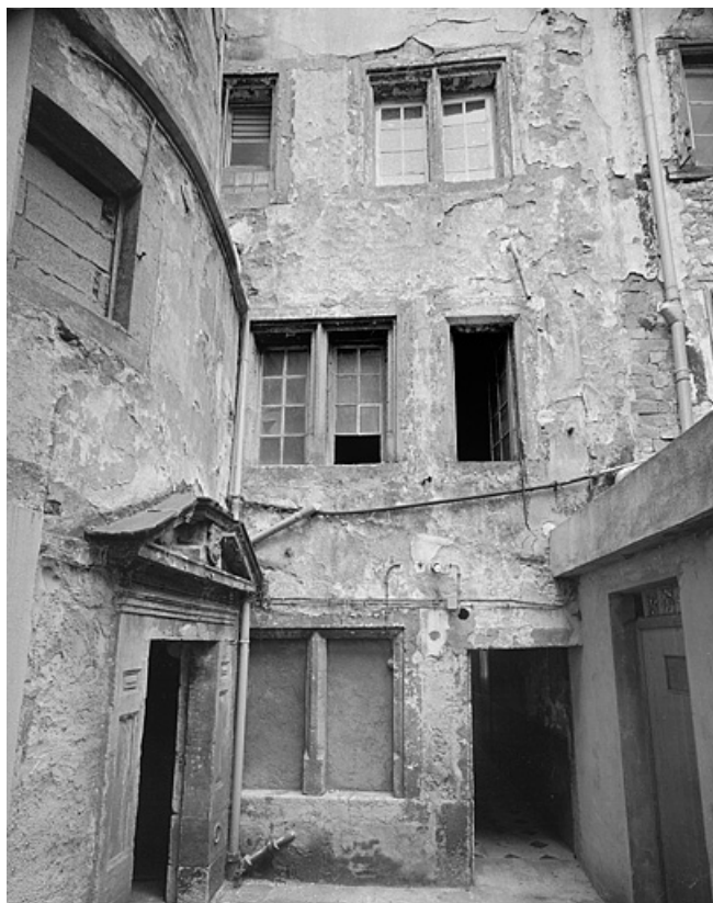
Façade sur cour du premier corps de bâtiment et tour d'escalier. 25, Montbéliard, 18 rue Georges Clémenceau