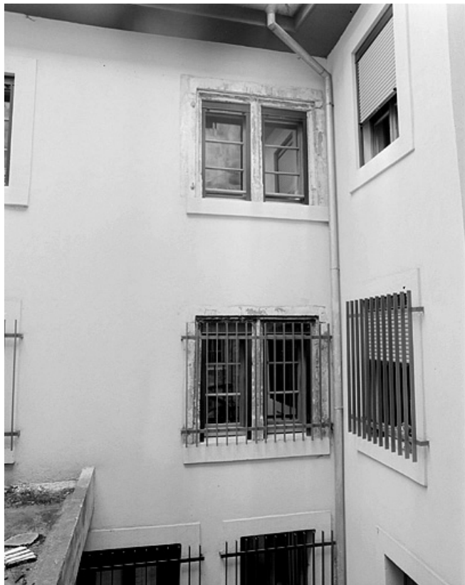
Façade sur cour du deuxième corps de bâtiment et galerie de liaison. 25, Montbéliard, 18 rue Georges Clémenceau