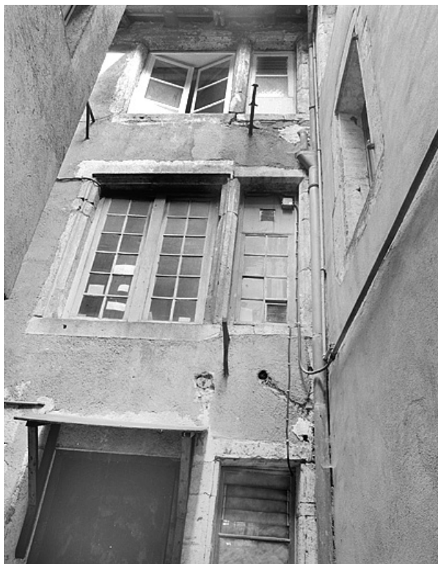
Façade sur cour du deuxième corps de bâtiment.