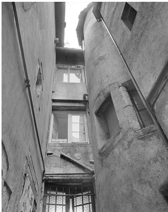
Façade sur cour du premier corps de bâtiment et tour d'escalier. 25, Montbéliard, 7 rue des Febvres