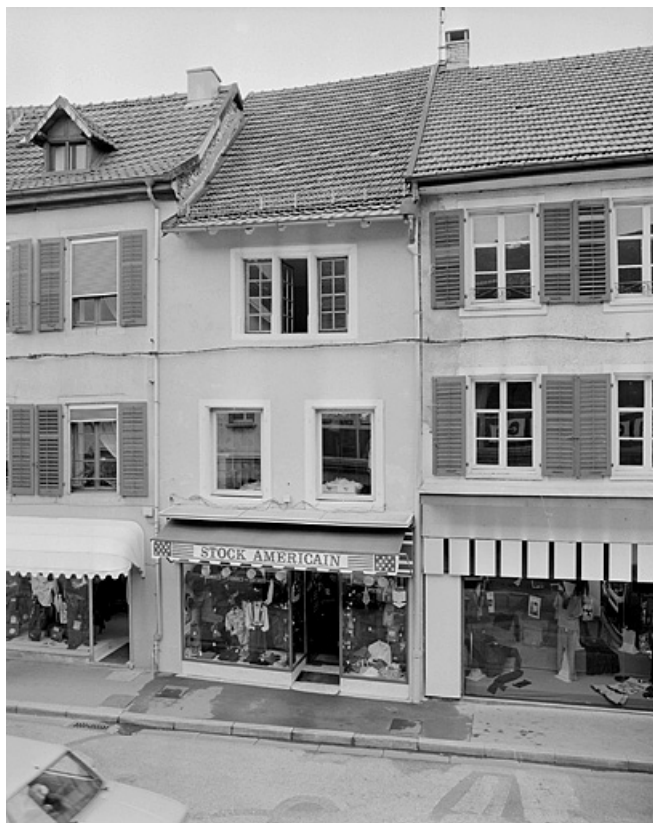
Façade sur la rue Georges Clémenceau du deuxième corps de bâtiment. 25, Montbéliard, 7 rue des Febvres