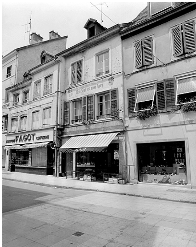
Façade sur la rue des Febvres du premier corps de bâtiment. 25, Montbéliard, 7 rue des Febvres