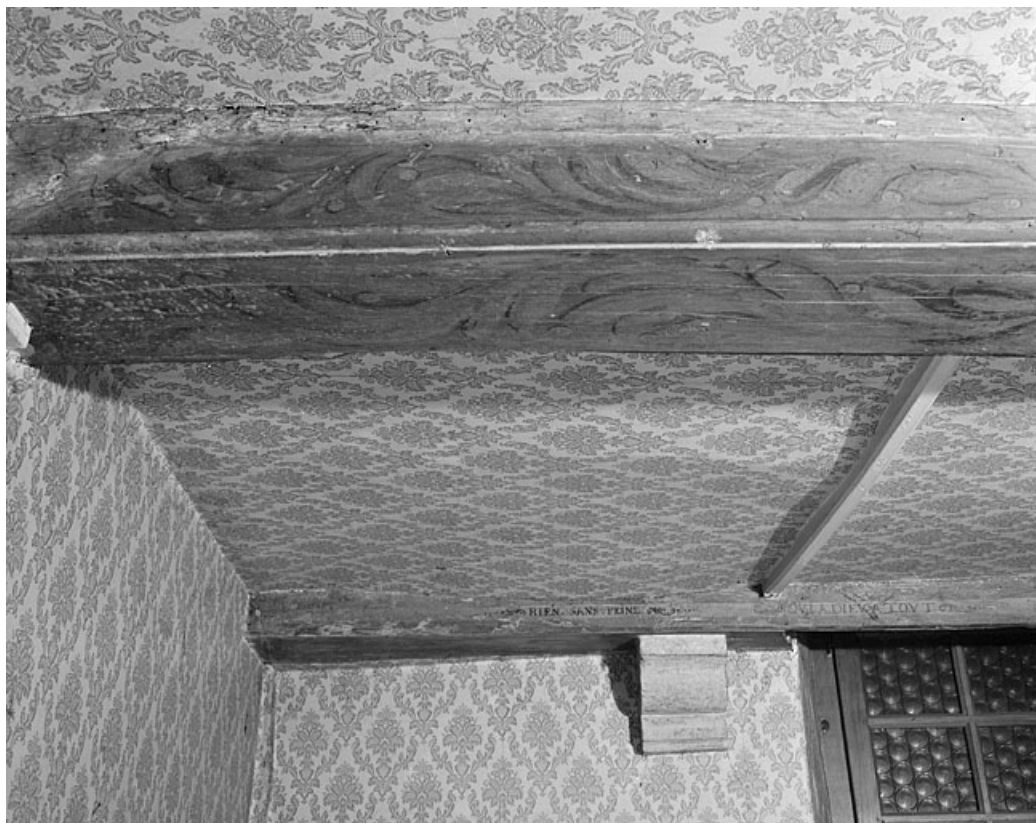
Premier corps de bâtiment. Plafond du rez-de-chaussée.