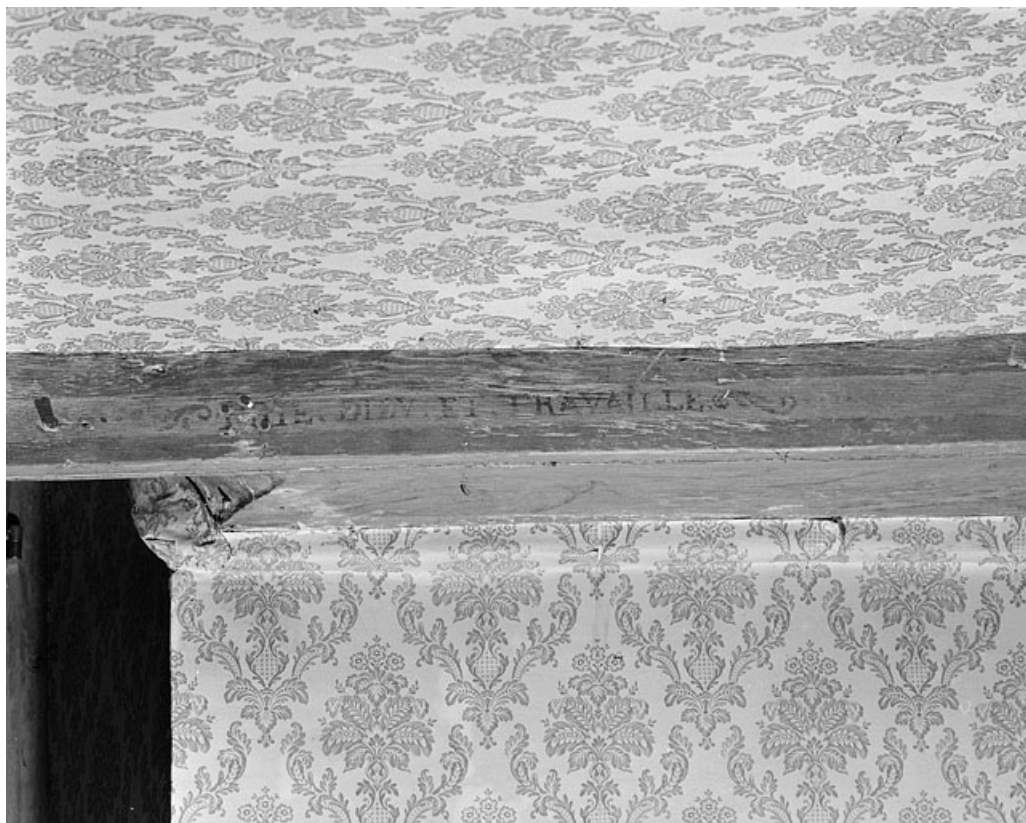
Premier corps de bâtiment. Plafond du rez-de-chaussée.