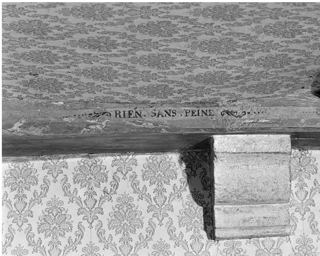
Premier corps de bâtiment. Plafond du rez-de-chaussée.