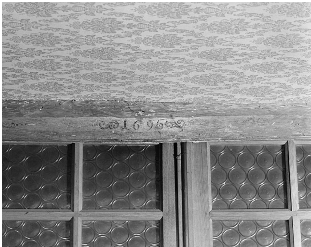
Premier corps de bâtiment. Plafond du rez-de-chaussée.