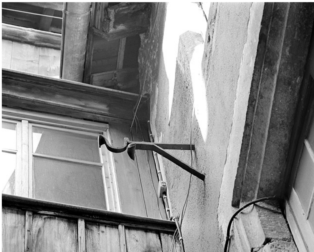
Façade sur cour du deuxième corps de bâtiment. Support de bac à fleurs. 25, Montbéliard, 7 rue des Febvres