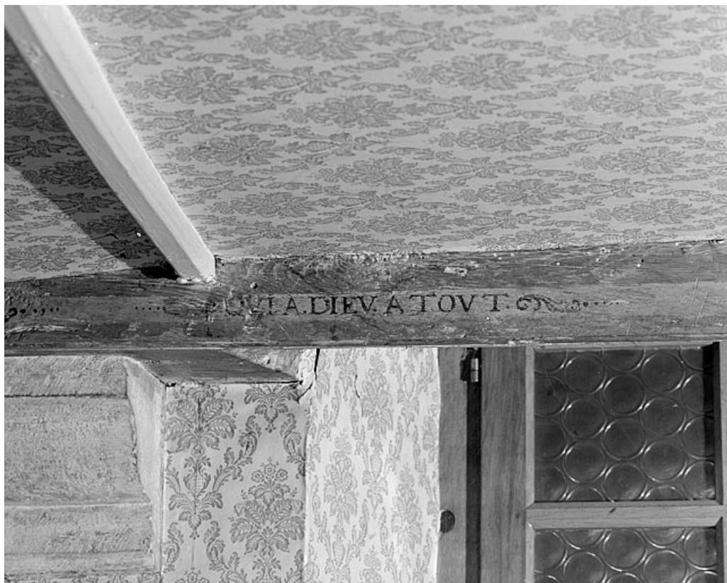
Premier corps de bâtiment. Plafond du rez-de-chaussée.