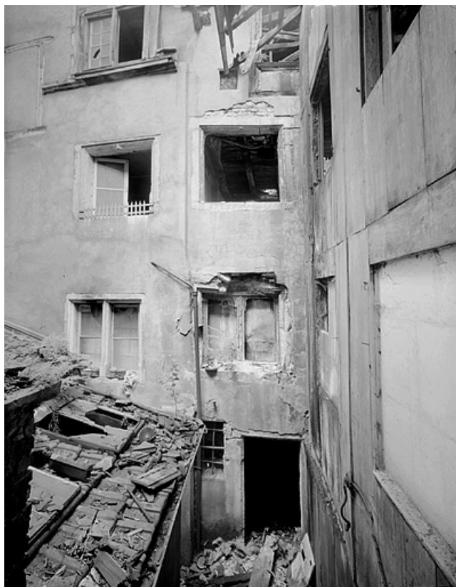
Partie inférieure des corps de bâtiment sur cour.