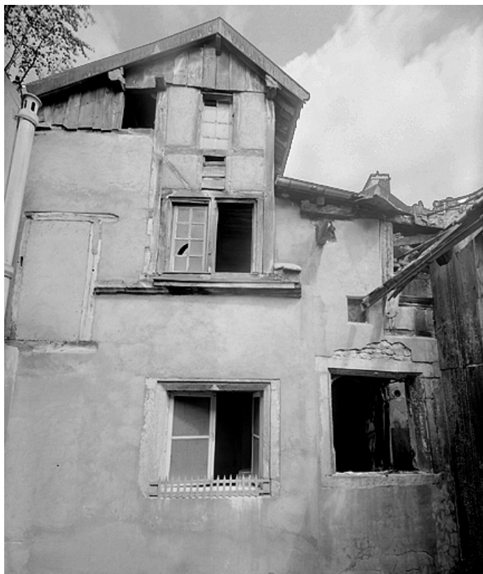
Partie supérieure des corps de bâtiment sur cour.