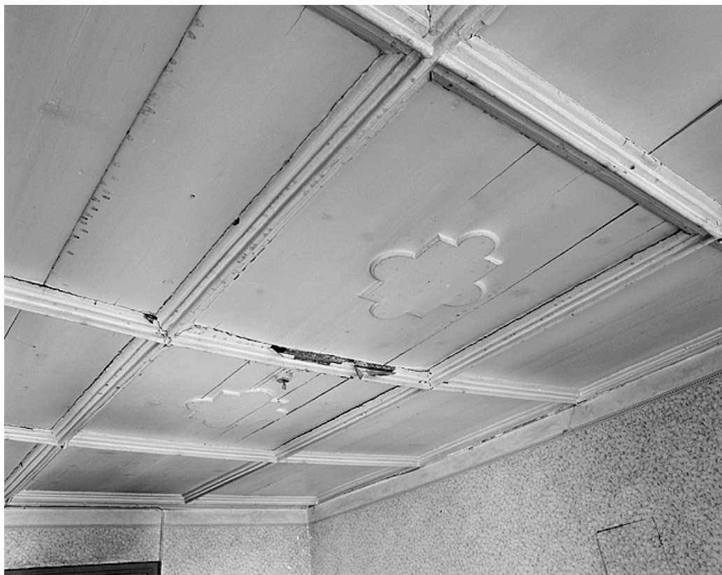
Plafond au deuxième étage de la maison de droite.