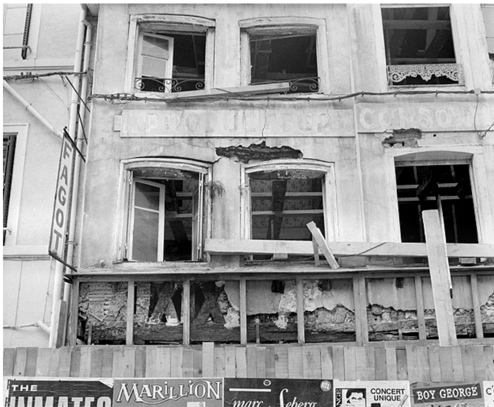
Façade sur rue de la maison de gauche en cours de restauration. Sous les fenêtres se devine une série de guettes en croix de Saint-André.