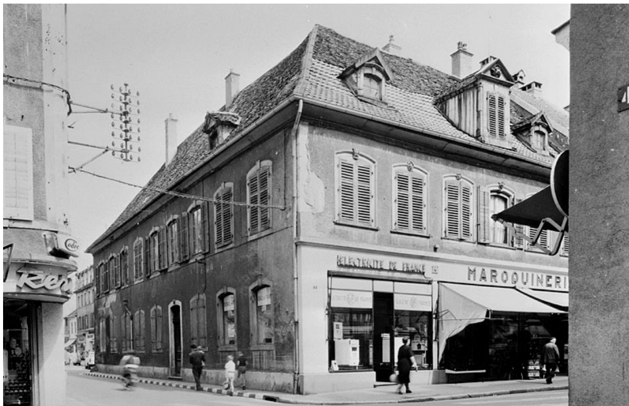
Ensemble des façades sud et ouest avant démolition, vers 1950-1960.