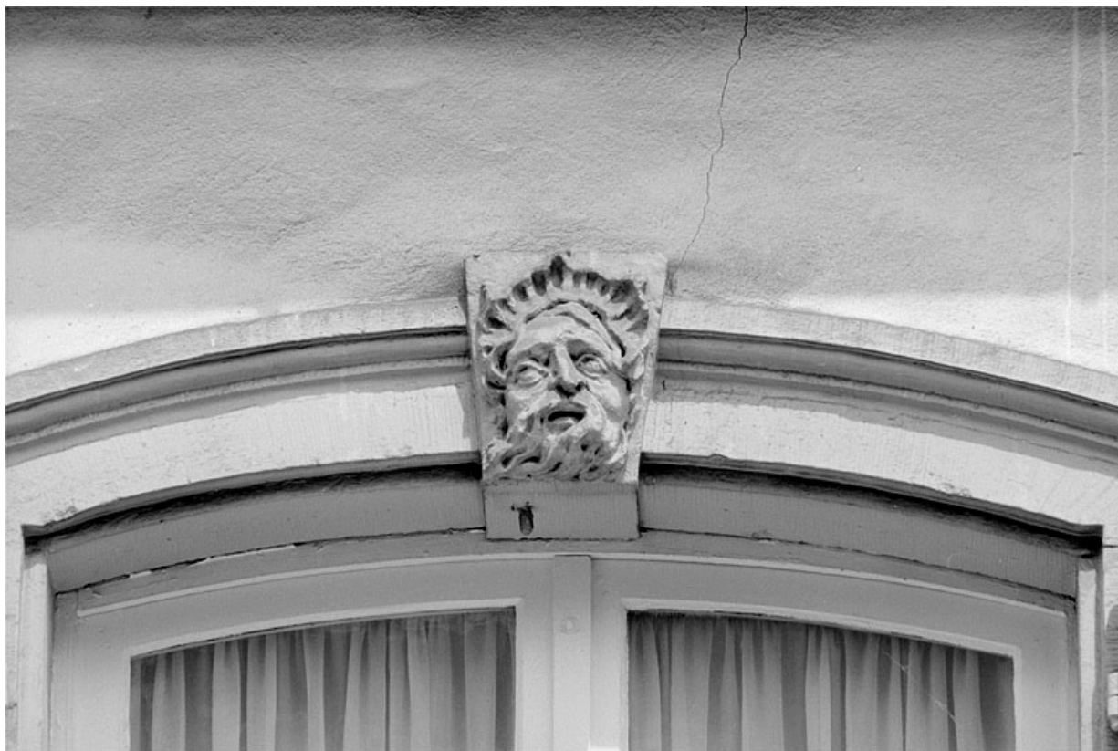
Façade principale, premier étage, détail de la fenêtre de droite. 25, Montbéliard, 11 rue des Febvres