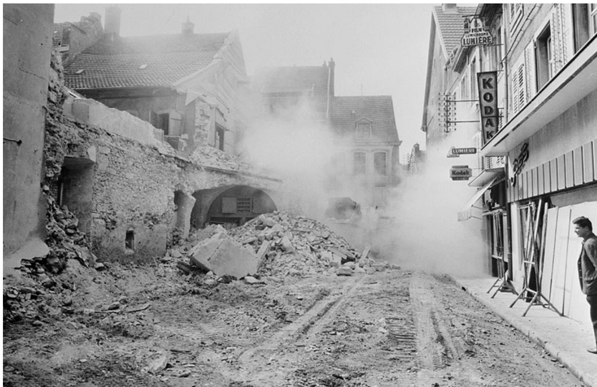
Ensemble de l'aile ouest en cours de démolition, vers 1950-1960.