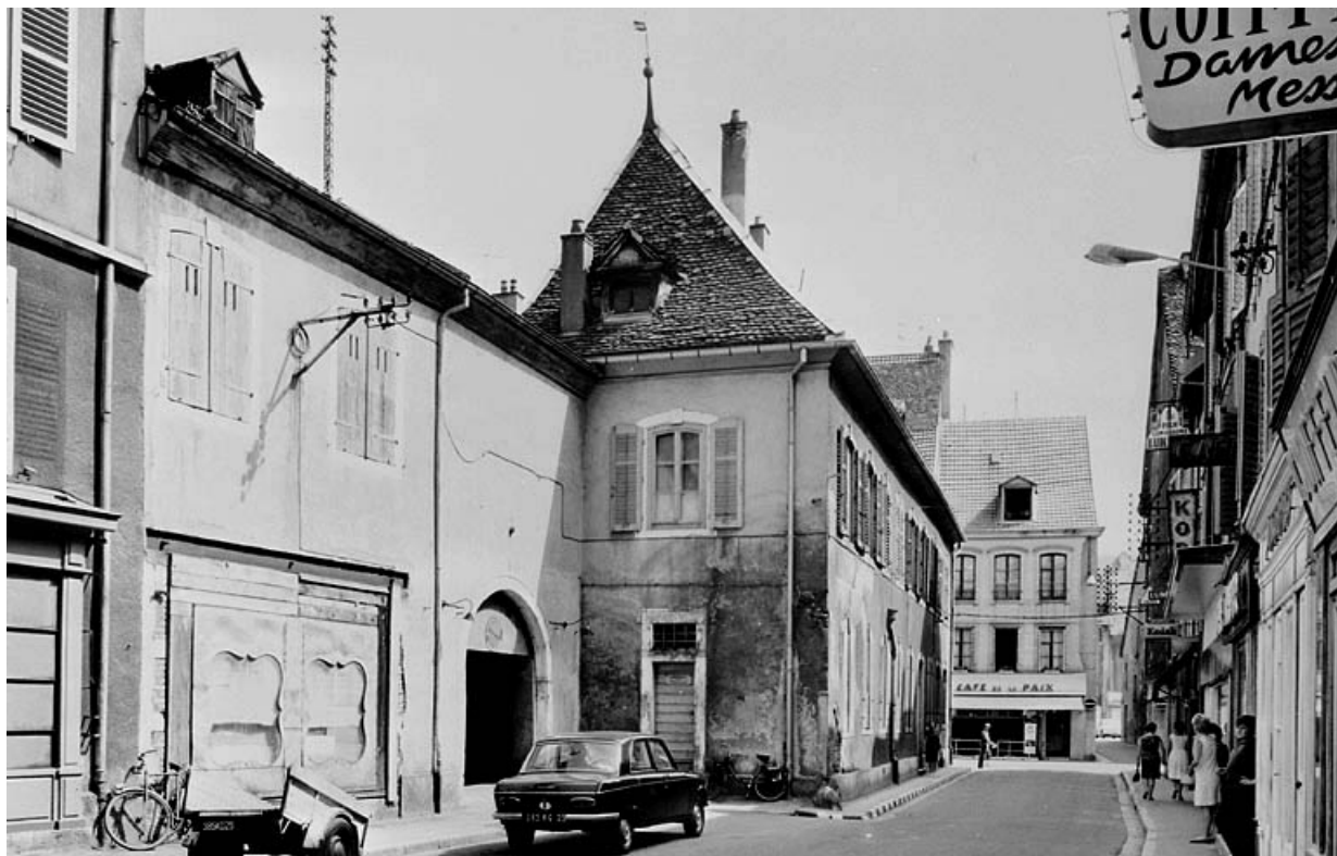
Ensemble de l'aile ouest avant démolition, vers 1950-1960.