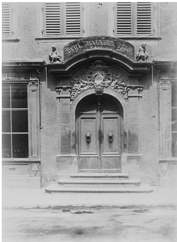
Portail de la façade principale avant son déplacement, fin 19e ou début 20e siècle. 25, Montbéliard, 11 rue des Febvres