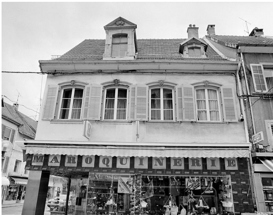
Vue d'ensemble de la partie subsistante de la façade principale.