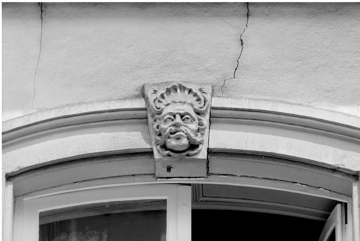
Façade principale, premier étage, détail de la troisième fenêtre en partant de la gauche. 25, Montbéliard, 11 rue des Febvres