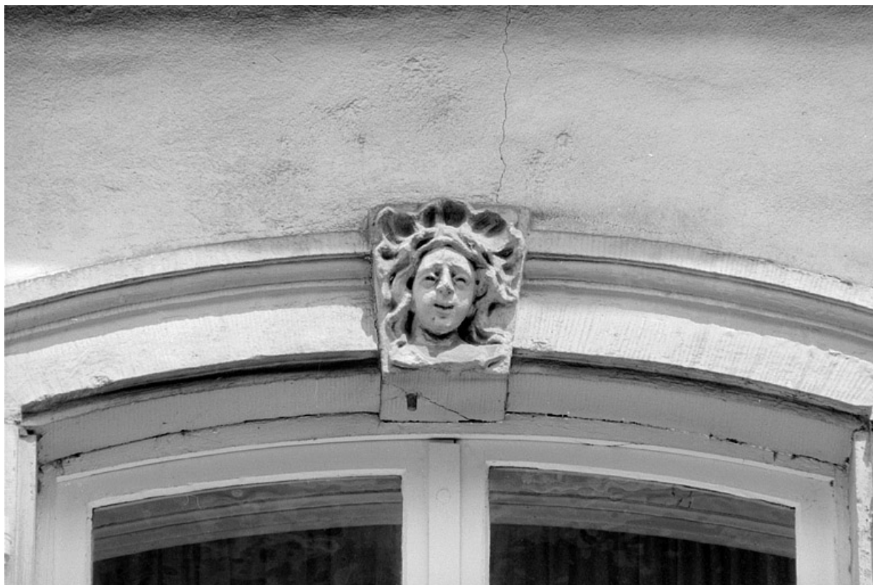
Façade principale, premier étage, détail de la première fenêtre à gauche. 25, Montbéliard, 11 rue des Febvres