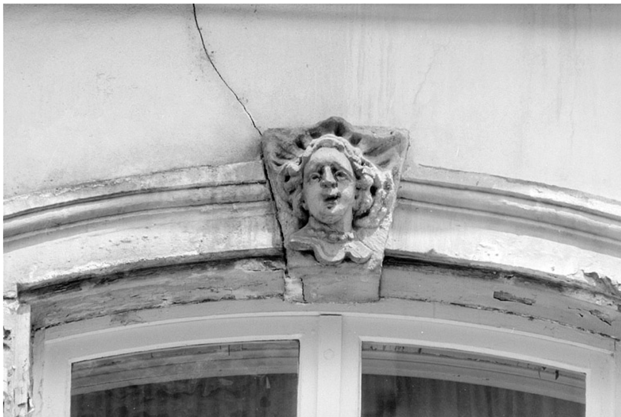
Façade principale, premier étage, détail de la deuxième fenêtre en partant de la gauche. 25, Montbéliard, 11 rue des Febvres