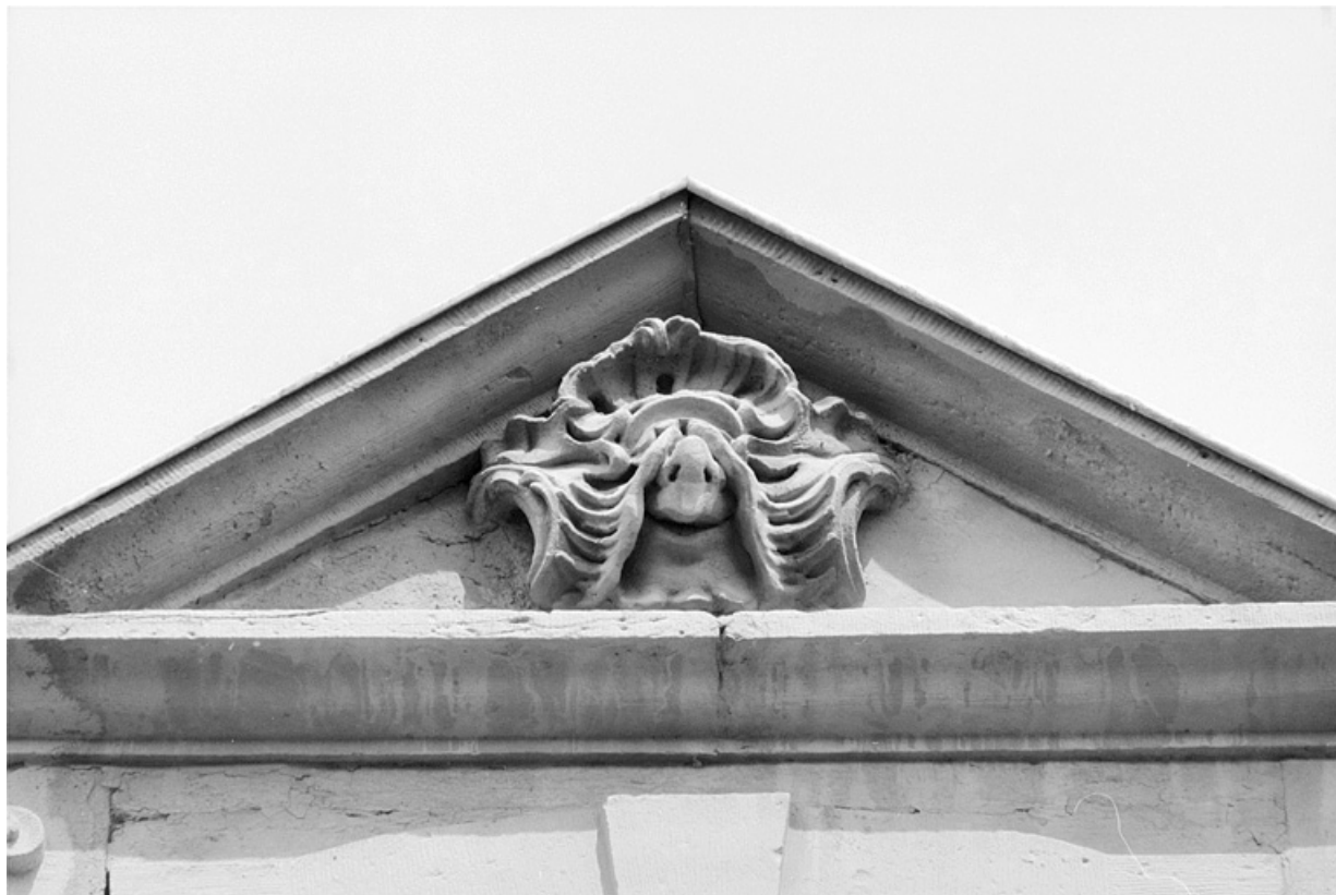
Façade principale, détail de la grande lucarne.