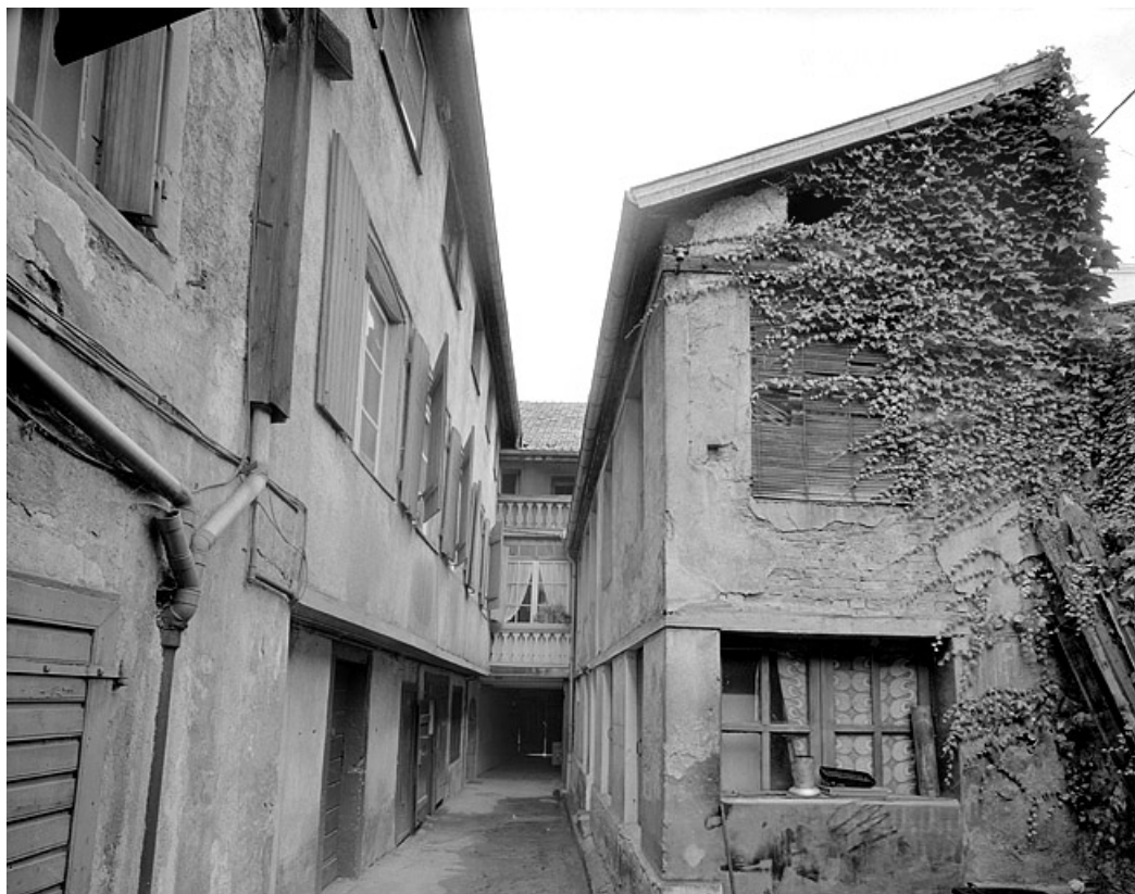
Vue d'ensemble de la cour vers le corps de bâtiment sur rue.

25, Montbéliard, 31 rue du Faubourg de Besançon