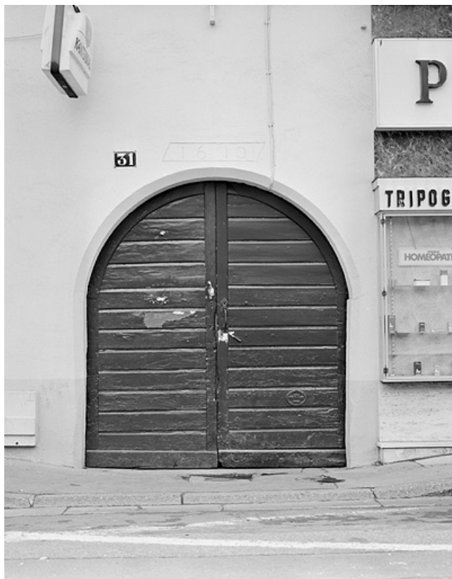
Façade sur rue. Détail de la porte cochère et de la date.

25, Montbéliard, 31 rue du Faubourg de Besançon