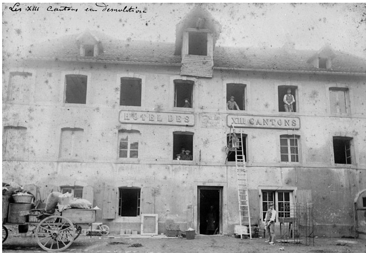
Vue de la façade nord, vers 1900.

25, Montbéliard, 15 rue du Faubourg de Besançon