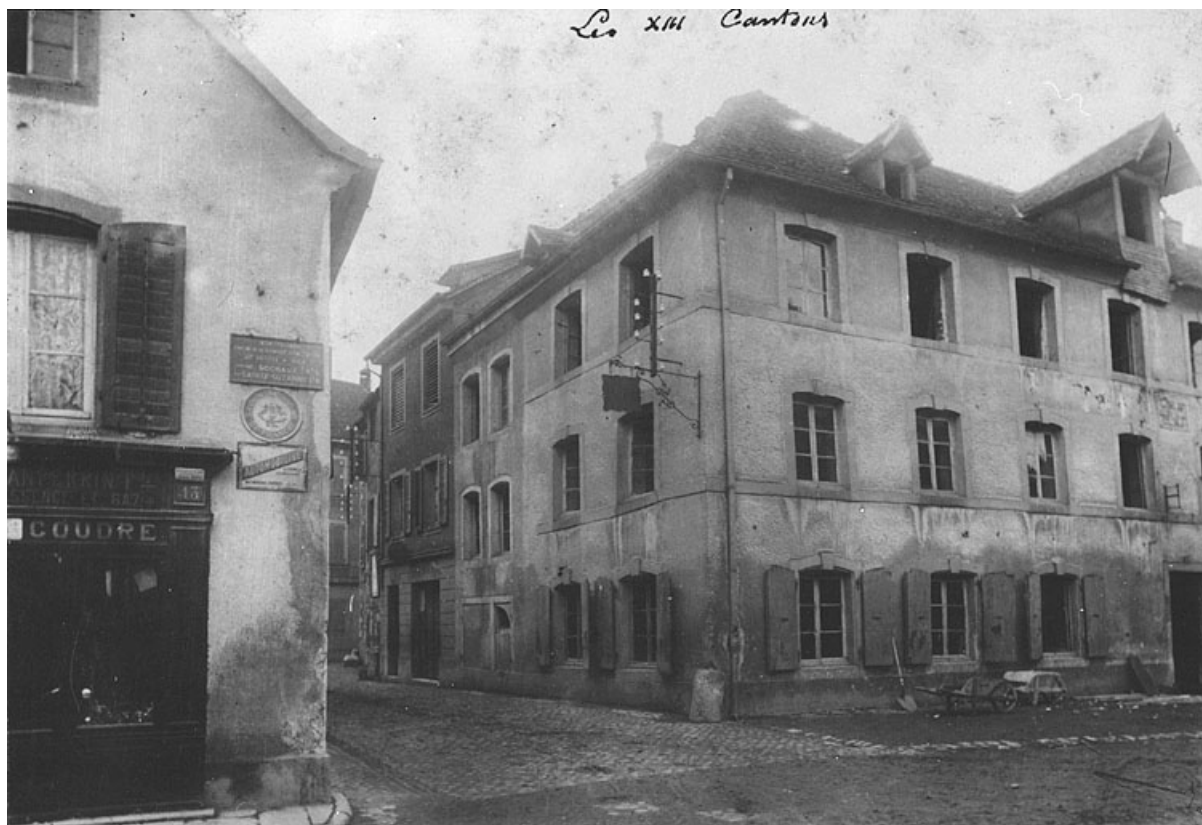
Vue de la façade est et d'une partie de la façade nord, vers 1900.

25, Montbéliard, 15 rue du Faubourg de Besançon