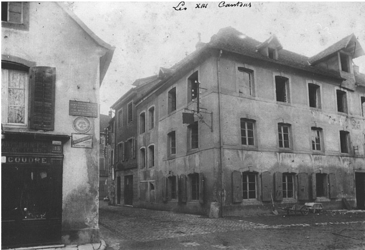
Vue de la façade est et d'une partie de la façade nord, vers 1900.

25, Montbéliard, 15 rue du Faubourg de Besançon