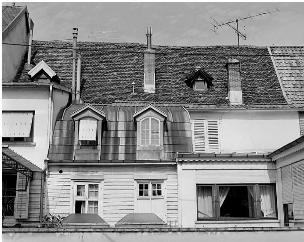
Façade sur cour vue à partir du premier étage.

25, Montbéliard, 35 place Denfert-Rochereau