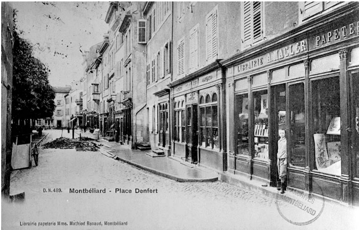
Montbéliard. Place Denfert [vue de la devanture], début 20e siècle.

25, Montbéliard, 35 place Denfert-Rochereau