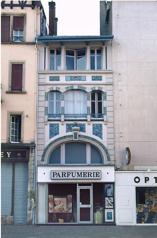
Façade sur la rue Cuvier. 25, Montbéliard, 8 rue Cuvier