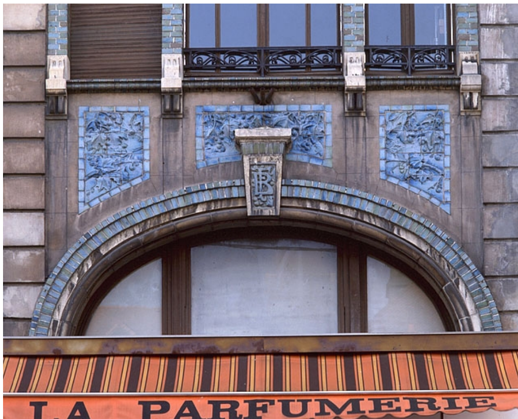
Façade sur la rue Cuvier, détail.