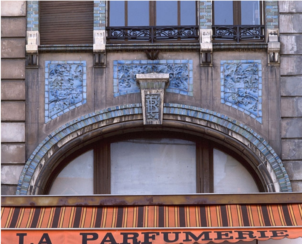
Façade sur la rue Cuvier, détail.