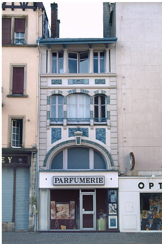
Façade sur la rue Cuvier. 25, Montbéliard, 8 rue Cuvier