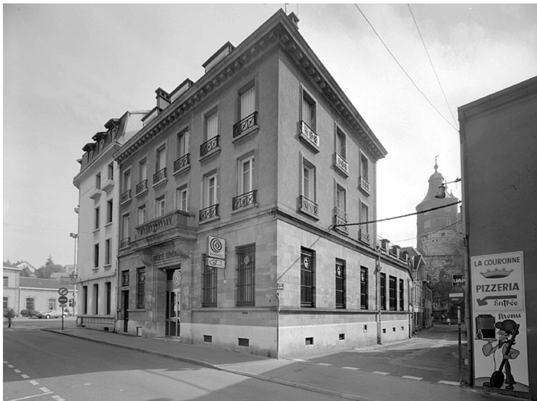
Vue d'ensemble à l'angle des rues Cuvier, à gauche, et de la Mouche, à droite. 25, Montbéliard, 68 rue Cuvier