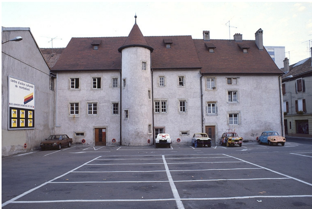
Façades sur cour des corps de bâtiment principaux de l'ancienne ferme.