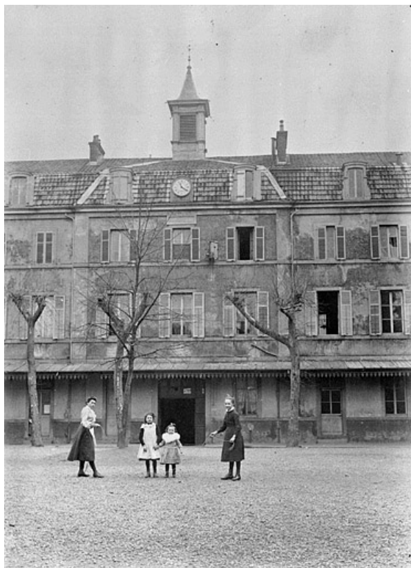
Collège Cuvier. Avant-corps central sur cour du bâtiment du collège édifié en 1873, début 20e siècle. 25, Montbéliard, 12, 14 rue du Collège