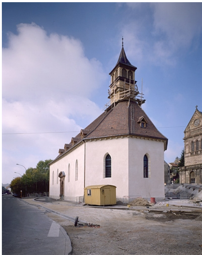
Vue d'ensemble des faces est et sud.