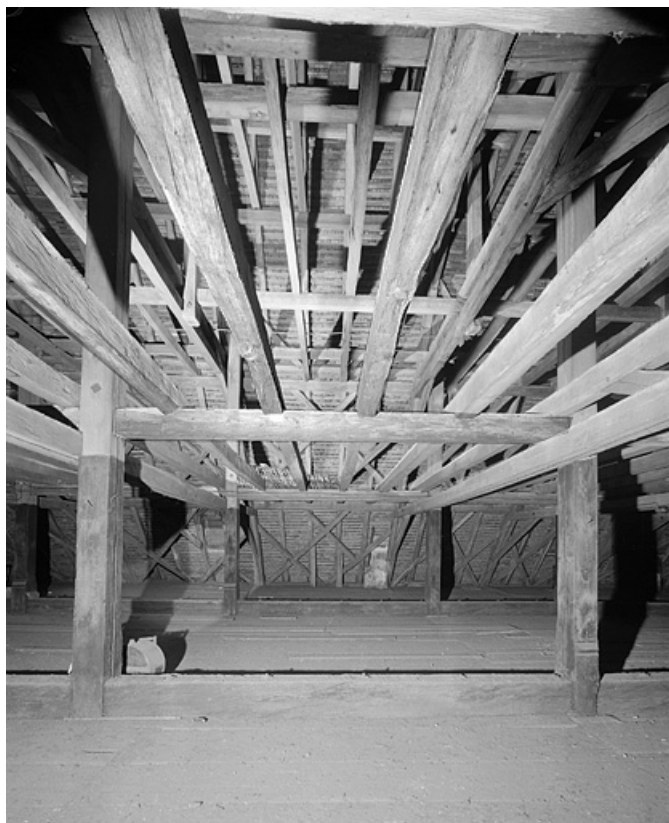
Charpente, vue latérale.