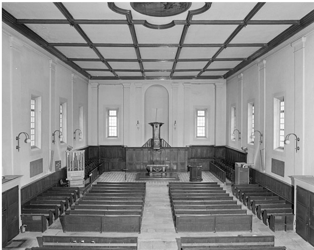
Vue intérieure vers l'est.