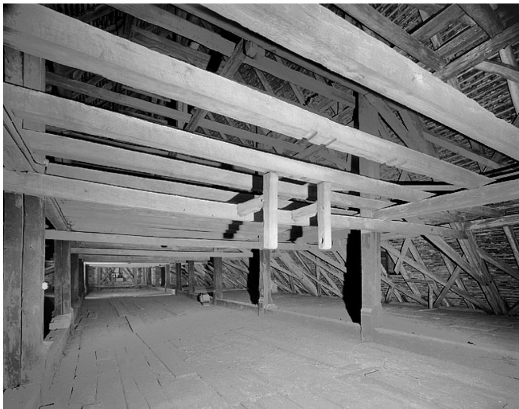
Charpente, vue d'ensemble vers l'est. 25, Montbéliard place Saint-Martin