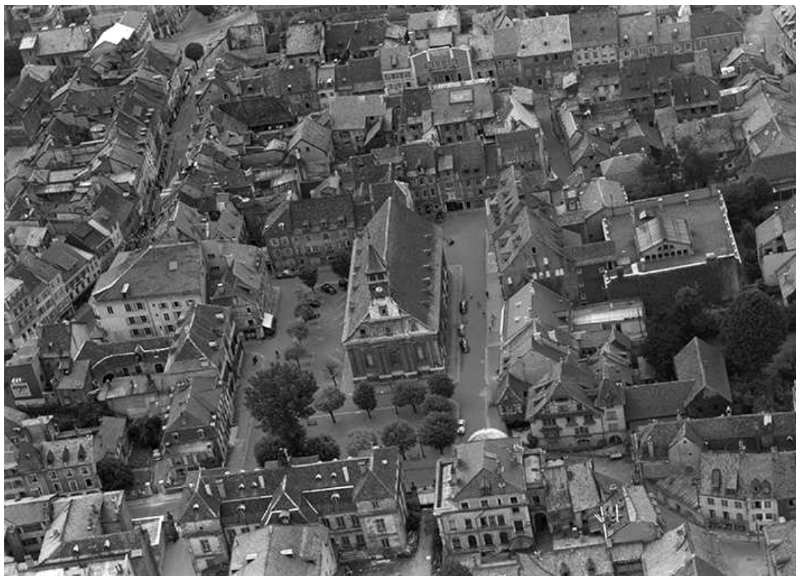
Vue aérienne en 1956. 25, Montbéliard place Saint-Martin