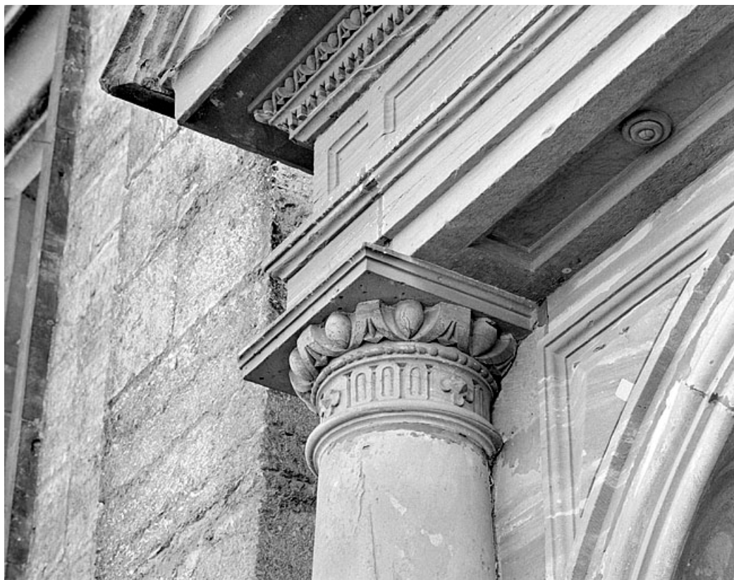
Portail nord, détail.