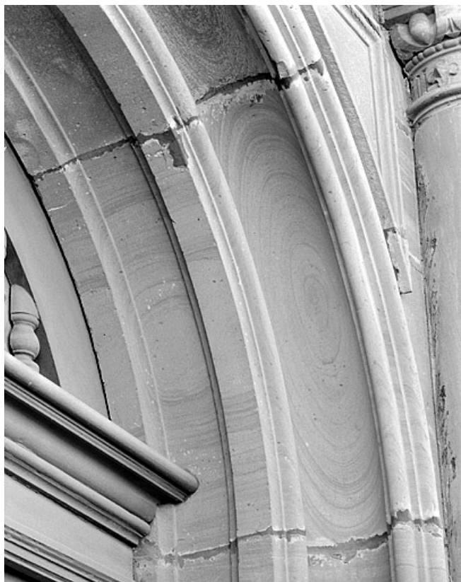
Portail nord, détail.