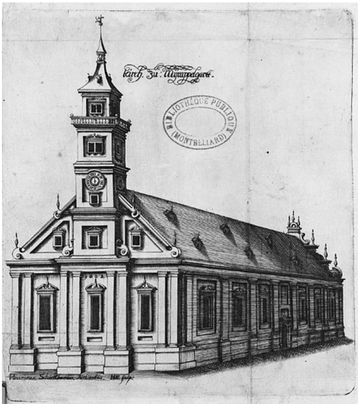
Kirch zu Mümpelgart, 1602. 25, Montbéliard place Saint-Martin