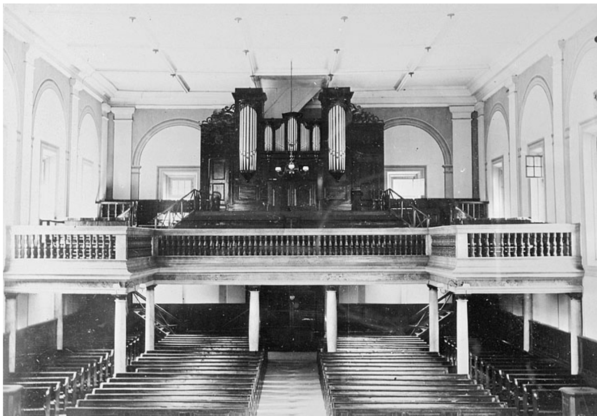
Vue intérieure, fin 19e siècle.