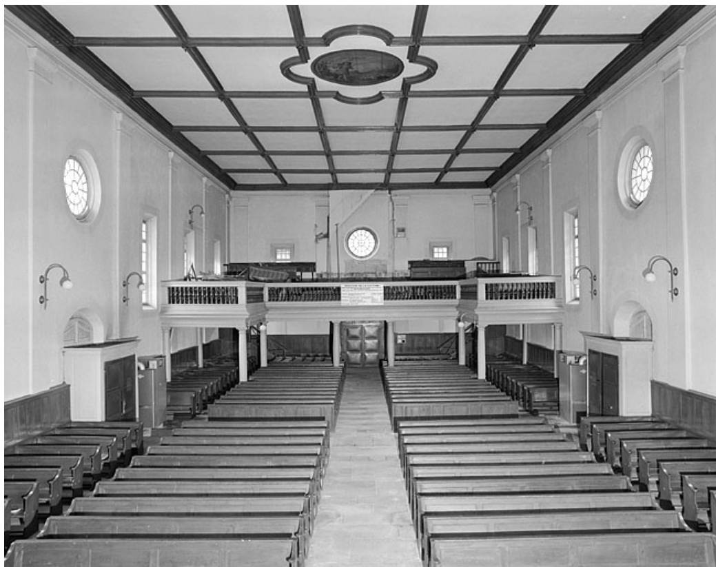
Vue intérieure vers l'ouest.