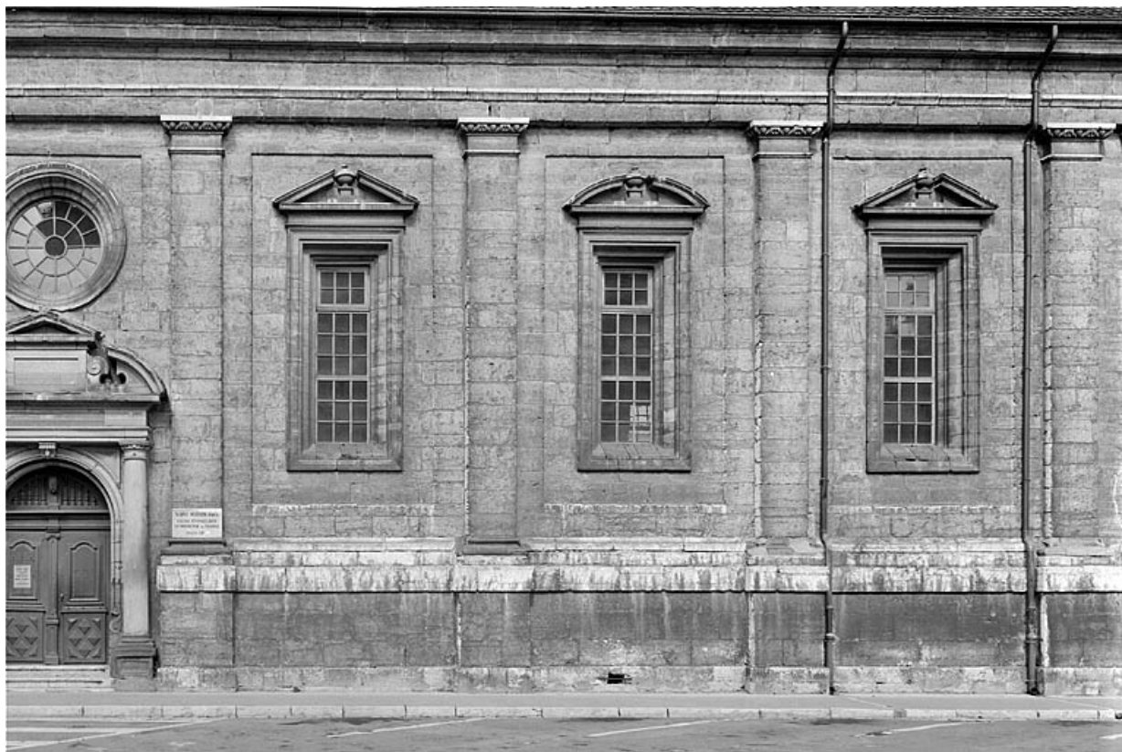
Façade sud, travées de droite.