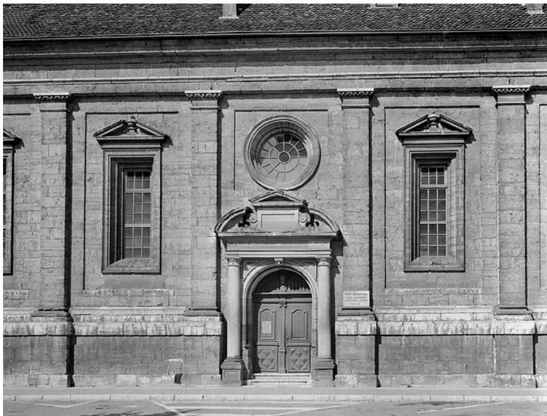
Façade sud, travées centrales. 25, Montbéliard place Saint-Martin