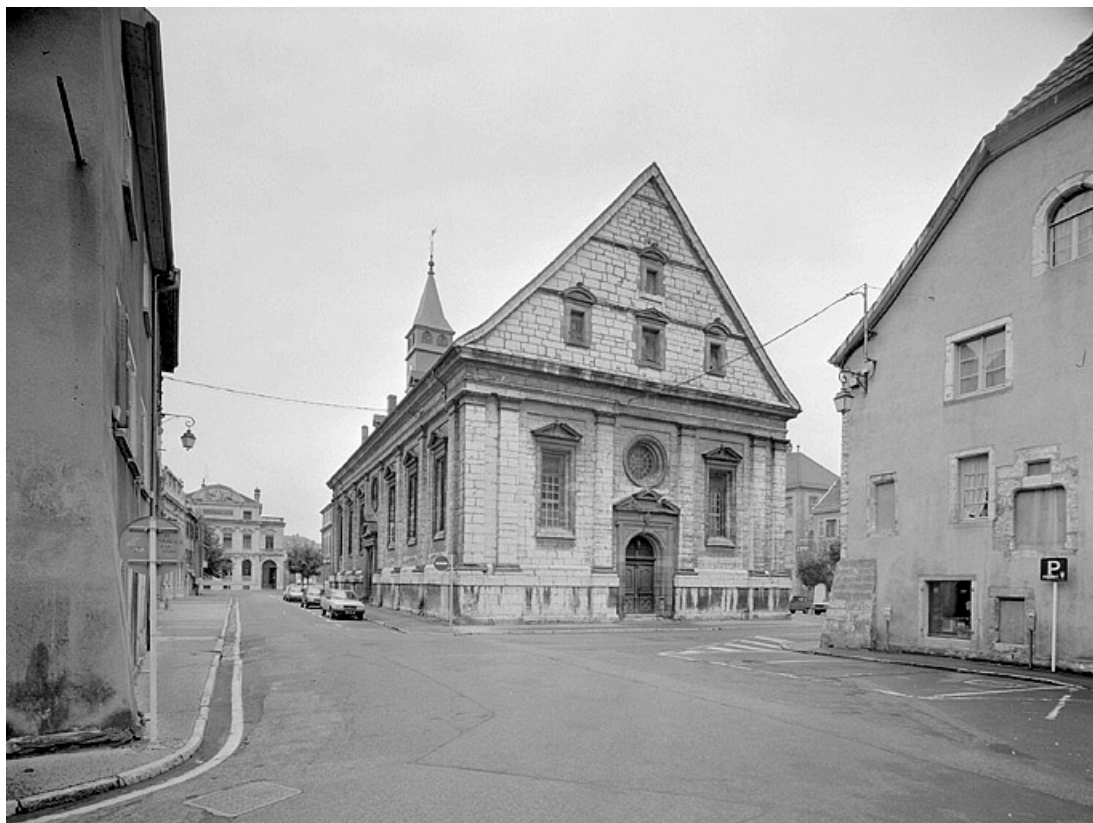
Façades ouest et nord.