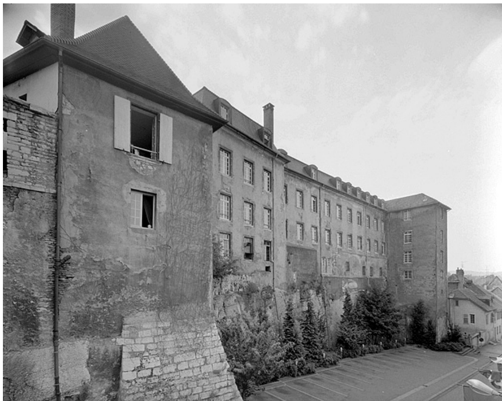
Façade nord et tour du Puits au fond. 25, Montbéliard cour du Château