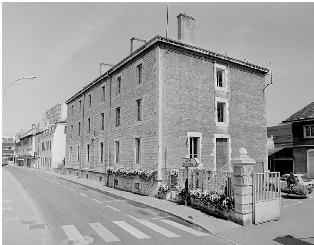
Façade principale et façade latérale droite.