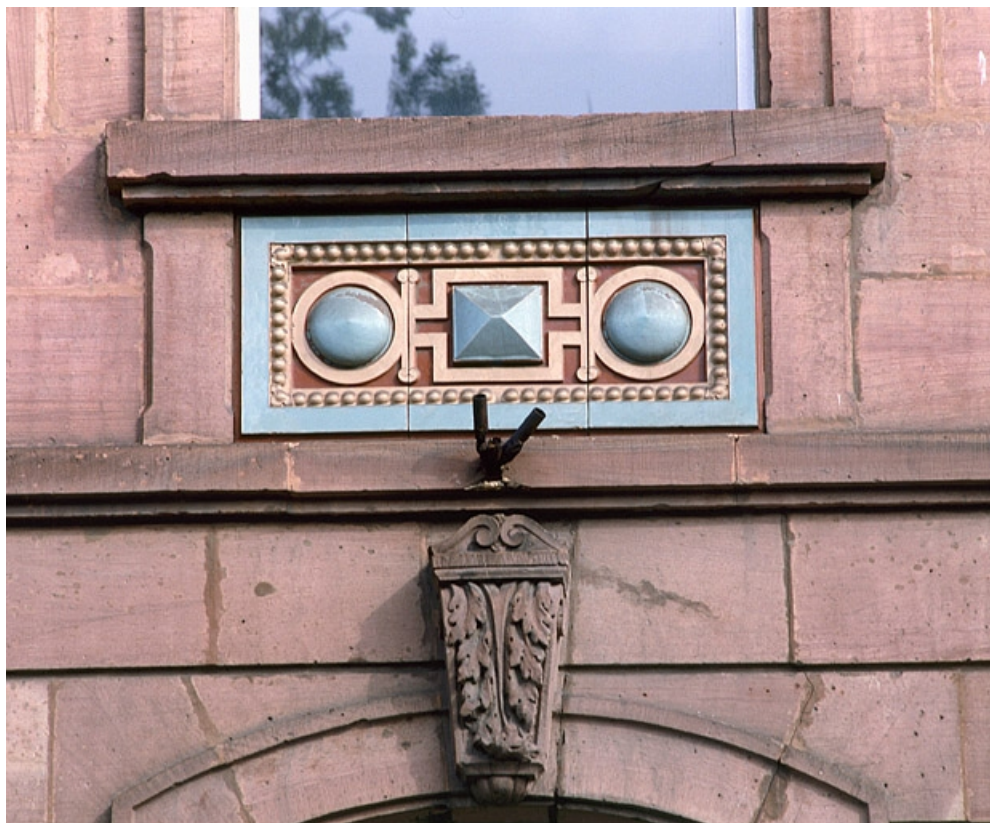
Façade principale, avant-corps, allège en céramique d'une fenêtre du premier étage. 25, Montbéliard, 15 avenue Wilson