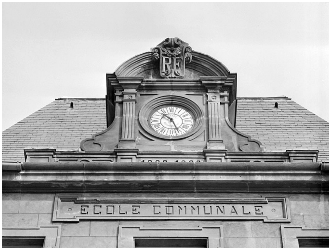
Façade principale, détail de l'horloge. 25, Montbéliard, 15 avenue Wilson