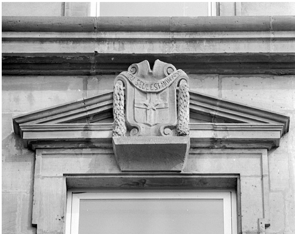
Façade principale, avant-corps, fenêtre du premier étage aux armes de la ville. 25, Montbéliard, 15 avenue Wilson