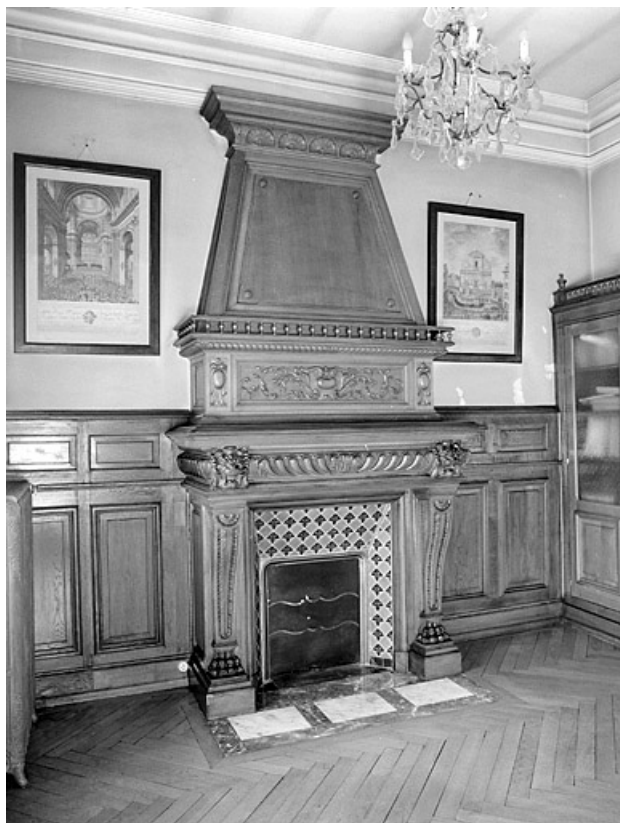
Banque. Cheminée au premier étage. 25, Montbéliard, 13 place Saint-Martin