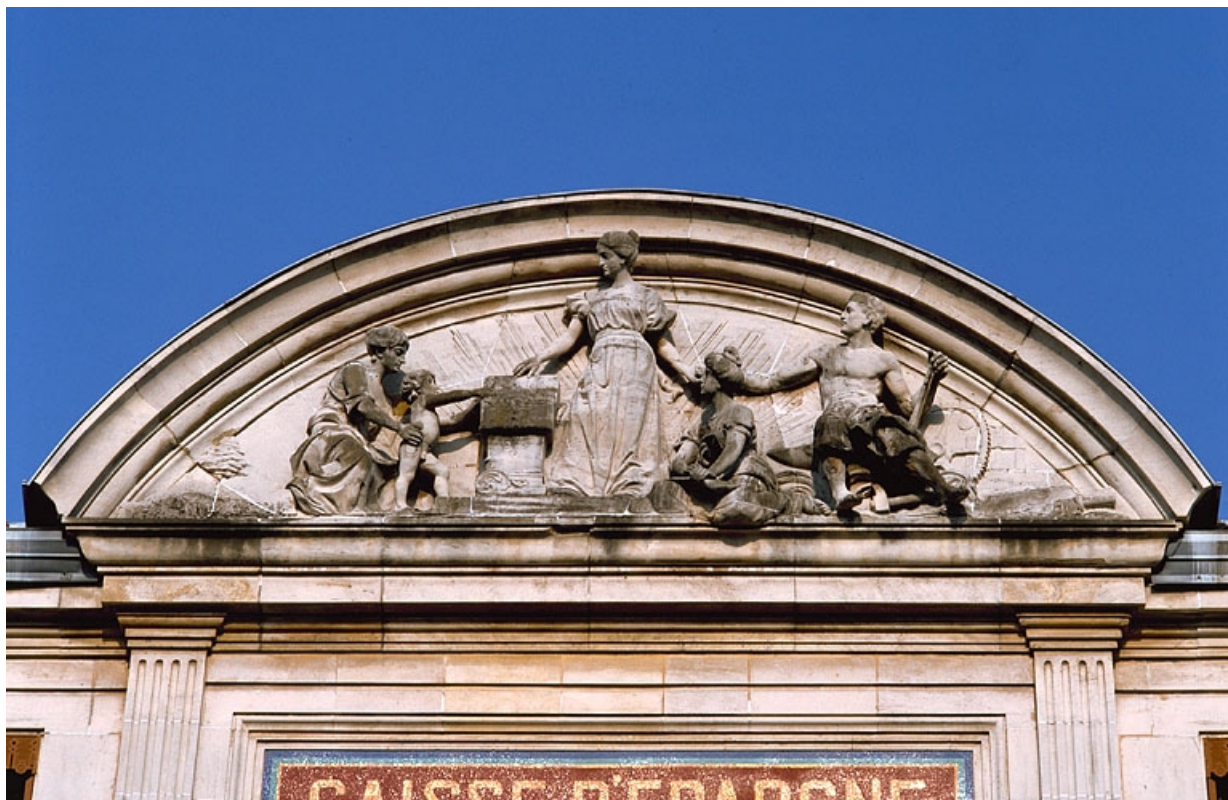
Banque. Façade principale, fronton. 25, Montbéliard, 13 place Saint-Martin