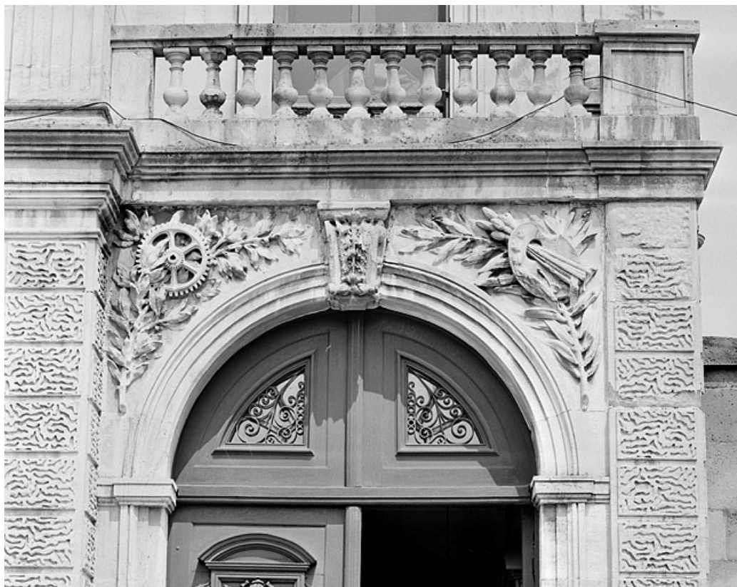
Banque. Façade principale, détail de la porte bâtarde.