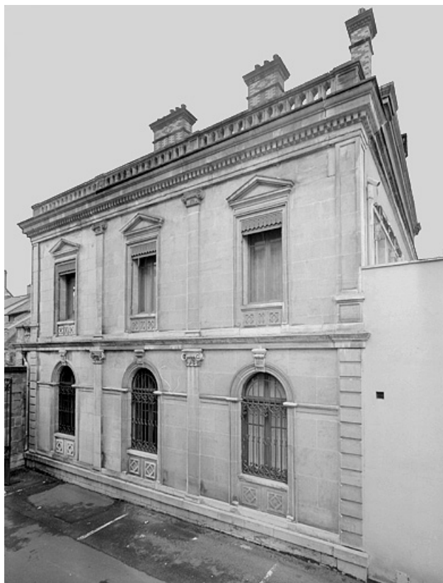
Banque. Façade sur la cour de l'Hôtel de Ville.