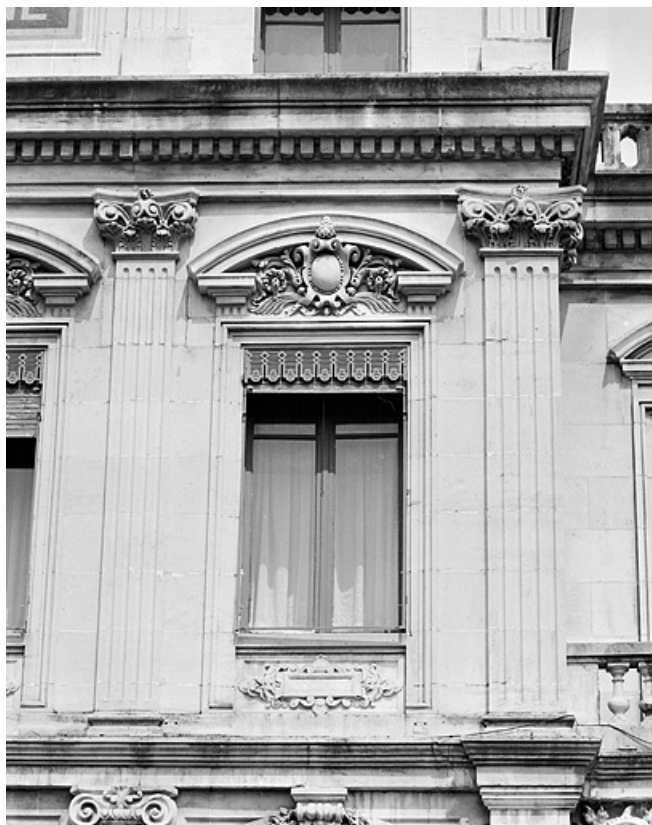
Banque. Façade principale, fenêtre de l'étage. 25, Montbéliard, 13 place Saint-Martin