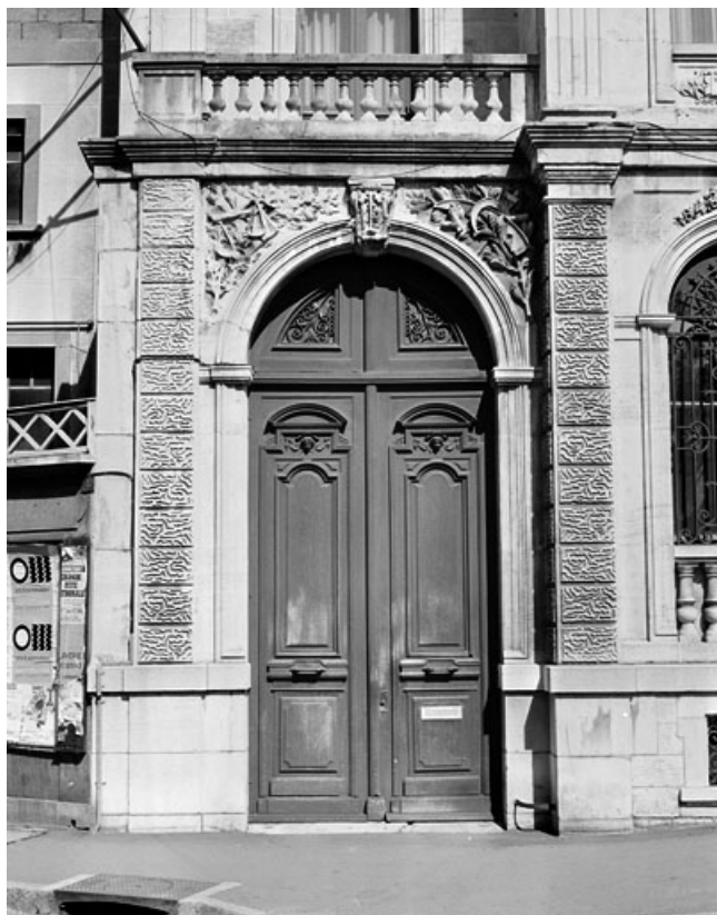
Banque. Façade principale, porte cochère. 25, Montbéliard, 13 place Saint-Martin