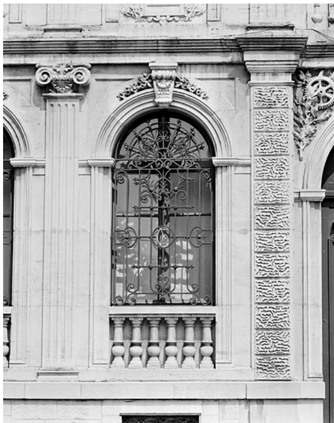
Banque. Façade principale, fenêtre du rez-de-chaussée. 25, Montbéliard, 13 place Saint-Martin