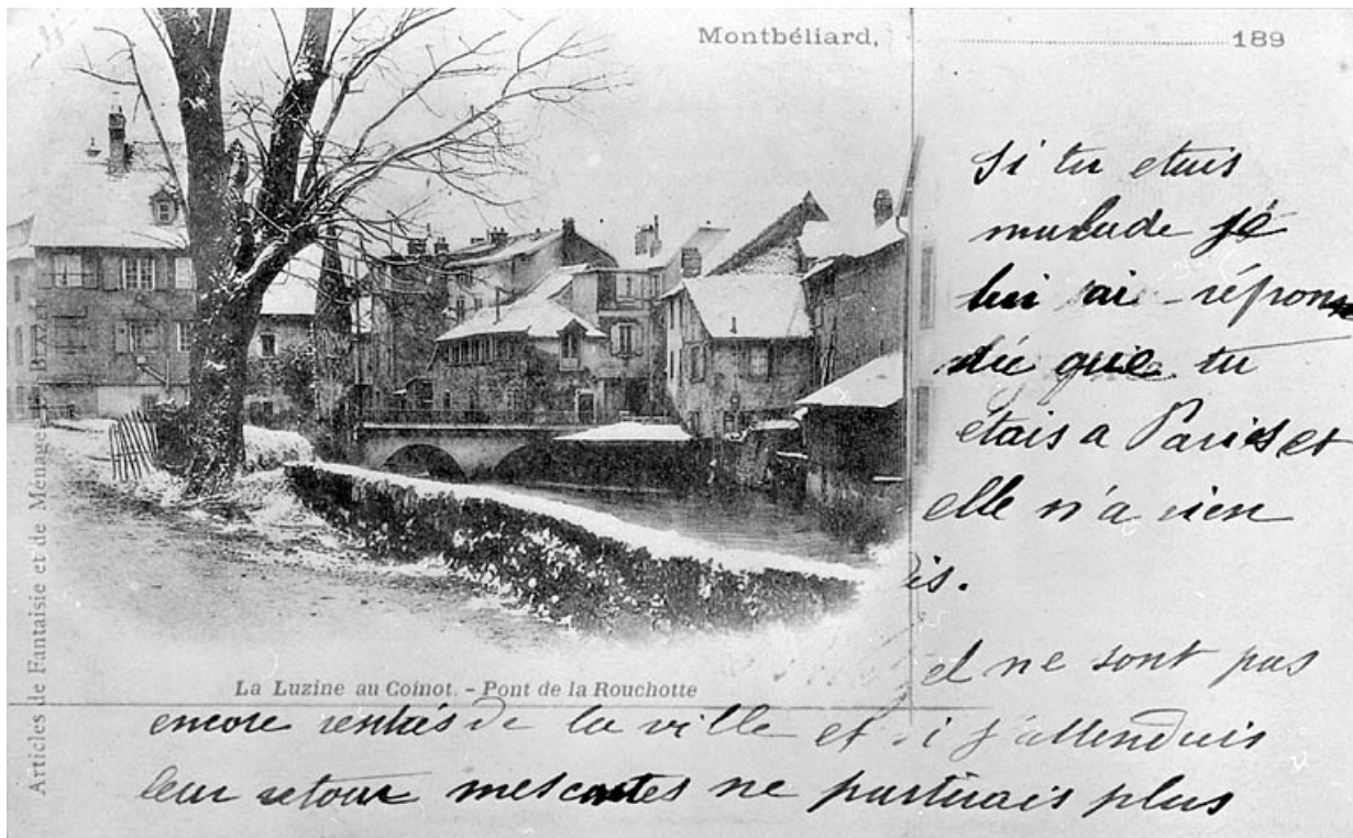
La Luzine au Coinot. Pont de la Rouchotte, années 1890. 25, Montbéliard rue du Général Leclerc