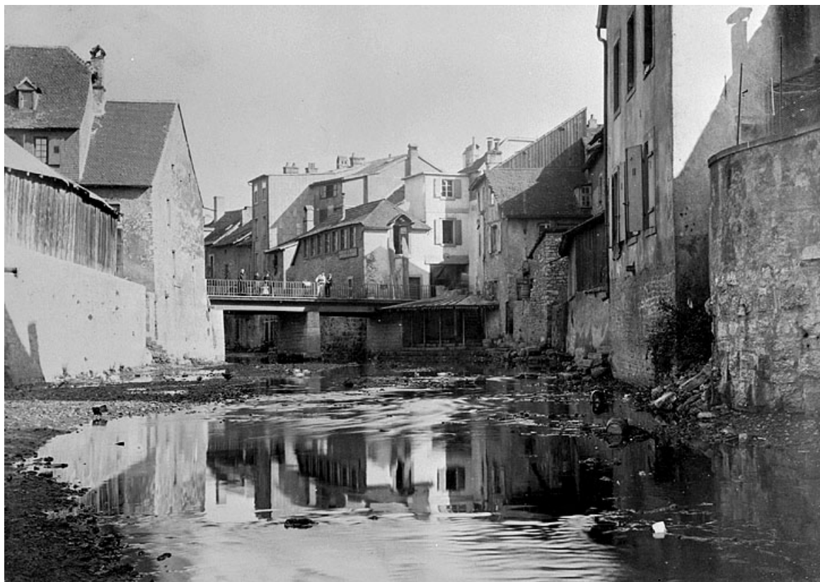
Vue côté aval, début 20e siècle.