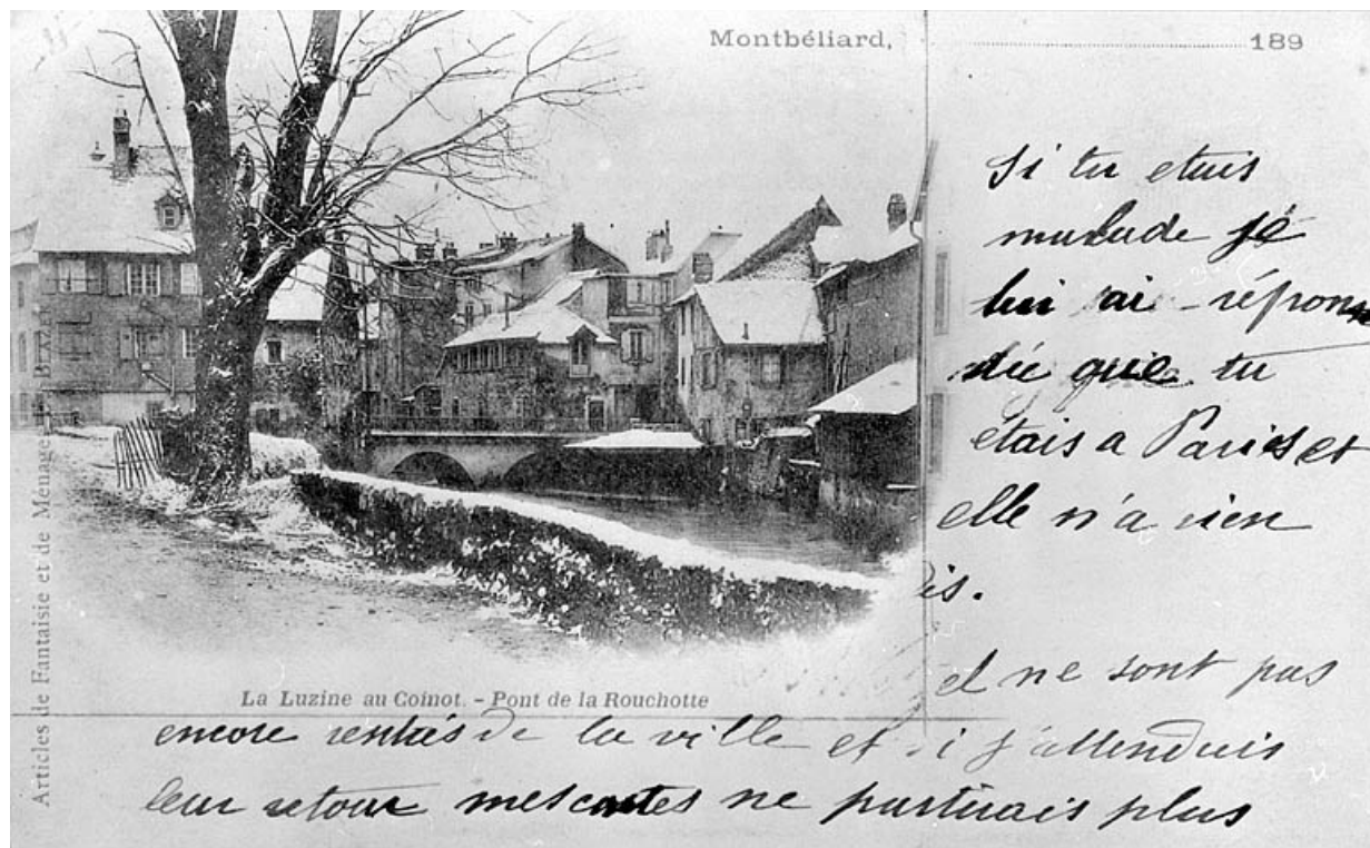
La Luzine au Coinot. Pont de la Rouchotte, années 1890. 25, Montbéliard rue du Général Leclerc

Carte postale, années 1890.