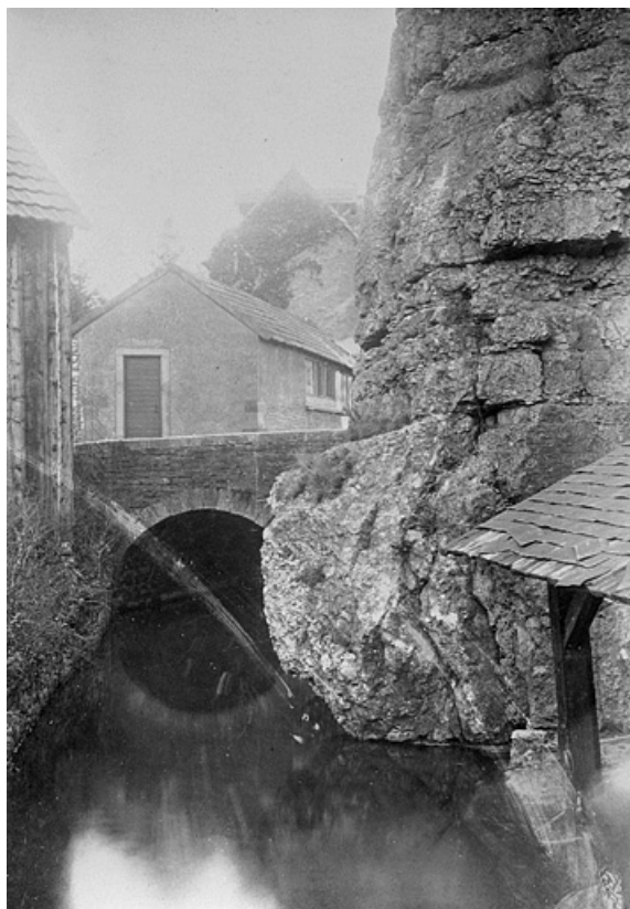
Pont Sous-le-Châtel vu de l'aval, fin 19e ou début 20e siècle. 25, Montbéliard rue du Château