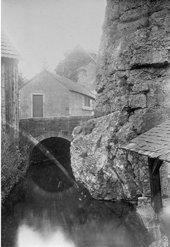
Pont Sous-le-Châtel vu de l'aval, fin 19e ou début 20e siècle. 25, Montbéliard rue du Château

Photographie, fin 19e ou début 20e siècle. Lieu de conservation : Archives communales, Montbéliard. Cote : collection Blazer, 1 Fi 18, n° 51