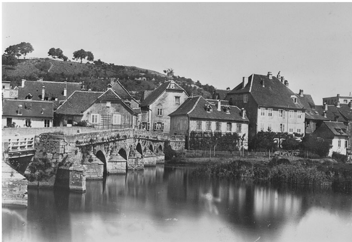
Vue d'ensemble, avant 1870. 25, Montbéliard