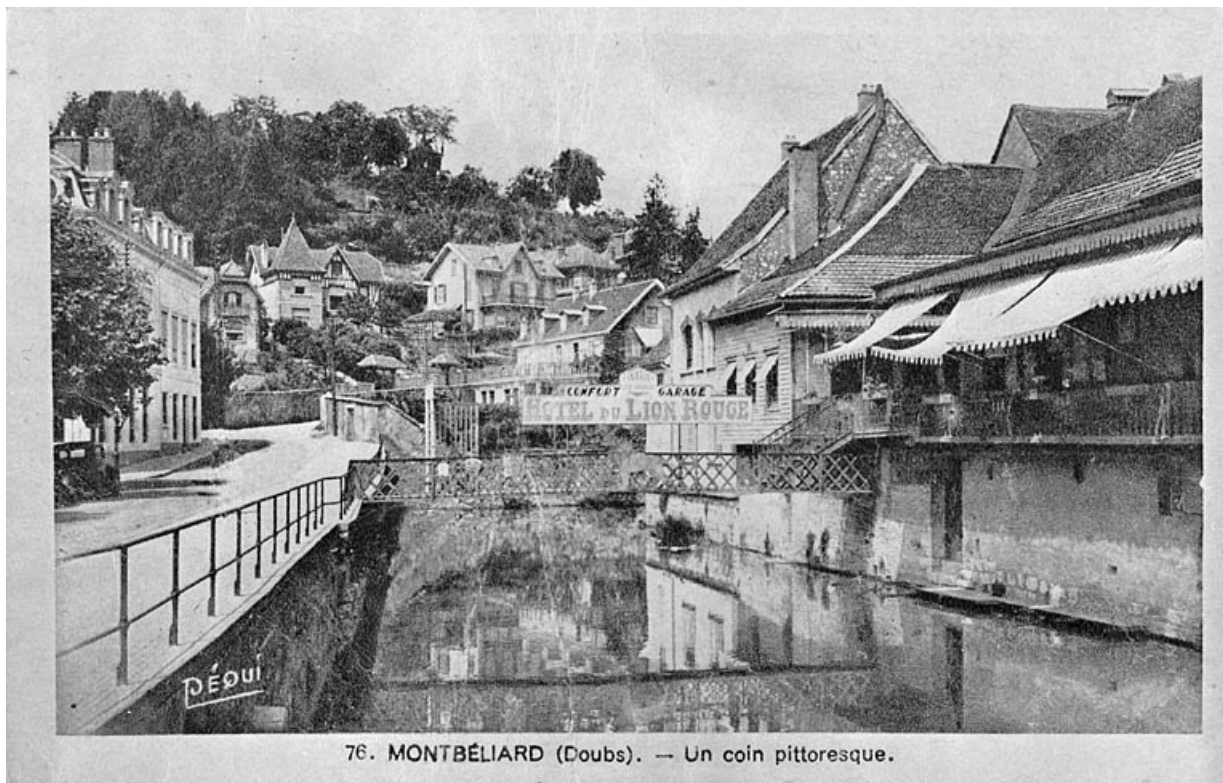
76. MONTBÉLIARD (Doubs). — Un coin pittoresque.

Montbéliard (Doubs). Un coin pittoresque [passerelle de l'hôtel du Lion Rouge], début 20e siècle. 25, Montbéliard