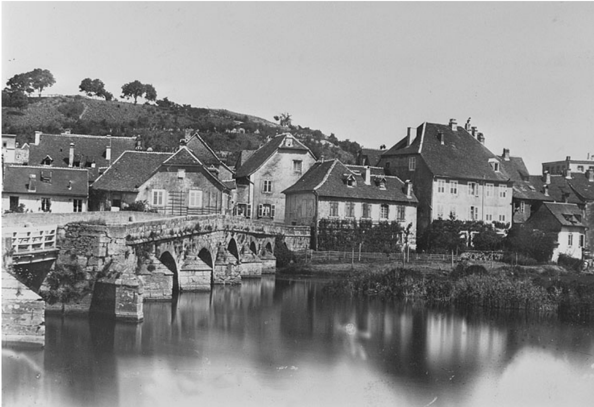
Vue d'ensemble, avant 1870. 25, Montbéliard

Photographie, avant 1870. Cote : collection Blazer, 1 Fi 18, n° 138