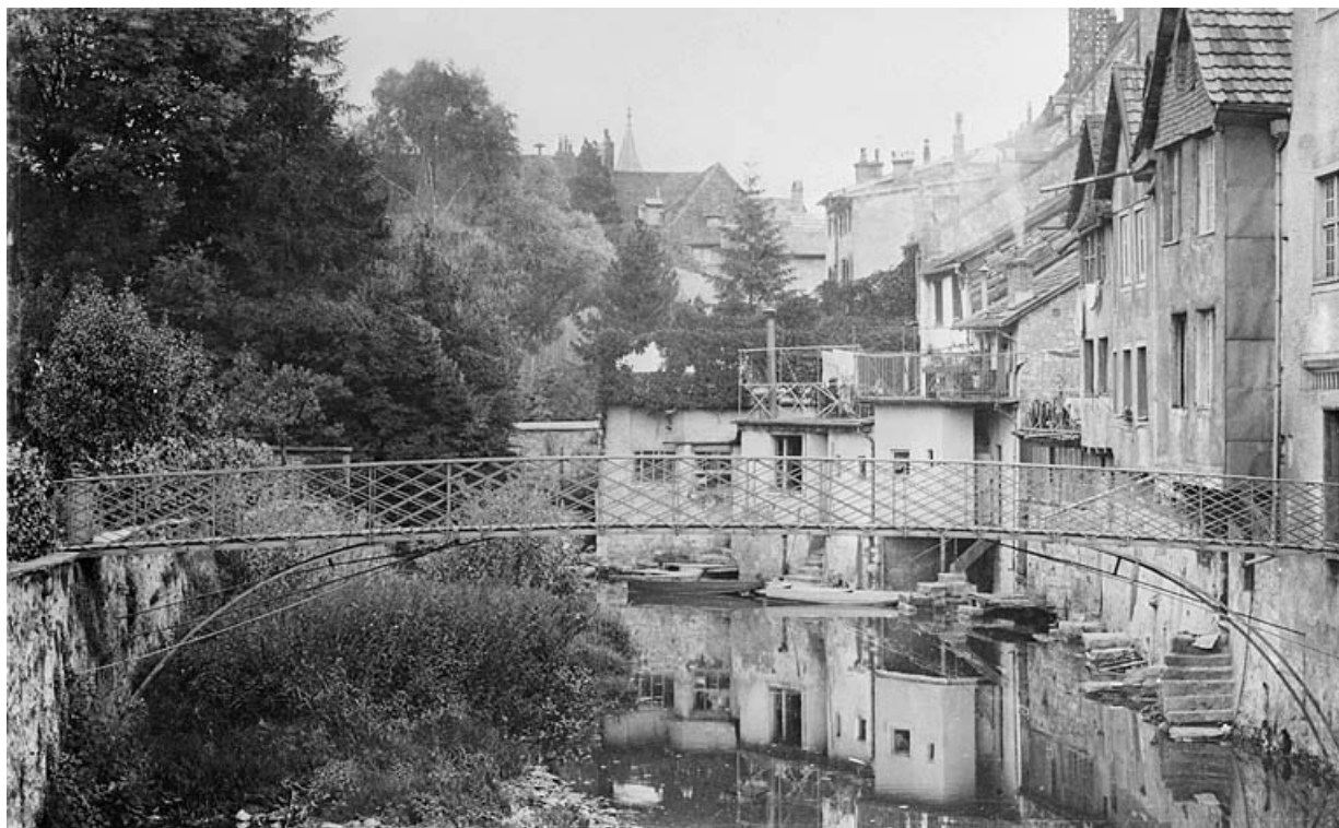
Passerelle de la maison 34, rue des Halles, milieu 20e siècle. 25, Montbéliard