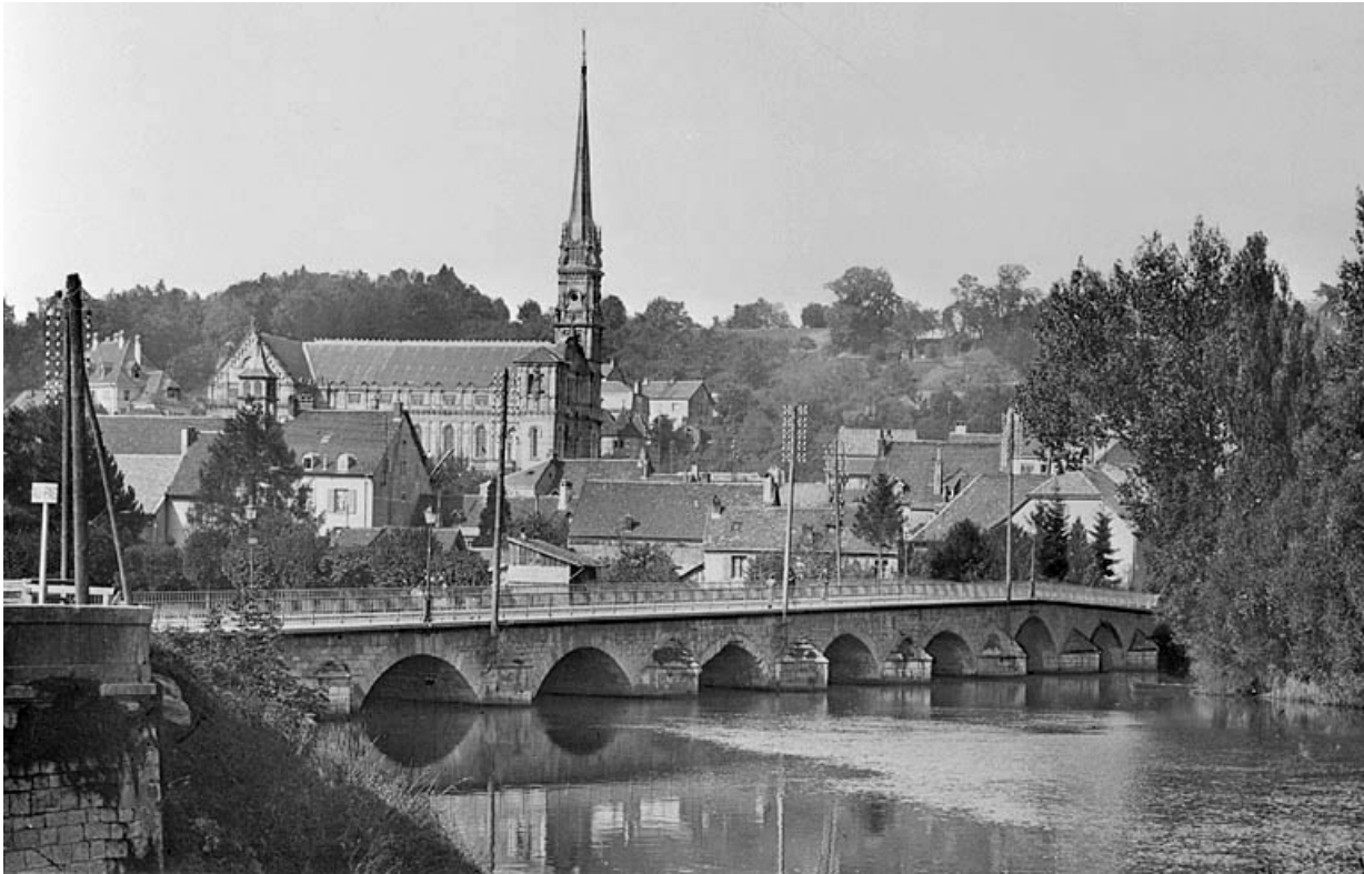
Vue d'ensemble, 1er tiers 20e siècle.