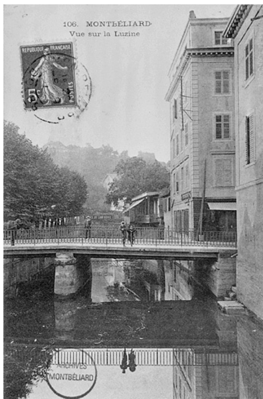
Montbéliard. Vue sur la Luzine [pont des Halles], début 20e siècle. 25, Montbéliard