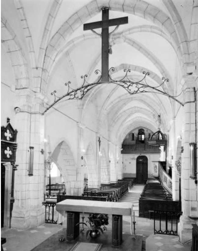
La nef vue du chœur.