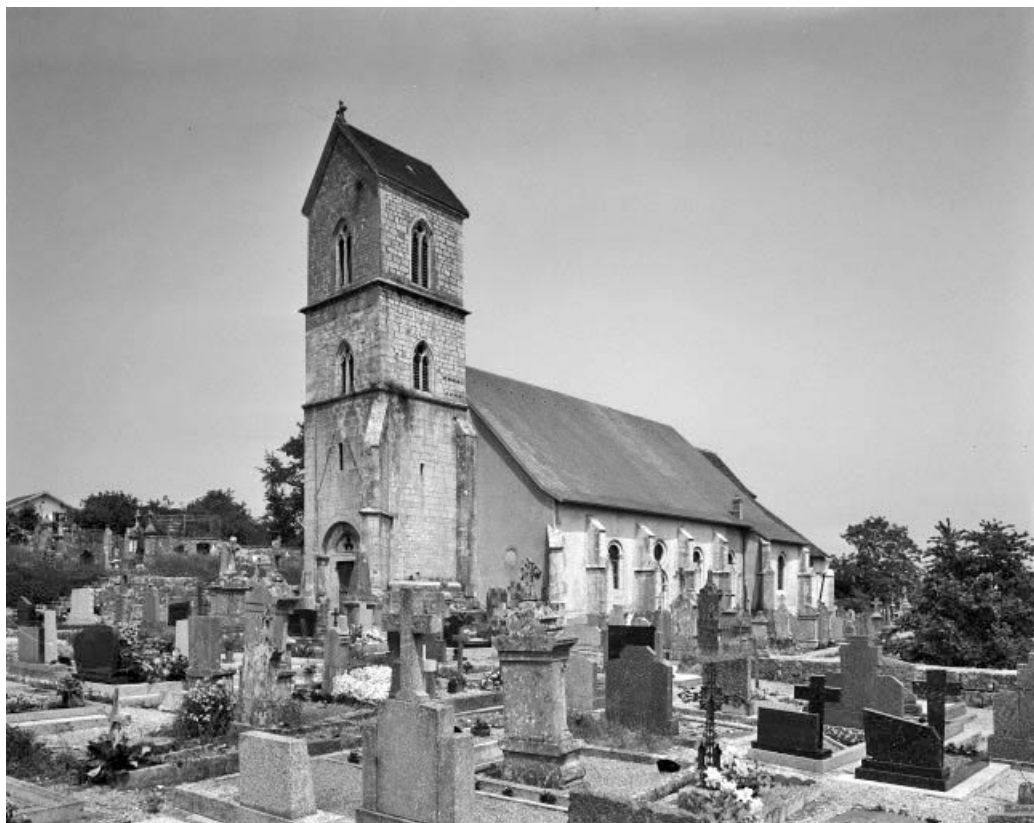
Façades antérieure et latérale droite.