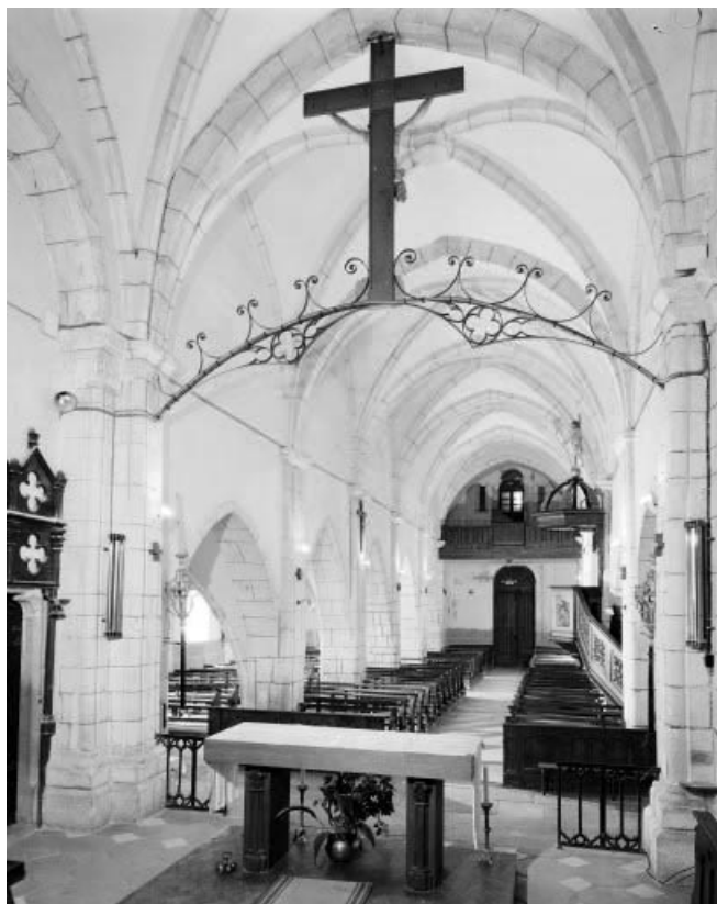
La nef vue du chœur.