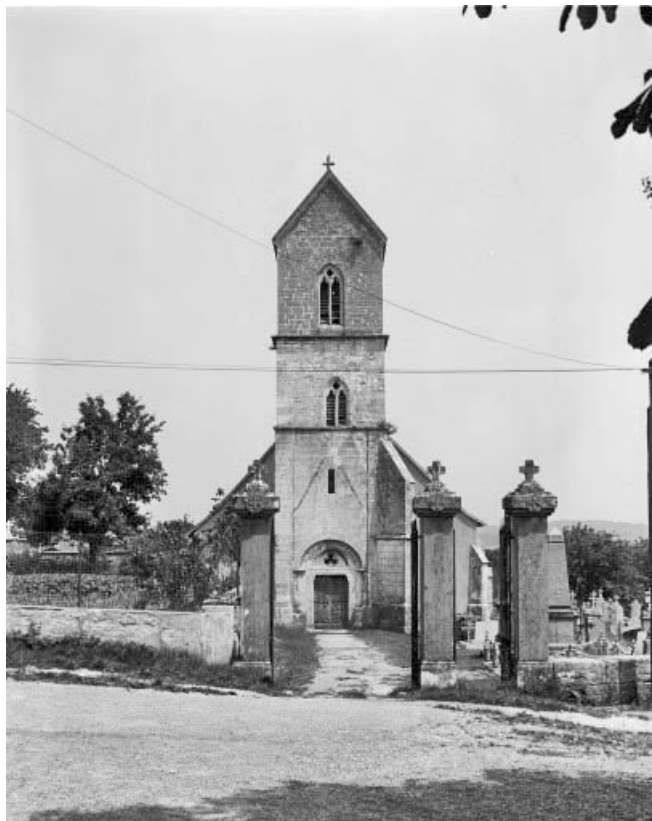
Élévation antérieure. 90, Saint-Dizier-l'Évêque