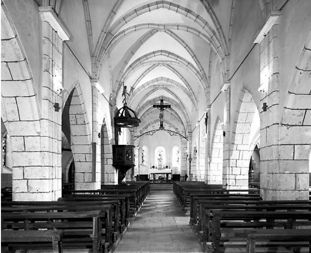
La nef vue depuis l'entrée.