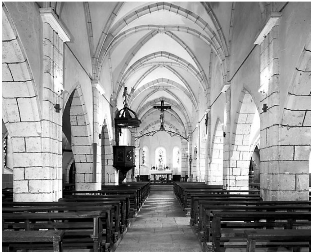
La nef vue depuis l'entrée.