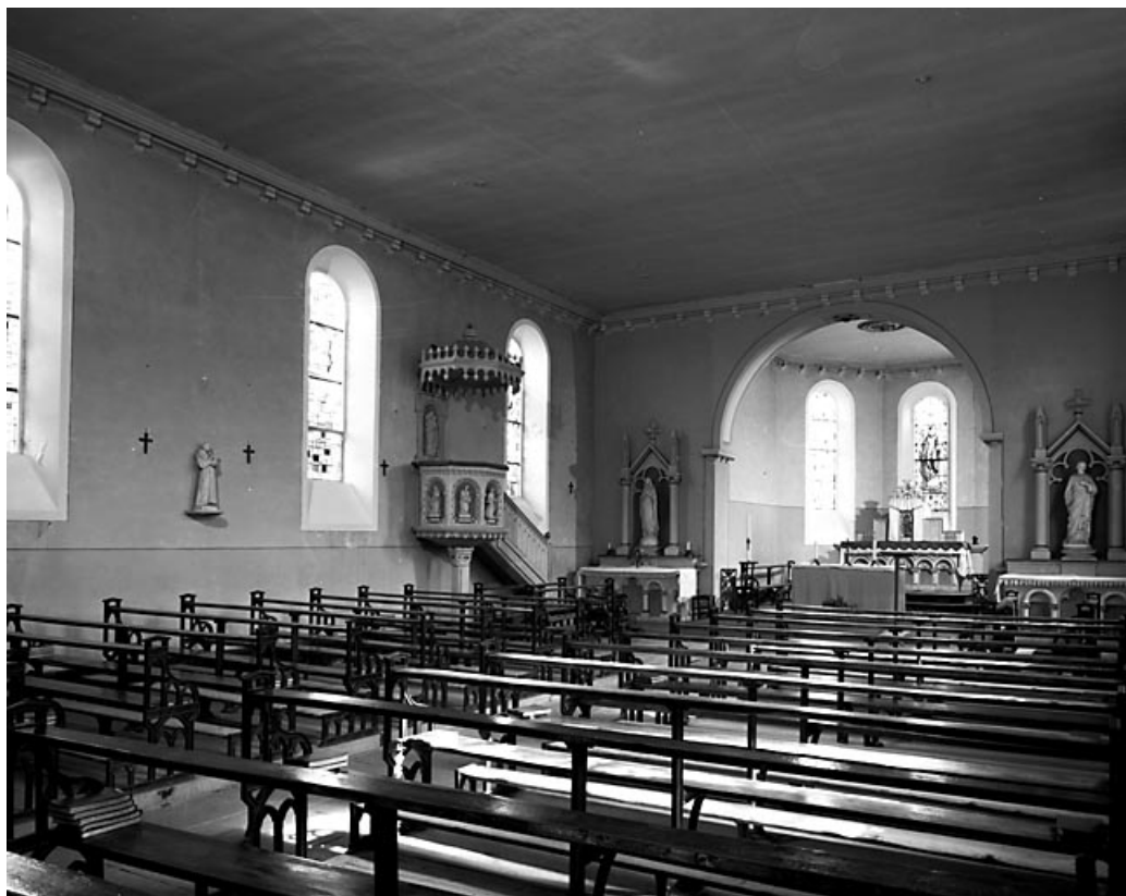
La nef vue depuis l'entrée.