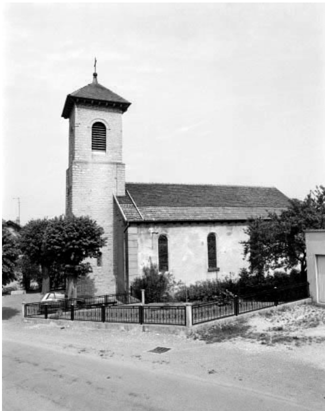
Façade latérale droite. 90, Montbouton