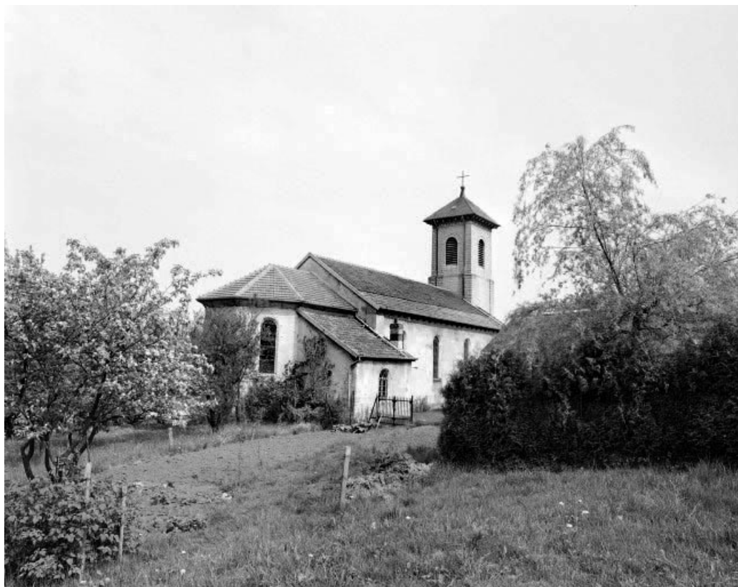
Façade latérale droite et chevet.