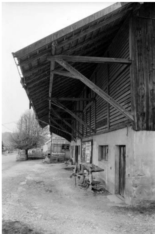
Partie agricole : avant-toit sur façade antérieure.