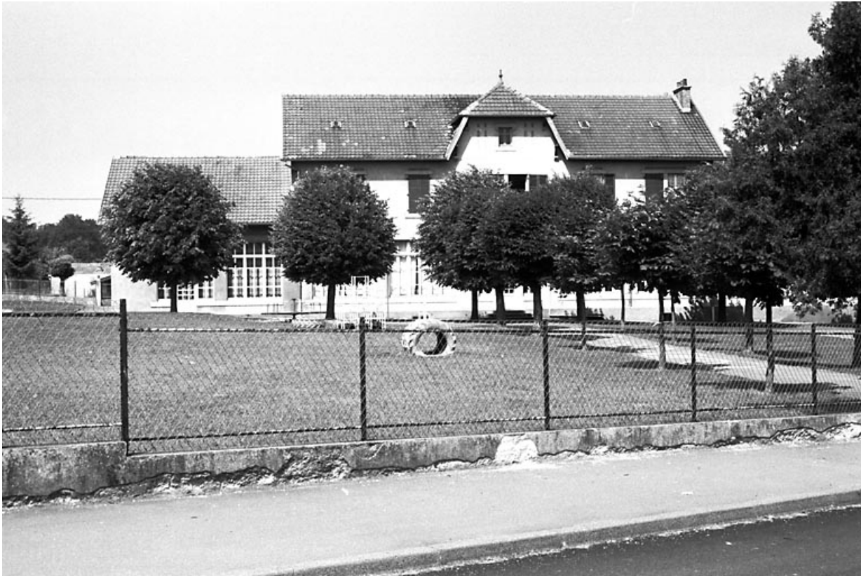
Groupe scolaire en 1989. SRI. Inventaire topographique du canton de Beaucourt (1981-1982).

90, Beaucourt, lieudit : cité Eugène Bornèque